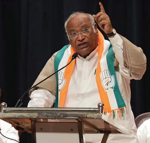
યોજના પર પુનર્વિચાર કરશે કારણ કે તેમાંથી કેટલીક તેમની ટિકિટ માટે ચૂકવણી કરવા માંગે છે.

ખડગેએ ગુરુવારે નાયબ મુખ્યપ્રધાન ડીકે શિવકુમારને એમ કહીને ખેંચ્યું કે લોકપ્રિય 'શક્તિ' કાર્યક્રમ પર પુનર્વિચાર કરવામાં આવશે. "તમારી પાંચ ગેરંટી જોઈને, મેં મહારાષ્ટ્રમાં પાંચ યોજનાઓની જાહેરાત કરી છે. પરંતુ તમે કહ્યું છે કે એક ગેરંટી રદ કરવામાં આવશે," ખડગેએ કહ્યું. અગાઉ બુધવારે, ડીકે શિવકુમારે કહ્યું હતું કે સરકાર મહિલાઓ માટે મફત બસ મુસાફરીની 'શક્તિ'