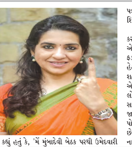
કહ્યું હતું કે, ‘મેં મુંબાઈથી બેઠક પરથી ઉમેદવારી

પત્ર ભર્યું છે. હું ભાજપમાંથી રાજીનામું આપીને શિવસેનામાં જોડાઈ ગયો છું. મહામુતિ ગઠબંધનમાં વિશ્વાસ વ્યક્ત કરતા તેમણે કહ્યું કે આ વખતે વિજય મુખ્યમંત્રી એકનાથ શિંદે અને ડેપ્યુટી સીએમ દેવેન્દ્ર ફડણવીસ અને અજિત પવારની આગેવાની હેઠળની હરીકાશીનો હશે. મુંબાઈથી એ મુંબઈ શહેર જિલ્લાના ૧૦ વિધાનસભા મતવિસ્તારોમાંથી એક છે. તાજેતરની ચૂંટણીમાં, મુંબઈ દક્ષિણ લોકસભા બેઠક શિવસેનાના યુપીટીના અરવિંદ સાવંતે જીતી હતી. તેમણે શિવસેનાના યામિની જાધવને હરાવ્યા હતા. હવે અરવિંદ સાવંત પોતાની શુદ્ધ ટિપ્પણીના કારણે વિવાદમાં ફસાયા છે. શાઈના એનસીએ તેની વિરુદ્ધ મુંબઈના નાગપાડા પોલીસ સ્ટેશનમાં ફરિયાદ નોંધાવી