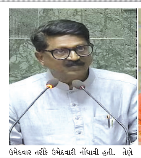
ઉમેદવાર તરીકે ઉમેદવારી નોંધાવી હતી. તેણે

તે સાવંતની આ અભદ્ર ટિપ્પણી સામે ફરિયાદ નોંધાવવા આવી છે. શાઈનાએ એમ પણ કહ્યું હતું કે તેને કોઈ પાર્ટી પાસેથી ‘સટિક્રિકેટ’ જોઈતું નથી. શુક્રવારે તેણે સાવંત પર પ્રહાર કરતા કહ્યું કે, ‘આ એ જ અરવિંદ સાવંત છે, જેમના માટે અમે વર્ષ ૨૦૧૪ અને ૨૦૧૯માં પ્રચાર કર્યો હતો. શાઈનાએ કહ્યું, ‘તેની માનસિકતા જુઓ જ્યારે તે કોઈ મહિલાને આઈટમ કહે છે. હું તેમને કહેવા માંગુ છું કે આ જ મતદારો તેમને ચૂંટણીમાં ડુ:ખી કરશે. મહારાષ્ટ્ર વિધાનસભા ચૂંટણી પહેલા, ભાજપના પ્રવક્તા શાઈના એનસીએ તેમની પાર્ટીમાંથી રાજીનામું આપ્યું હતું અને મંગળવારે મુંબઈમાં મુખ્યાલેવી વિધાનસભા મતવિસ્તારમાંથી એકનાથ શિંદેની આગેવાની હેઠળની શિવસેનાના