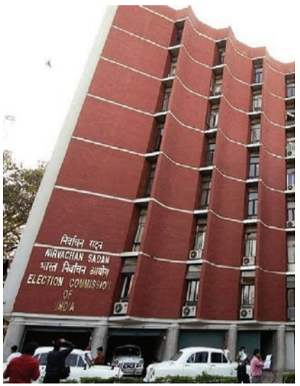
કોંગ્રેસ પાર્ટીને લખેલા પત્રમાં ચૂંટણી પંચે તેના પર ‘સામાન્ય’ શંકાનો દાવો કરીને હવા બનાવવાનો આરોપ લગાવ્યો છે. આ સંદર્ભમાં પંચે કોંગ્રેસને ભવિષ્યમાં પાયાવિહીણ આરોપોથી દૂર રહેવાની કડક સલાહ પણ આપી છે. એટલું જ નહીં, ચૂંટણી પંચે કોંગ્રેસ અને અન્ય રાજકીય પક્ષોને મતદાન અને ગણતરીના દિવસો જેવા સંવેદનશીલ સમયે પાયાવિહીણ અને સનસનાટીભરી ફરિયાદો કરવા સામે ચેતવણી આપી હતી. તેમને ચેતવણી આપવામાં આવી છે કે આ પ્રયાસો ક્યારેય સત્યને

નવીદિલ્હી તા. ૧ હરિયાણા વિધાનસભા ચૂંટણીમાં ગેરરીતિનો આરોપ લગાવતા કોંગ્રેસે ફરી એકવાર ચૂંટણી પંચને ઘેરું છે. કોંગ્રેસે કહ્યું કે હરિયાણા ચૂંટણી સંબંધિત તેની ફરિયાદો પર સ્પષ્ટીકરણ આપવાને બદલે પંચે અસ્પષ્ટ જવાબો આપ્યા. આટલું જ નહીં, તેણે EC પર પોતાને ક્લીનચીટ આપવાનો પણ આરોપ લગાવ્યો. કોંગ્રેસે કહ્યું, “હરિયાણાની ચૂંટણીને લઈને અમારી ફરિયાદો સ્પષ્ટ હતી, ચૂંટણી પંચે પહેલાની જેમ ઢીલું વલણ અપનાવ્યું અને ફરિયાદોને બાજુએ મૂકી દીધી. પાર્ટીએ ટોણો માર્યો અને કહ્યું કે કોઈ આશ્ચર્યની વાત નથી, ચૂંટણી પંચે પોતે જ ક્લીનચીટ આપી છે. હરિયાણાની ચૂંટણી સંબંધિત ફરિયાદોના જવાબમાં ધમકા ભરેલું હતું. કોંગ્રેસે વધુમાં કહ્યું કે, ચૂંટણી પંચનો ઉદ્દેશ્ય તેના તટસ્થ સ્વભાવને સંપૂર્ણપણે ખતમ કરવાનો છે, તેથી તે આ દિશામાં આગળ વધી રહ્યું છે. અગાઉ ચૂંટણી પંચે હરિયાણા ચૂંટણીમાં કોઈપણ પ્રકારની ગેરરીતિના કોંગ્રેસના આરોપોને પાયાવિહીણ, ખોટા અને તથ્યવિહીન ગણાવીને ફગાવી દીધા છે. પંચે કોંગ્રેસ પાર્ટીને ચૂંટણી પછી પાયાવિહીણ આક્ષેપો કરવાથી દૂર રહેવા પણ પત્ર લખ્યો છે. આ સાથે ચૂંટણી પંચે છેલ્લા એક વર્ષના આવા પાંચ ચોક્કસ મામલાઓ પણ ટાંક્યા છે. આ મામલાઓનો ઉલ્લેખ કરતાં પંચે કહ્યું કે દેશની સૌથી જૂની પાર્ટી એ કોઈપણ પુરાવા વિના ચૂંટણી કાર્ય પર આદતના હુમલાથી બચતું જોઈએ.