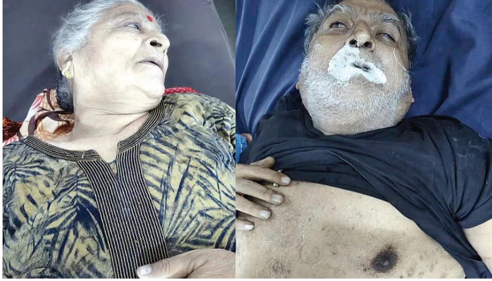
માવતરે જતી રહી હોઈ અને મંગળવારે તેણીએ સાથે ચડભડ થતાં પતિએ પોતે દવા પી જાય છે ફોન પર વાત કરતાં અલગ થવા મામલે પતિ તેવી વાત કરી હતી અને ફોન કટ કરી નાખ્યો