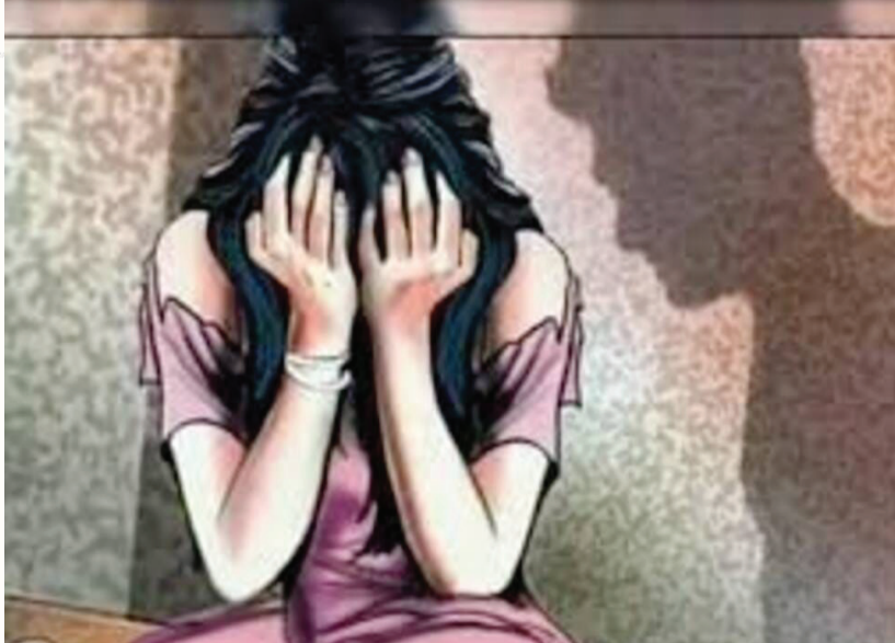
પેથાપુર પંથકના ગામમાં બનવા પામી છે જે ગમે તેની સાથે મિત્રતા અને પ્રેમના નામે આગળ વધી જતી હોય છે. આ ઘટના તેની પ્રતિતી કરાવે છે કે લવના નામે હાલી નીકળતાં લઈંગાઓથી દૂર રહેવું. આ ઘટના અંગે પોલીસ સુત્રોએ જાહેર કરેલી

આ ચોંકાવનારી ઘટનાની વિગતો જોઈએ તો ગાંધીનગર શહેર નજીક આવેલા પેથાપુર પંથકના ગામમાં રહેતી યુવતીને પરિણીત પ્રેમીએ પ્રેમ જાળમાં ફસાવી લગ્નની લાલચ આપીને કુંવારી માતા બનાવી તરછોડી દેતા આખરે યુવાન સામે બળાત્કારનો ગુનો પેથાપુર પોલીસ મથકમાં દાખલ થવા પામ્યો છે. જેના આધારે પોલીસે તપાસ હાથ ધરી હતી. છેલ્લા ઘણા સમયથી સમાજમાં પરિણીત યુવાનો દ્વારા યુવતીઓને પ્રેમ જાળમાં ફસાવીને તેમને પોતાની હવસનો શિકાર બનાવવામાં આવતો હોય છે ત્યારે વધુ એક આ પ્રકારની એક ઘટના ગાંધીનગર નજીક આવેલા