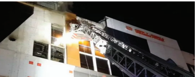
કોની જવાબદારી થશે ફિક્સ? : ઈજાગ્રસ્તોને સારવાર અર્થે ખસેડાયા