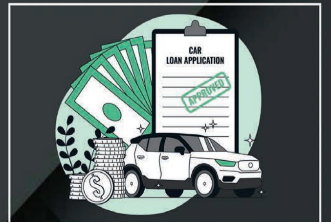
Loan & Insurance