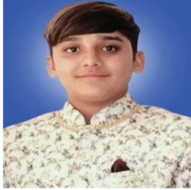
પોલીસ પકડાઈ દુર રહેવા ભૂગર્ભમાં ઉતરી ગયા છે.