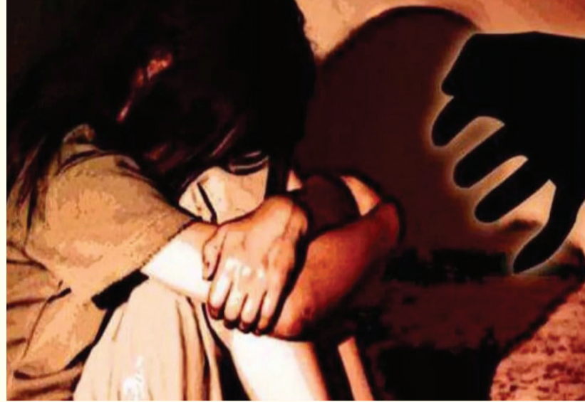
આચરતા આ મામલે યુવક સામે ફોજદારી ફરિયાદ નોંધી વધુ તપાસ ચલાવી રહ્યાં છે. સગીરા પર દૂષ્કર્મની આ ઘટના અમરેલી શહેરના હનુમાનપરા રોડ પર પાટક સ્કુલની સામે આવેલ ઘરતીપાર્ક સોસાયટીમાં બની હતી. આ અંગેની પોલીસમાંથી મળેલી વિગત મુજબ મુળ ઢસા નજીક આવેલા