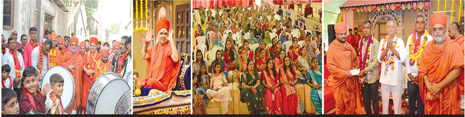
શ્રોતાઓને આપ્યા આશીર્વચન : બોધરા પરિવાર દ્વારા સંતોનું કરાચું સામૈયું