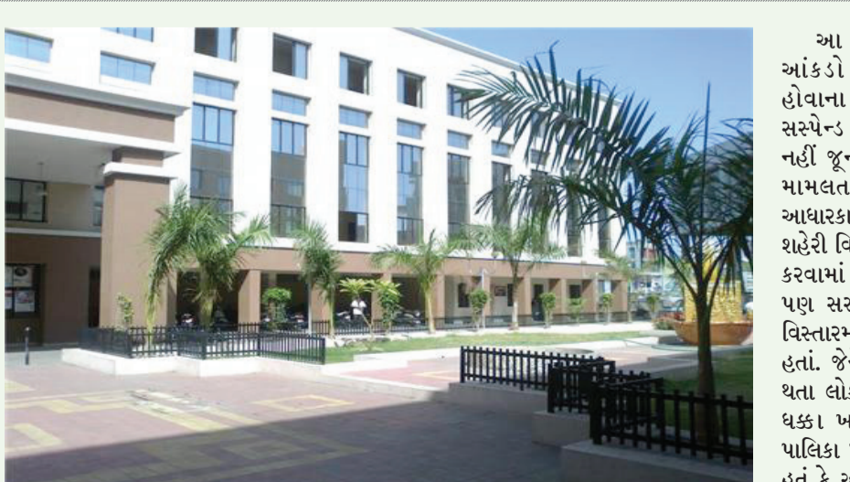
કામગીરી થઈ રહી છે. વધુ વિગતો જોઈએ તો બે મહિના પહેલા નાના બાળકો અને તેના પિતાની કરવામાં આવેલ એન્ટ્રીઓમાં અનેક અરજી મીસમેચ થઈ હતી.

આધાર કેન્દ્ર બહાર સતત લાંબી કતારો જામે છે અને લોકોને કલાકો સુધી ઉભા રહેવું પડે છે. અનેકની હાલત અહિ બરાબ થઈ જાય છે. વિગતો પર નજર કરીએ તો દિવાળીના તહેવાર પહેલા જ મ્યુનિસિપલ કોર્પોરેશનના આધારકાર્ડ સેન્ટરના તમામ એટલે કે અઢાર ઓપરેટરોને એક સાથે એક વર્ષ માટે સસ્પેન્ડ કરી દેવામાં આવ્યા હતા. અંદાજે બે મહિના પહેલાની એન્ટ્રીમાં મીસમેચ થતા મુંબઈની રિઝનલ કચેરી દ્વારા આ કાર્યવાહી કરવામાં આવી હતી. આ કડક પગલા કદાચ જે તે કચેરી દ્વારા યોગ્ય રીતે લેવાયા હશે, પણ આ પગલાને કારણે મ્યુ. કોર્પોરેશનની ઈસ્ટ અને વેસ્ટ એમ બંને ઝોનની કચેરીઓમાં આધારકાર્ડની કામગીરી જડબેસલાક થઈ ગઈ છે. એક માત્ર સેન્ટ્રલ ઝોન કચેરીમાં આધાર કાર્ડની કામગીરી ચાલી રહી છે. જો કે અહિ પણ માત્ર ચાર જ ઓપરેટર દ્વારા આ