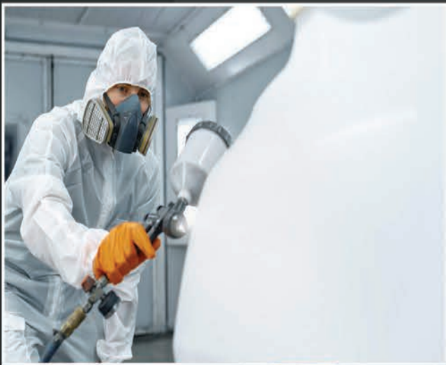
Full Body Paint &amp; Modification