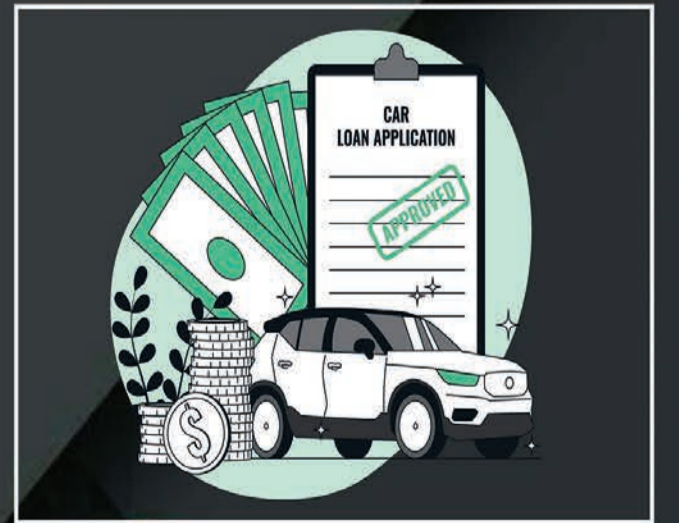
Loan &amp; Insurance

nr. munjka chowk, opp. satadhar petrol pump, new ring road-2, Rajkot.