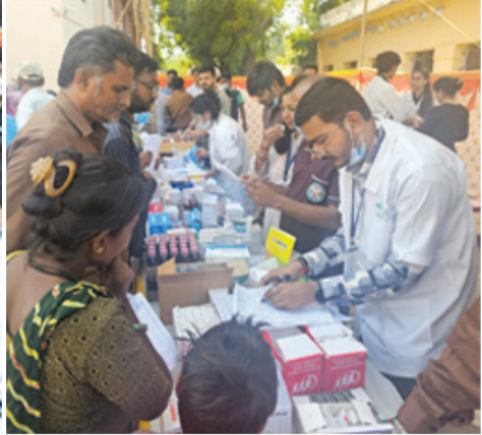
દર્દીઓને કેમ્પમાં લેબોરેટરી તેમજ એક્સ-રેની સુવિધાઓ મળી

રાજકોટ, તા. ૧૦ એઈમ્સ રાજકોટ દ્વારા વાંકાનેર માં યોજાયો નિ:શુલ્ક સર્વરોગ નિદાન મેગા હેલ્થ ચેકઅપ કેમ્પ. વાંકાનેર સાંસદ કેશરીદેવસિંહજી ઝાલાના પ્રયાસો અને એઈમ્સ રાજકોટના સહયોગ થી હેલ્થ ચેકઅપ કેમ્પનું આયોજન કરવામાં આવ્યું હતું. એઈમ્સ હોસ્પિટલ રાજકોટ દ્વારા સૌ પ્રથમ વખત મોરબી જિલ્લાના વાંકાનેર તાલુકામાં નિ:શુલ્ક હેલ્થ ચેકઅપ મેડિકલ કેમ્પનું આયોજન કરવામાં આવ્યું