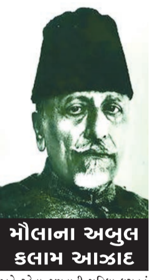
મૌલાના અબુલ કલામ આઝાદ

રાજકોટ મિસ્ત્ર, તા. ૧૦ ભારતના પ્રથમ શિક્ષણ પ્રધાન મૌલાના અબુલ કલામ આઝાદની જન્મજયંતિ નિમિત્તે તા. ૧૧ નવેમ્બરે 'રાષ્ટ્રીય શિક્ષણ દિવસ' ઉજવાય છે. રાષ્ટ્રપિતા મહાત્મા ગાંધીજી કહેતા "તમે એક બાળકને શિક્ષિત કરશો તો સમાજને એક શિક્ષિત નાગરિક મળશે, જ્યારે તમે એક કન્યાને શિક્ષિત કરશો તો સમાજને એક શિક્ષિત પરિવાર મળશે." ત્યારે ગુજરાત સરકારે ગાંધીજીના કન્યા કેળવણીના આ વિચારને આત્મસાત કર્યો છે. કેન્દ્ર સરકાર અને રાજ્ય સરકારે મહિલાઓના શિક્ષણ માટે અનેક કલ્યાણકારી યોજના અમલી બનાવી છે. જે પૈકી સમગ્ર શિક્ષા અભિયાન અંતર્ગત કાર્યરત 'કસ્તુરબા ગાંધી બાલિકા વિદ્યાલય શાળા' અભ્યાસથી વંચિત કન્યાઓ માટે આર્થિકવાદરૂપ યોજના છે. ત્યારે વાત કરીએ 'રાષ્ટ્રીય શિક્ષણ દિવસ'ના અવસરે કસ્તુરબા ગાંધી બાલિકા વિદ્યાલય, વિરનગરની રાજકોટ જિલ્લાના જસદણ તાલુકાના વિરનગર ગામમાં આવેલી કસ્તુરબા ગાંધી બાલિકા વિદ્યાલય (કે. જી. બી. વી.) નો આરંભ વર્ષ ૨૦૧૬-'૧૭માં થયો હતો. જેમાં હાલ જસદણ અને વિઠોળી તાલુકાના કુલ ૨૫ ગામોમાંથી ૧૫૦ કન્યાઓ અભ્યાસ સાથે આશ્રય મેળવી રહી છે. બે વિશાળ બિલ્ડિંગ, મોટું મેદાન