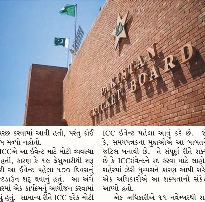
પૂછપરછ કરવામાં આવી હતી, પરંતુ કોઈ જવાબ મળ્યો નહોતો. ICCએ આ ઈવેન્ટ માટે મોટી વ્યવસ્થા કરી હતી, કારણ કે ૧૯ ડેબ્રુઆરીથી શરૂ થનારી આ ઈવેન્ટ પહેલા ૧૦૦ દિવસનું કાઉન્ટડાઉન શરૂ થવાનું હતું. આ અંગે લાહોરમાં એક કાર્યક્રમનું આયોજન કરવામાં આવ્યું હતું. સામાન્ય રીતે ICC દરેક મોટી

રાજકોટ, તા. ૧૦ ઈન્ટરનેશનલ ક્રિકેટ કાઉન્સિલ એટલે કે ICC એ ચેમ્પિયન્સ ટ્રોફી ૨૦૨૫ થી સંબંધિત તેની એક ઈવેન્ટ રદ કરવી પડી હતી, જે પાકિસ્તાનમાં યોજાવાની હતી. એક રીતે ટીમ ઈન્ડિયાએ આ ઈવેન્ટમાં અડચણ ઉભી કરી છે, કારણ કે ઘણા અહેવાલોમાં એવું સામે આવી રહ્યું છે કે ભારતીય ટીમ ચેમ્પિયન્સ ટ્રોફી માટે પાકિસ્તાન નહીં જાય. આવી સ્થિતિમાં ટીમ ઈન્ડિયાની મેચ ક્યાં યોજાશે તે એક મોટો મુદ્દો છે. ICC ૧૧ નવેમ્બરના રોજ લાહોરમાં ટૂર્નામેન્ટ શેડ્યુલ સંબંધિત ઈવેન્ટનું આયોજન કરવાની હતી, પરંતુ હવે તે રદ કરવામાં આવી છે. ક્રિકેટના અહેવાલ મુજબ, આઈ ટીમોની ૫૦-ઓવરની સ્પર્ધા માટે ભારતે પાકિસ્તાન જવાનો ઈનકાર કર્યા પછીના વિકાસથી વાકેફ એક અધિકારીએ કહ્યું, "શેડ્યુલની પુષ્ટિ થઈ નથી, અમે હજી પણ ચેમ્પિયન્સ ટ્રોફીના શેડ્યુલ પર છીએ. યજમાન દેશ. ICCને ઈવેન્ટ કેન્સલ કરવા અંગે વારંવાર