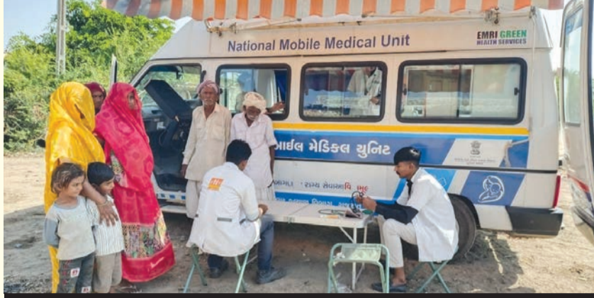
રાજ્યમાં ૧૨૮ મોબાઈલ હેલ્થ યુનિટ : કચ્છ જિલ્લામાં સર્વાધિક ૧૪ યુનિટ કાર્યરત

પાયાની સુવિધાઓ મળી રહે તેવા ઉદ્દેશ્ય આશયથી હાલ ગુજરાતમાં ૧૨૮ મોબાઈલ હેલ્થ યુનિટો કાર્યરત છે. જેમાં ૪૫ મોબાઈલ હેલ્થ યુનિટ (ખર્જ), ૩૦ મોબાઈલ મેડિકલ યુનિટ (ખખજ) તેમજ ૫૩ મોબાઈલ હેલ્થ યુનિટ (એસવી એમએચ) અડીખમ છે. જેમાં સોથી વધુ કચ્છ જિલ્લામાં ૧૪, વલસાડમાં ૧૧ અને બનાસકાંઠામાં ૦૯ મોબાઈલ હેલ્થ યુનિટ કાર્યરત છે. છઠ્ઠા એક વર્ષમાં મોબાઈલ હેલ્થ યુનિટ દ્વારા ૩૮,૦૯૯ રૂટ કરી ૨૩.૬૦ લાખથી વધુ નાગરિકોને ઓન રૂટ ઓ.પી.ડી. સેવાઓ આપી છે. જેમાં મોબાઈલ હેલ્થ યુનિટ દ્વારા ૧૫,૯૮૩ રૂટ ઉપર ૧,૨૪,૪૫૪૦ દર્દીઓની સેવા આપી, મોબાઈલ હેલ્થ યુનિટ ૧૩,૦૯૭ રૂટ કરી ૩,૯૦,૭૧૨ તેમજ મોબાઈલ મેડિકલ યુનિટ દ્વારા ૯૦૧૯ રૂટ કરી ૭,૨૫,૦૨૫ નાગરિકોને સારવાર આપવામાં આવી છે. મોબાઈલ હેલ્થ યુનિટ એમએચ, એમએચ અને એસવી એમએચ યુનિટ દ્વારા નાના બાળકોની સારવાર, રોગ અટકાવત માટે જરૂરી માર્ગદર્શન, આગણવાડી- શાળાના બાળકોની તપાસ અને સારવાર અંગત સ્વચ્છતા, તરૂણ સ્વાસ્થ્ય સેવાઓ