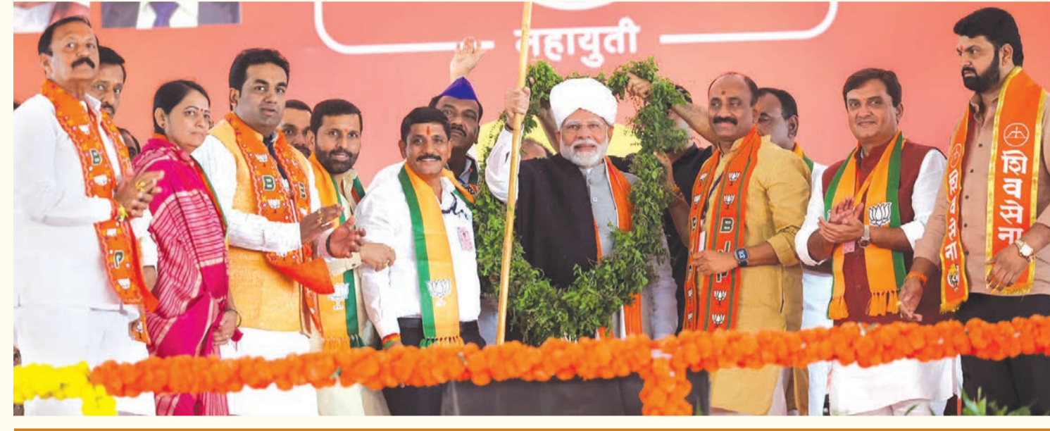
સૌથી વધુ વિદેશી રોકાણ ધરાવતું રાજ્ય એટલે મહારાષ્ટ્ર

આ અભિગમના પરિણામે, મહારાષ્ટ્રના ખેડૂતો ઘણા વર્ષોથી પીડાય છે. મોદીએ ઉમેર્યું હતું કે, અમારા પ્રયાસોને કારણે હવે સોલાપુરના ઘણા ગામોમાં પાણીનું સ્તર વધી રહ્યું છે. મોદીએ કહ્યું કે મહારાષ્ટ્રમાં ભાજપની આગેવાનીવાળી ગઠબંધન સરકારે દાયકાઓથી પેનિંગ પ્રોજેક્ટ પૂરા કર્યાં. તમારો પ્રેમ અને આશીર્વાદ મારી ઉર્જાનો કાયમી સ્રોત છે, તેણે કહ્યું. મહારાષ્ટ્રને ગઠબંધન સરકારની જરૂર છે અને માત્ર એક સ્થિર સરકાર જ રાજ્ય માટે લાંબા ગાળાની નીતિઓ બનાવી શકશે. મહિલાઓ માટે મુખ્યમંત્રી મારી લડકી બહુન યોજના દરેકના હોદ્દા પર છે. આને લઈને વિપક્ષની ઊંઘ ઊડી ગઈ છે.