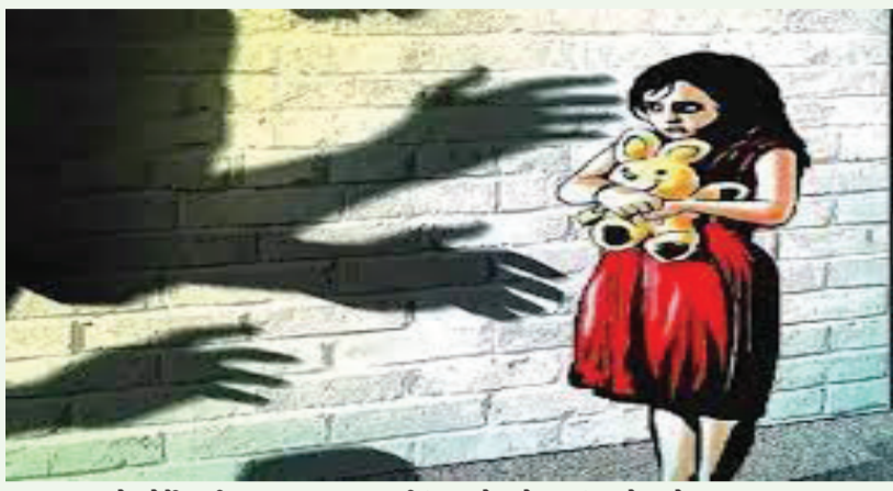
જમ્મુ પઠાણને કોર્ટે વર્ષ 2023માં 20 વર્ષની સજા કરી હતી. તેણે અગાઉ પણ એક માસુમ બાળકી સાથે દુષ્કર્મ આચર્યું હતું. હાલમાં જ તે પેરોલ પર બહાર આવ્યો હતો, પરંતુ સજા થયા બાદ પણ તેની શક્ષસી પ્રવૃત્તિ જેમની તેમ જ હતી. જેલથી બહાર આવ્યા બાદ તે ફરીથી પોતાના બદ ઈરાદાને પૂર્ણ કરવા માટે બાળકીની શોધખોળ કરી રહ્યો હતો.

શોશિલ મીડિયામાં વાઈરલ થયો હતો. પોલીસે જેના આધારે બાળકીનું અપહરણ કરનાર અજાણ્યા શખસની ધરપકડ કરી હતી. મુકબધીર માતાની પાંચ વર્ષની માસુમ બાળકી માતા સાથે સુઈ રહી હતી. ગરીબ હોવાના કારણે ઘરમાં દરવાજો પણ નહોતો. જે જોઈ હોવાને આરોપી બાળકીને બદ ઈરાદે ઉઠાવી જઈને ભાગવાનો પ્રયાસ કરતો હતો. આ સમગ્ર ઘટના સીસીટીવી કેમેરામાં કેદ થવા પામી હતી. બાળકી લઈને નાસી રહ્યો હતો તે દરમિયાન બાળકી રડવા લાગી હતી જેથી લોકો એકત્ર થવા લાગ્યા હતા.