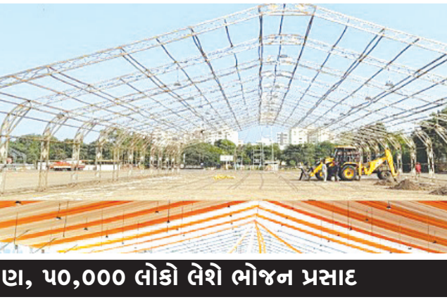
રોજ ૧ લાખ લોકો કરશે કથા શ્રવણ, ૫૦,૦૦૦ લોકો લેશે ભોજન પ્રસાદ