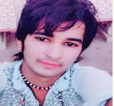
આથી તે અંગેની નોંધ તબિબે સિવિલ હોસ્પિટલની પોલીસ ચોકીમાં નોંધ કરાવતાં જે તે વખતે થોરાળા પોલીસે પણ નોંધ કરી તપાસ કરી હતી. પણ મારકુટ થયાની કોઈ વિગતો સાંપડી નહોતી.