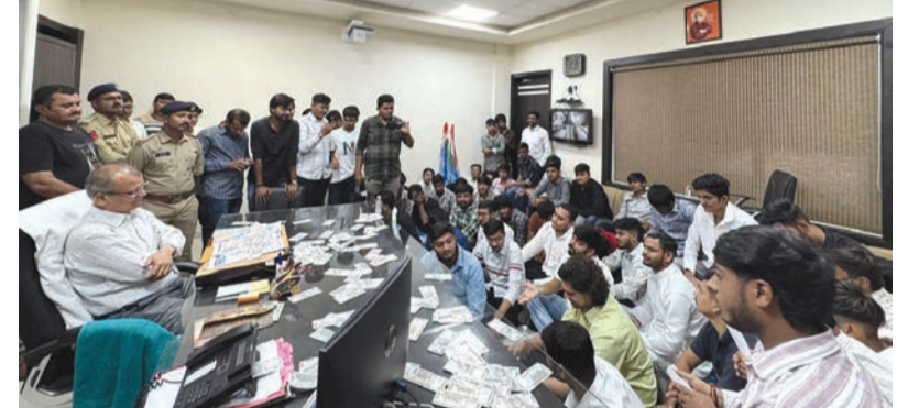
આવ્યો કોમન એક્ટ મતલબ એક સમાન ત્યારે ગુજરાત યુનિવર્સિટીમાં પીએચડીમાં એન્ડ્રસ ટેસ્ટ લેવાની હોય છતાં એની ફી