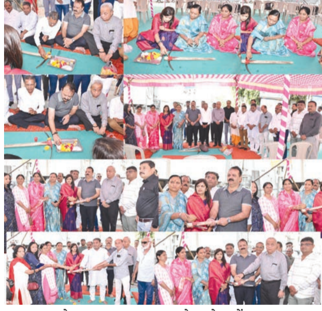
રાજકોટ તા. ૧૩ ખાતે આવેલ વોંકળા પર રૂ. ૪.૯૧ કરોડના ખર્ચે સ્લેબ બનાવવાના કરોડના ખર્ચે સ્લેબ બનાવવાના કામનું ખાતમુહૂર્ત વિધાનસભા-૬૯ના

મહાનગરપાલિકાના પદાધિકારીઓ, અધિકારીઓ અને વેપારી વર્ગ રહ્યો હાજર