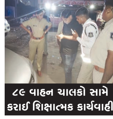
૮૯ વાહન ચાલકો સામે કડાઈ શિક્ષાત્મક કાર્યવાહી

રાજકોટ મિસ્ત્ર, તા.૧૩ રાજકોટ આરટીઓ કચેરી અને પોલીસ વિભાગ દ્વારા ગોંડલ રોડ, શાપર રોડ, કાલાવાડ રોડ ઉપર અને માલિયાસણ રોડ ઉપર અલગ અલગ દિવસોએ ડ્રાઈવરનું આયોજન કરવામાં આવેલ હતું જેમાં બંને વિભાગો સંકલનમા રહીને મોટર વાહન કાયદાનો ઉલ્લંઘન કરતા અને કબીલે લાઈટ લગાવીને ફરતા ૮૯ વાહનો ઉપર કુલ રૂ.૨૦,૫૦૦/-ના દંડ ની કાર્યવાહી કરવામાં આવેલ હતી. વાહન ચાલકો દ્વારા આરટીઓના નિયમ વિરુદ્ધ સાઉન્ડ, લાઈટ સહિતની વિવિધ એસેસરીઝ વાહનોમાં લગાવતા હોય છે અને સીનસપાટા કરતા