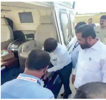
એકનાથ સિંદે અને તેમના નાયબ મુખ્ય પ્રધાને દેવેન્દ્ર ફડણવીસ અને અજિત પવારની બેગ પણ તપાસી છે, તેમના દાવાઓનો જવાબ આપતા, ચૂંટણી અધિકારીઓએ ઘાવો કર્યો કે ૨૦ નવેમ્બરના રોજ કડક SOPs રાજ્યમાં વિધાનસભાની ચૂંટણીઓ પહેલાં "પ્લેઈંગ કિલ્ડ લેવલ" કરવા માટે અનુસરવામાં આવી હતી. આદર્શ આચાર સંહિતા (MCC) અમલમાં હોવાથી, ચૂંટણી

મહારાષ્ટ્રના મુખ્ય પ્રધાન એકનાથ સિંદે બુધવારે જ્યારે વિધાનસભા ચૂંટણીના પ્રચાર માટે પાલઘર પહોંચ્યા ત્યારે ચૂંટણી અધિકારીઓ દ્વારા તેમના હેલિકોપ્ટરની તપાસ કરવામાં આવી હતી. મુખ્યમંત્રી ચૂંટણી અધિકારીઓ સાથે વાતચીત કરતા જોવા મળ્યા હતા જ્યારે તેઓ હેલિકોપ્ટરની તપાસ કરી રહ્યા હતા અને તેમના સામાનની તપાસ કરી રહ્યા હતા. એકનાથ સિંદેના હેલિકોપ્ટરની તપાસ શિવસેના (UBT)ના વડા ઉદ્ધવ ઠાકરેએ આક્ષેપ કર્યા બાદ કરવામાં આવી હતી કે ચૂંટણી અધિકારીઓએ તેમની બેગની તપાસ કરી હતી, એક વખત ચલતમાલમાં અને એક વખત લાતુરમાં, વિપક્ષી નેતા માટે બિનજરૂરી મુશ્કેલી ઊભી કરવાના પ્રયાસમાં.