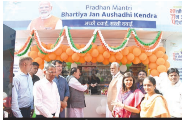
ચાત્રિકોને રેલવે સ્ટેશન પર મળશે ગુણવત્તાલક્ષી દવાઓ

રાજકોટ, તા. ૧૩ વડાપ્રધાન નરેન્દ્ર મોદીના હસ્તે દરભંગા, બિહાર ખાતેથી રાજકોટ રેલવે સ્ટેશન અને ગુજરાત રાજ્યના વાપી, ચાંદલોડીયા સહિત સમગ્ર ભારતમાં ૧૮ સ્થળોએ પ્રધાનમંત્રી ભારતીય જનઔષધિ કેન્દ્રો (ખર્ચઉંડીત)નું વચ્ચુંઅલી લોકાર્પણ કરવામાં આવ્યું હતું. આશરે રૂ. ૧૦.૨૩ લાખના ખર્ચે નિર્માણ કરવામાં આવેલ રાજકોટ ખાતેના જનઔષધી કેન્દ્ર થકી મુસાફરો અને મુલાકાતીઓને જનઔષધી ઉત્પાદનોની ઝડપી પહોંચની સુવિધા મળશે. સસ્તી આરોગ્યસંભાળના સરકારના વિઝન સાથે જોડાયેલા આ જન ઔષધી કેન્દ્ર પર ૫૦ થી