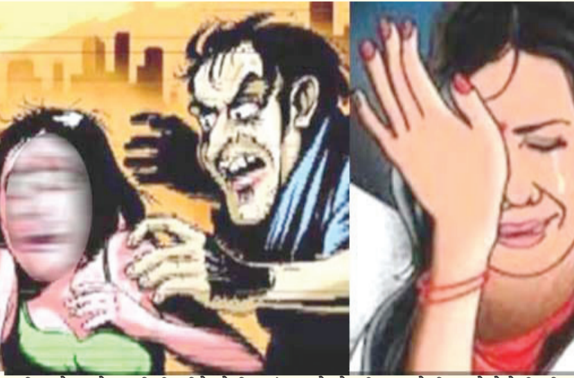
હતી અને સાથે નાની દિકરીને લેતી ગઈ હતી. પાછળ ઘરે ઓગણીસ વર્ષની દિકરી અને બાપ એકલા જ હતાં. દરમિયાના હવસખોર બાપની અંદરનો શૈતાન જાગ્યો હતો અને એક દિવસ વહેલી સવારે તેણે દિકરીના રૂમમાં જઈ તેની પાસે સુઈ જઈ છાતીએ હાથ ફેરવી પાયજામો ઉતારી નાખ્યોહ તો અને આખા શરીરે અડપલા ચાલુ કરી દીધા

અડપલાં કર્યા હતા. માતા-પિતાના વિખવાદને પગલે મામાને ત્યાં ઉછરેલી યુવતી દોઢ વર્ષથી જ તેમની સાથે રહી છે. પિતાએ આ દિકરી પર વહાલ વરસાવવાને બદલે તેના પર હવસખોરીથી કહેર વર્તાવ્યો હતો. વિગતો જોઈએ તો કાપોદ્રા વિસ્તારમાં રહેતા કાપડ વેપારીએ બિમાર પત્નીની ગેરહાજરીમાં છેલ્લા પંદર દિવસમાં ત્રણ વખત ઓગણીસ વર્ષની સગી દીકરીના શરીરે હાથ ફેરવી કપડાં ઉતારવાની કોશિષ કરી અડપલાં કરતા આખરે યુવતીએ વતન સારવાર માટે ગયેલી માતાને જાણ કરી હતી.