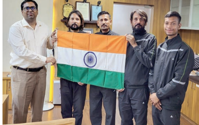
રાજકોટ, તા. ૧૩ વિશ્વ શાંતિ માટે અનેકવિધ યુધ્ધ દ્વારા અનેકવિધ પ્રકારના કાર્યક્રમો અને સુંબેશો ચલાવવામાં આવતી હોય છે મહત્વની વાત એ છે કે હાલ પ્રદુષણ સૌથી મોટો જટિલ પ્રશ્ન બન્યો છે ત્યારે આ મુદ્દે યોગ્ય રજૂઆત અને જાગૃતિ

જિદ્દા કલેક્ટરે કર્યું સ્વાગત અભિવાદન : વિશ્વના ૧૧ દેશોમાં ૪ લાખ કી. મી. થી વધુનો પ્રવાસ કરી શાંતિ, પર્યાવરણ જાળવણીનો સંદેશ પહોંચાડ્યો