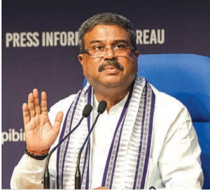
આત્મવિશ્વાસ જગાડવા માટે એક ટીમ તરીકે કામ કરીશું. કથિત લોક સહિતની અનેક અનિયમિતતાઓ પછી, NEETને લીધે, મંત્રાલયે

કેન્દ્રીય શિક્ષણ પ્રધાન ધર્મેન્દ્ર પ્રધાને મંગળવારે જાહેરાત કરી હતી કે કેન્દ્ર જાન્યુઆરીથી દેશમાં પ્રવેશ પરીક્ષાઓમાં વિવિધ સુધારાઓ શરૂ કરી રહ્યું છે અને રાજ્ય સરકારોને ઝીરો-એરર પ્રવેશ પરીક્ષાઓ માટે તેમનો ટેકો વધારવા અપીલ કરી છે. પ્રધાને જણાવ્યું હતું કે રાધાકૃષ્ણન પેનલે નેશનલ ટેસ્ટિંગ એજન્સી (NTA) માં સુધારાની રૂપરેખા આપતા તેનો અહેવાલ સુપરત કર્યો છે, અને ઉમેર્યું હતું કે ભલામણોને લાગુ કરવા માટે રાજ્યોનો સહકાર જરૂરી છે.