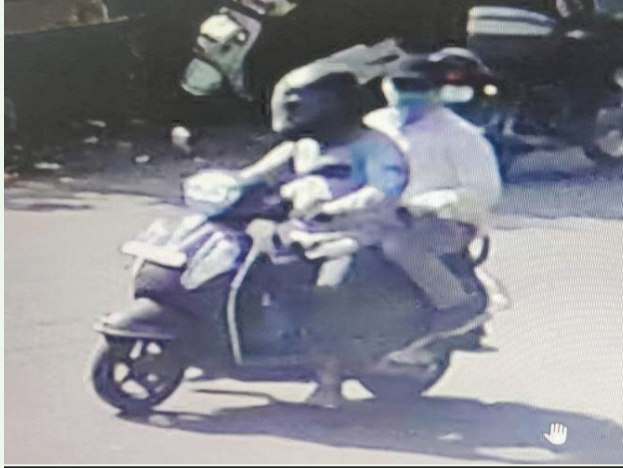
હોટેલ સંચાલકે પેમેન્ટ ચુકવવા સવારે જ બેંકમાંથી રોકડ ઉપાડી હતી: ત્યાંથી જ રેકી કરી ગઈયાઓએ કામ ઉતારી લીધાની શક્યતા