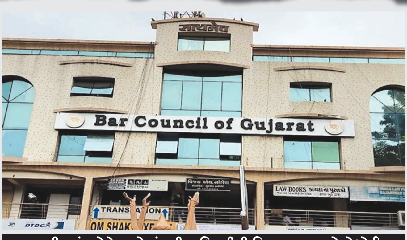
તમામ વકીલ મંડળોને આજે ચૂંટણી અધિકારીની નિમણૂક કરવાનો છેલ્લો દિવસ