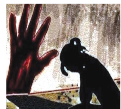
બીજા બનાવમાં સત્તર વર્ષની સગીરાને પ્રેમમાં ફસાવી લાલચ દઈ ઢગાનું દૂષ્કર્મ