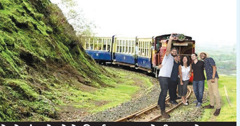
રેલવે તંત્રનો મોટો નિર્ણય, FIR નોંધી ભરણે પગલા

રાજકોટ મિરર, તા.૧૭ નવી દિલ્હી, તા.૧૭ ટ્રેન કે રેલવેના પાટા પર રીલ બનાવનારા હવે સાવધાન થઈ જશે. જો આ જગ્યાઓ પર રીલ બનાવતી વખતે સુરક્ષાનું જોખમ ઉત્પન્ન કર્યું તો ઝડપી દાખલ કરવામાં આવશે. રેલવે બોર્ડે આ સંદર્ભે પોતાના તમામ ઝોનને નિર્દેશ આપી દીધો છે. તેમાં કહેવામાં આવ્યું છે કે, જો રીલ બનાવનારા સુરક્ષિત રેલવે કામગીરી માટે ખતરો ઊભો કરે છે અથવા કોઈ અથવા રેલવે પરિસરમાં યાત્રીઓ માટે અસુવિધાનું કારણ બને છે તો તેમની સામે ઝડપી નોંધવામાં આવશે. રેલવે બોર્ડના આ દિશા-નિર્દેશ તાજેતરમાં કેટલાક એવા કિસ્સાઓ સામે આવ્યા બાદ આવી છે, જેમાં ખાસ કરીને યુવાનોએ પોતાના મોબાઈલ ફોનથી રેલવે ટ્રેક પર અને ચાલતી ટ્રેનોમાં સ્ટેટ કરતાં વીડિયો બનાવવામાં રેલવે સુરક્ષા સાથે યોગ્યતા કર્યાં છે. બોર્ડના એક વરિષ્ઠ અધિકારીએ જણાવ્યું કે, ‘લોકો રીલ બનાવવામાં તમામ હદો વટાવી ચૂક્યા છે. તેઓ ન માત્ર પોતાનો જીવ જોખમમાં મૂકી રહ્યા છે પરંતુ રેલવે ટ્રેક પર વસ્તુઓ મૂકીને અથવા વાહનો ચલાવીને અથવા ચાલતી ટ્રેનોમાં ખતરનાક સ્ટેટ કરીને