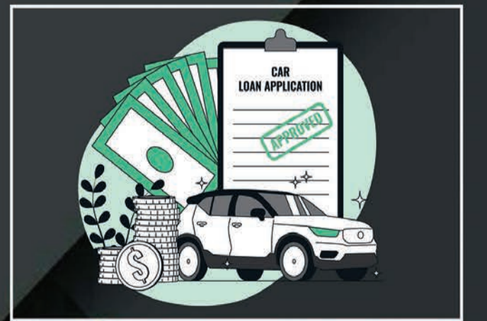
Loan &amp; Insurance