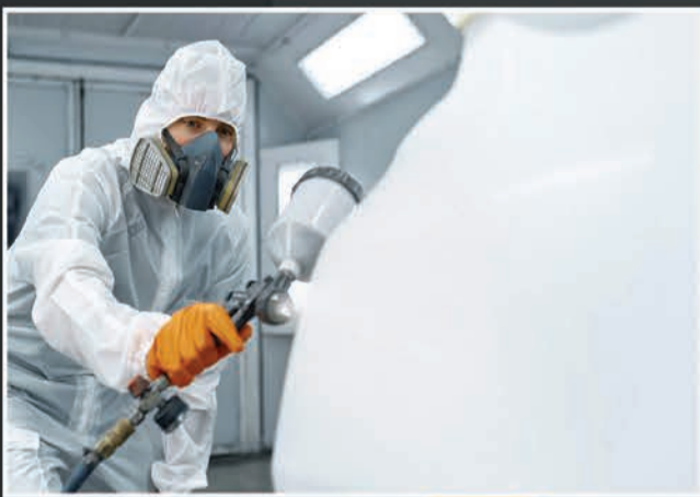
Full Body Paint &amp; Modification