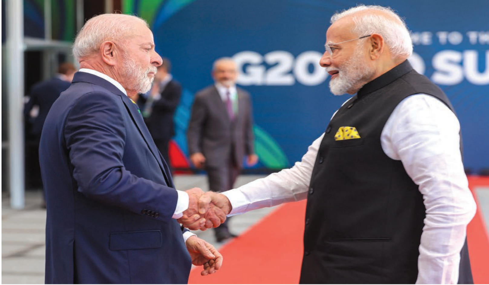
અમેરિકાના જો બિડેન અને ચીનના રાષ્ટ્રપતિ શી જિનપિંગે પણ સમિટમાં લીધો ભાગ

Place of Publication : 201-SAGAR APPARTMENT, C-WING, OPP. SHREEJI HOTEL, NEAR MILESTONE APPARTMENT, ROYAL PARK STREET NO. 10, KALAWAD ROAD, RAJKOT