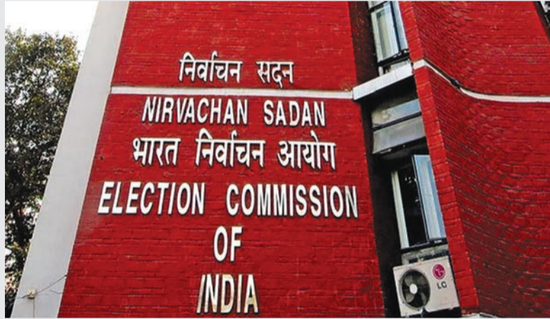
રાજકોટ, તા. ૧૮ લોકસભા ચૂંટણીના લઈ જે રીતે જિલ્લા વહીવટી તંત્ર દ્વારા બર્ચ કરવામાં આવ્યો હતો

બાકી રહેતા ચુકવણા થશે પૂર્ણ : જિલ્લા કલેક્ટર દ્વારા અનેક વખત ચૂંટણી પંચને કરાઈતી રજૂઆત