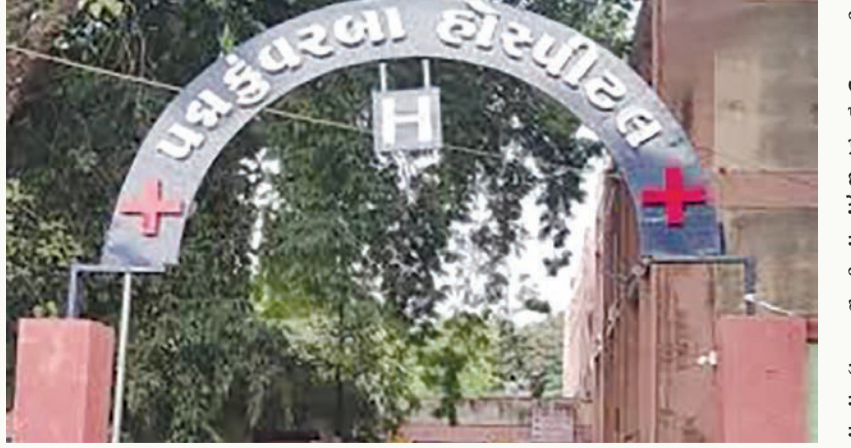
રાજકોટ મિરર, તા.૧૮ શહેરના ગુંદાવાડી વિસ્તારની પદ્મકુંવરબા હોસ્પિટલમાં પરપ્રાંતીય મહિલાને પ્રસુતિની સારવારમાં ભયંકર બેદરકારી દાખવનાર બે તબીબોને સસ્પેન્શનના ફરફરિયાં પકડાવી ઉચ્ચ આરોગ્ય તંત્રએ ધાક બેસાડી શિક્ષાત્મક કાર્યવાહી કરી છે. એટલુજ નહિ પ્રસુતાને હોસ્પિટલના પ્રાંગણમાં બાંકડે જ થઈ ગયેલી પ્રસુતિના બનાવમાં યેનકેન પ્રકારે કસુરવાર ત્રણ પરીચારીકોને અહીંથી બદલી કરી અન્ય શહેરમાં મોકલી દેવાઈ છે તો બેકસુર આયા બહેનને નોકરીથી હાથ ધોવા પડ્યા હોવાનું

બેકસુર આયા બહેનને નોકરી પરથી જ ઉતારી ઘરે બેસાડી દેવાયા : ત્રણ નર્સોની બદલી, ઉચ્ચ આરોગ્ય તંત્રની પોણા બે મહિના પછી કાર્યવાહી