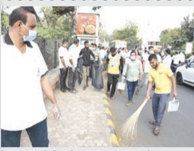
રાજકોટ, તા. ૧૮ રાજકોટ જિલ્લા પંચાયત ચોક ખાતેની કમ્પ્યુલર એન્ડ ઓડિટર જનરલના ભારતીય ઓડિટ અને એકાઉન્ટસ ડિપાર્ટમેન્ટની એકાઉન્ટન્ટ જનરલશ્રીની કચેરી દ્વારા સામાન્ય લોકો ઓડિટ કામગીરી અંગે જાગૃત બને તે માટે તા.૧૮થી ૨૨ નવેમ્બર દરમિયાન 'ઓડિટ સમાહ'ની ઉજવણી કરવામાં આવી રહી છે. જે અન્વયે સમાહના પ્રથમ દિવસે કચેરીના આશરે ૪૦૦ થી વધુ કર્મચોગીઓએ જિલ્લા પંચાયત ચોકની કિશાનપરા ચોક સુધીના વિસ્તારને સ્વચ્છ અને સુઘડ બનાવ્યો હતો.

ઓડિટ વોક, રંગોળી, ચિત્ર, નિબંધ સહીતની સ્પર્ધાઓ, વર્કશોપ વગેરેનું આયોજન