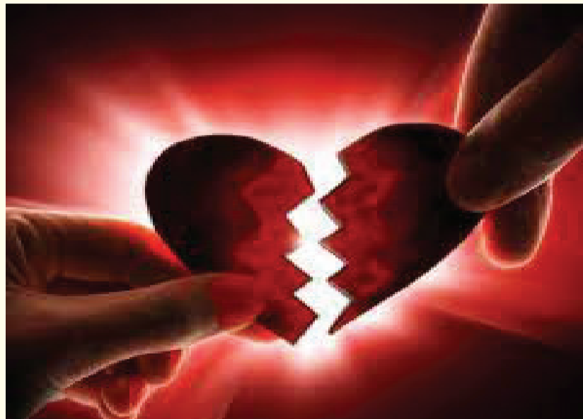
બીજા કિસ્સામાં ૧૪ વર્ષની બાળને ઈન્સ્ટાગ્રામથી પ્રેમજાળમાં ફસાવી વારંવાર દૂષ્કર્મ આચરી ગર્ભ રાખી દીધો: ઢગા વિરૂધ્ધ પોક્સો હેઠળ કાર્યવાહી

જો કે યુવતિને પોતે ખોટું પગલુ ભરી લીધું છે તેનો અહેસાસ લગ્નના એક મહિનામાં જ થઈ ગયો હતો. લગ્ન બાદ થોડા જ દિવસોમાં યુવતીને પતિનો વરવો અનુભવ થયો હતો. જેને પોતે પ્રેમીમાંથી પતિ પરમેશ્વર બનાવીને તેની સાથે ભાગી નીકળી હતી તે શપ્થ પતિ મટીને દાખલ જેવું વર્તન કરતો થઈ ગયો હતો. તે આ યુવતીની મરજી વિરૂધ્ધ બળાત્કાર ગુજારતા યુવકે