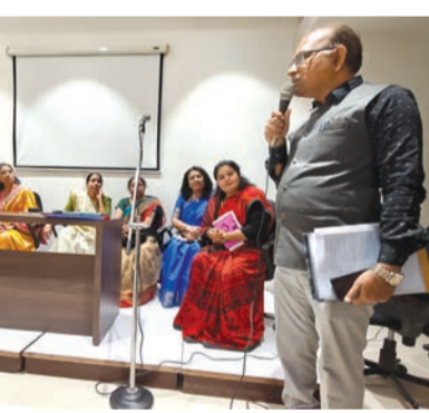
“એક પીંછુ મોર થઈ ટહૂકી શકે, શક્યતાનાં દ્વારને ઉબંર નથી.” આ ઉપરાંત વિવિધ પ્રકારની કવિતાઓ રજૂ કરવામાં આવી.