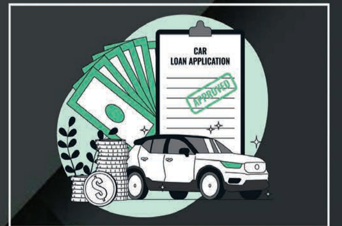
Loan & Insurance

nr. munjka chowk, opp. satadhar petrol pump, new ring road-2, Rajkot.