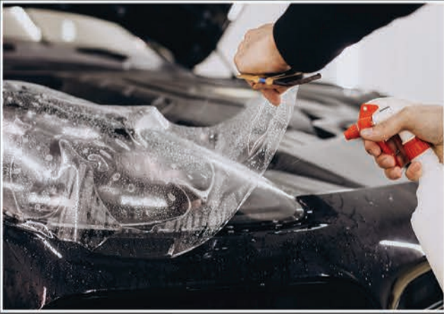
Paint Protection Film