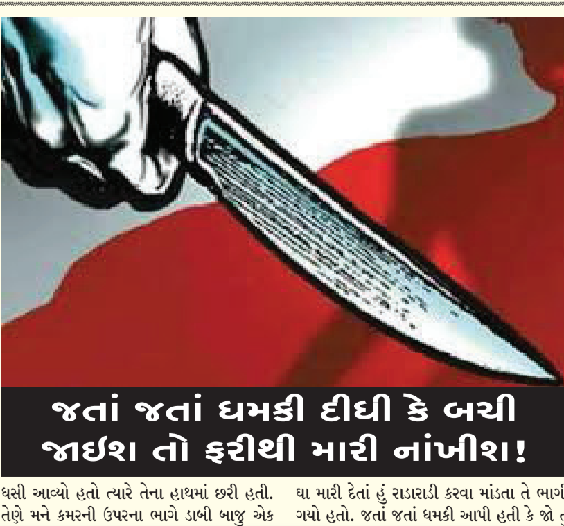
જતાં જતાં ધમકી દીધી કે બચી જાઈશ તો ફરીથી મારી નાખીશ!

દર્શનસિંહ જાડેજા દ્વારા રાજકોટ મિરર તા.૨૦ શહેરમાં અલગ અલગ કે નાના મોટા કારણોસર મારામારીની ઘટનાઓ રોજબરોજ બનતી રહે છે. સરાજાહેર લોકો એકબીજા પર તૂટી પડે તેના વિડીયો પણ વાયરલ થતા રહે છે. પરંતુ જ્યારે આવી ઘટનાઓ શિક્ષણના ધામમાં બને ત્યારે ચક્રવાત મચી જતી હોય છે. જ્યાં વાલીઓ મા-બાપ પોતાના સંતાનોને ભણાતર માટે મોકલે છે ત્યાં કલમ કે જે તે વિષયના અભ્યાસને લગતાં સાધનોને બદલે જો છાત્રો શસ્ત્ર એટલે કે છરી ચાકા લઈને આવી જાય તો હાલત શું થાય? આ ઘટનાની પ્રતિતી કરાવતો બળભળાટ મચાવતો ડિસ્કો આજીડેમ પાસે આવેલી સરકારી પોલિટેકનિક કોલેજમાં બન્યો છે. અહિં એક વિદ્યાર્થીને બીજા વિદ્યાર્થીએ મશ્કરી બાબતે છરી ભોંકી દેતાં તે લોહીલુહાણ થઈ ગયો હતો. ખૂનસથી હુમલો કરનારા છાત્રએ એવી ધમકી પણ દીધી હતી કે જો તું બચી જાઈશ તો પણ હું તને ફરીથી હુમલો કરી જાનથી મારી નાખીશ! ચોકાવનારી એવી આ ઘટનાની વિગતો પર નજર કરીએ તો આજીડેમ નજીક જ આવેલી સરકારી પોલિટેકનિક કોલેજમાં એક વિદ્યાર્થીને