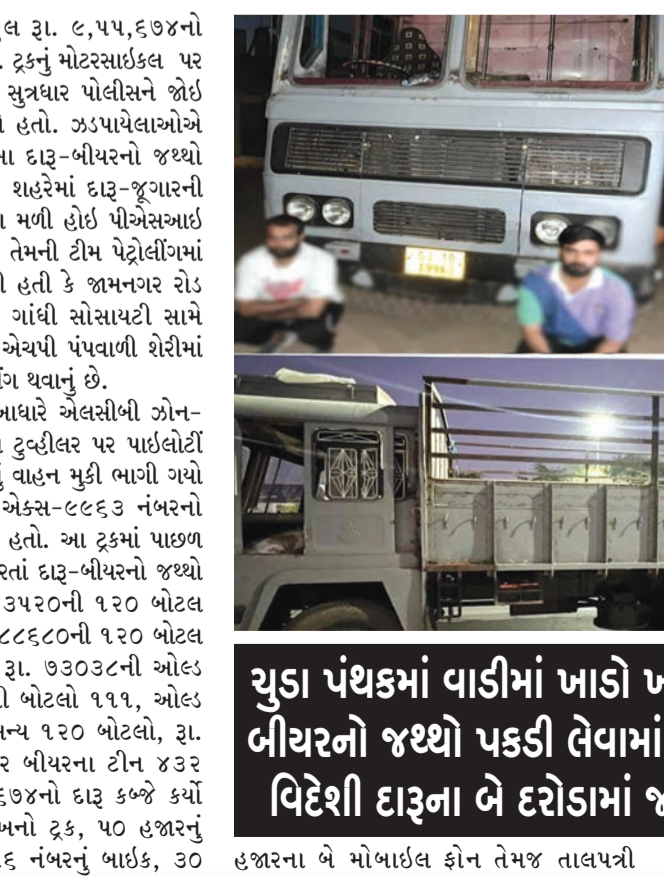
ચુડા પંથકમાં વાડીમાં ખાડો ખોદી છુપાવી રખાયેલો દારૂ-બીયરનો જથ્થો પકડી લેવામાં સફળતા : પીસીબીએ પણ વિદેશી દારૂના દરોડામાં જથ્થાઓ સાથે ઝને પકડ્યા

લીધા હતા. પોલીસે કુલ રૂા. ૯,૫૫,૬૭૪નો મુદામાલ કબ્જે કર્યો હતો. ટ્રકનું મોટરસાઈકલ પર પાઈલોટીંગ કરી રહેલો સુત્રધાર પોલીસને જોઈ વાહન મુકી ભાગી ગયો હતો. ઝડપાયેલાઓએ કહ્યું હતું કે સુત્રધારે આ દારૂ-બીયરનો જથ્થો દમણથી મંગાવ્યો હતો. શહેરમાં દારૂ-જૂગારની પ્રવૃત્તિ અટકાવવા સુચના મળી હોઈ પીએસઆઈ આર. એચ. ઝાલા અને તેમની ટીમ પેટ્રોલીંગમાં હતી ત્યારે બાતમી મળી હતી કે જામનગર રોડ માધાપર ચોકડી નજીક ગાંધી સોસાયટી સામે જાઈડીસી સ્થિતિમાં એચપી પંપવાળી શેરીમાં દારૂ ભરેલા ટ્રકમાંથી ફટીંગ થવાનું છે. પાકી બાતમીને આધારે એલસીબી ઝોન-૨ની ટીમ ત્યાં પહોંચતા ટુષ્ટીલર પર પાઈલોટીંગ કરી રહેલો શપ્ત તેનું વાહન મુકી ભાગી ગયો હતો. જ્યારે જીજી ૧૦એક્સ-૯૯૬૩ નંબરનો ટ્રક પોલીસે પકડી લીધો હતો. આ ટ્રકમાં પાછળ તાલપત્રી નીચે તપાસ કરતાં દારૂ-બીયરનો જથ્થો મળ્યો હતો. પોલીસે ૮૩૫૨૦ની ૧૨૦ બોટલ રોયલ ચેલેન્જ વ્હીસ્કી, ૮૮૬૮૦ની ૧૨૦ બોટલ ઓલ સીઝન વ્હીસ્કી, રૂા. ૭૩૦૩૮ની ઓલ મોન્ક રમની પ્યાસ્ટીકની બોટલો ૧૧૧, ઓલ મોન્કની ૭૯૯૬૦ની અન્ય ૧૨૦ બોટલો, રૂા. ૫૦૯૭૬ના બડવાઈઝર બીયરના ટીન ૪૩૨ મળી કુલ રૂા. ૩,૭૫,૬૭૪નો દારૂ કબ્જે કર્યો હતો. તેમજ પાંચ લાખનો ટ્રક, ૫૦ હજારનું જીજી૦૩એલએક્સ-૦૪૫૬ નંબરનું બાઈક, ૩૦