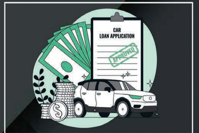
Loan & Insurance

nr. munjka chowk, opp. satadhar petrol pump, new ring road-2, Rajkot.