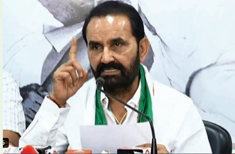
૨૮ ઓક્ટોબર, ૨૦૨૪ના રોજ જાહેર થયેલા પરિપત્રની નકલ પ્રદેશ કોંગ્રેસ સમિતિ ખાતે યોજાયેલી પ્રેસ કોન્ફરન્સમાં પૂરી પાડવામાં આવી હતી. સરકારના આ દરાવ મુજબ થયેલા નિર્ણયથી

મુજબ કેન્દ્ર સરકાર ૭૫% અને ૨૫% રાજ્ય સરકારે ભોગવવાના અને યોજનામાંથી આદિવાસી સમાજના એટલે કે અનુસૂચિત જનજાતિના વિદ્યાર્થીઓ માટે મેટ્રિક પછી અભ્યાસમાં શિષ્યવૃત્તિની યોજના જાહેર કરવામાં આવી હતી. આ યોજનાની એક મોટી બાબત એ હતી કે મેનેજમેન્ટ કોટામાં એટલે કે પેઈડ સીટ ઉપર પણ આદિવાસી સમાજનો બાળક પ્રવેશ મેળવે તો તે શિષ્યવૃત્તિને હકદાર બને. આ યોજનાના કારણે ગુજરાત અને દેશના લાખો બાળકોને મેટ્રિક પછીના અભ્યાસમાં ખૂબ મોટી સહાય શિષ્યવૃત્તિ દ્વારા પ્રાપ્ત થઈ રહી હતી. ભારતીય જનતા પાર્ટીની કેન્દ્રમાં અને ગુજરાતમાં રહેલી સરકારે આદિવાસી સમાજના બાળકોને મળતી આ શિષ્યવૃત્તિને બંધ કરીને આદિવાસી બાળકોને ખૂબ મોટો અન્યાય કરેલો છે. ગુજરાત સરકારે તાજેતરમાં એક પરિપત્ર બહાર પાડીને હવે પછી કોઈપણ આદિવાસી બાળક (અનુસૂચિત જનજાતિનો વિદ્યાર્થી) મેટ્રિક પછી મેનેજમેન્ટ કોટામાં એટલે કે પેઈડ સીટ ઉપર પ્રવેશ મેળવે તો તેને શિષ્યવૃત્તિ નહીં આપવાનો નિર્ણય કર્યો છે. પ્રેસ અને મીડિયા સમક્ષ ગુજરાત સરકારના