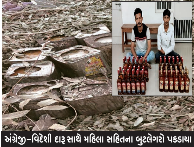
અંગ્રેજી-વિદેશી દારૂ સાથે મહિલા સહિતના બુટલેગરો પકડાયા