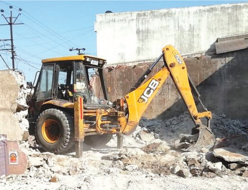
આ અંગેની કોઈ જાણ નથી અને જો જાણ છે તો તેમના દ્વારા કોઈ નક્કર પગલા લેવામાં આવ્યા નથી