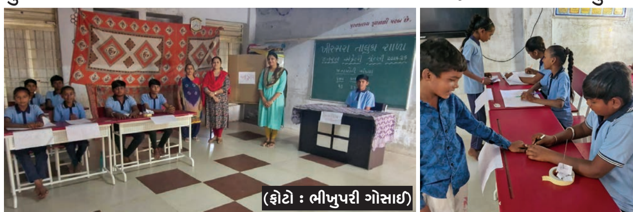
રાજકોટ મિરર, ખીરસરા તા. ૨૦ સામાજિક વિજ્ઞાનનો એક મુદ્દો હોવાની સાથે અત્યારથી જ બાળકો સ્વતંત્ર અને નિષ્પક્ષ ચૂંટણી પ્રક્રિયા કઈ રીતે થાય તેની સમજ કેળવે તેમજ મતદાન નું મહત્વ સમજે તેવા હેતુથી શાળા માં મતદાન બુથ ઉભું કરવામાં આવેલ જેમાં પ્રિસાર્થીય ઓફિસર મતદાન કુટીર તેમજ મતદાન પહેલા ની તમામ પ્રક્રિયાની વ્યવસ્થા પ્રવૃત્તિ હાથ ધરવામાં આવી હતી. આ ચૂંટણી દ્વારા શાળાના ધોરણ ૫ થી ૮ના વિદ્યાર્થીઓ દ્વારા મતદાન કરવામાં આવેલ તેમજ જીએસ પસંદગી કરવામાં આવી હતી. વિદ્યાર્થીઓના આવા આયોજનથી છાત્રો અને ગુરુજીઓમાં રાજીયો જોવા મળ્યો હતો.

ચૂંટણી પ્રક્રિયાથી માહિતીગાર થવા ધોરણ ૫ થી ૮ ના વિદ્યાર્થીઓ દ્વારા ક્ષાઈ GDSની ચૂંટણી