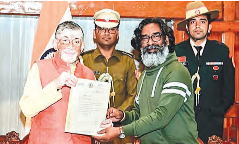
તરીકે શપથ લીધા નથી. મુખ્યમંત્રી બનવાનો રેકોર્ડ છે. પૂર્વ સીએમ શિબુ સોરેન અને ભાજપના નેતા પૂર્વ સીએમ ઝારખંડમાં અત્યાર સુધી ત્રણ વખત

નવીદિલ્હી, તા. ૨૪ ઝારખંડ મુક્તિ મોરચાની આગેવાની હેઠળના ઈન્ડિયા એલાયન્સે ઝારખંડમાં જંગી જીત સાથે સત્તા જાળવી રાખી છે. ઝારખંડ આંદોલનના નેતા પૂર્વ સીએમ શિબુ સોરેનના પુત્ર હેમંત સોરેન આ જીત સાથે ઈતિહાસ રચવા જઈ રહ્યા છે. સતત બીજી વખત મુખ્યમંત્રી પદના શપથ લઈને હેમંત સોરેન પોતાના નામે ઘણા રેકોર્ડ બનાવશે. તે તેના પિતા પૂર્વ સીએમ શિબુ સોરેનનો રેકોર્ડ પણ તોડશે.