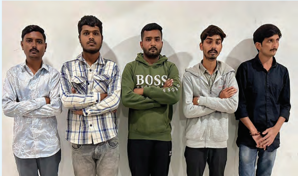
મુખ્ય પાંચ સુત્રદારોની ધરપકડ : હજુ પાંચ પેઢી સામે નોંધાશે ગુનો