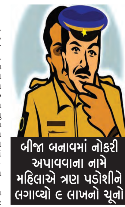
ખીજા બનાવમાં નોકરી અપાવવાના નામે મહિલાએ ત્રણ પડોશીને લગાવ્યો ૯ લાખનો ચૂનો

દર્શનસિંહ જોષી દ્વારા રાજકોટ મિરર તા. ૨૭ ગઠીયાઓ ગામને છેતરવા નીતવાના નુસખાઓ, તરકીબોનો ઉપયોગ કરી લાખો કરોડોની ઠગાઈ કરતાં હોય છે. આવા ઠીકરા ઓનલાઈન તેમજ રૂબરૂમાં પણ બની રહ્યા છે. પોલીસના નામે ગઠીયાઓ ખેલ કરી એક મહિલાને છેતરી ગયા હતાં. મંદિર નજીક જઈ રહેલા મહિલાને આંતરી બે શપ્સે પોતે પોલીસ છે, આટલા બધા ઘરેણા પહેરીને ન નીકળ્યા, આગળ સાહેબ ચેકીંગમાં છે એ ખીજાશે કહી ઘરેણા ઉતરાવી લીધા હતાં અને એક રૂમાલમાં વીટાળી પરત આપ્યા હતાં. પરંતુ બંને ગઠીયા જતાં રહ્યા બાદ મહિલાએ રૂમાલ ખોલીને જોતાં તેમાંથી કાંસકો નીકળ્યો હતો! આ પ્રકારના બનાવો રાજકોટ સહિત રાજ્યભરમાં બની ચુક્યા છે. આ વખતે અંકલેશ્વર જીઆઈડીસીમાં આવી ઘટના બની છે. બીજા બનાવમાં એક મહિલાએ નોકરી અપાવવાના નામે ત્રણ પડોશીને નવ લાખનો ચૂનો લગાડી દીધો હતો.