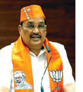
લઈને ભાજપ દ્વારા આ અંગે નિર્ણય લેવામાં આવ્યો હોવાનું હાલ જાણવા મળી રહ્યું છે. બીજી તરફ ગુજરાત

પ્રસંગે વરુચ્છલી દિલ્હીના ભાજપ નેતા પણ જોડાયા હતા. સાથોસાથ બેઠકમાં તાલુકા પ્રમુખ બનવા માટે ૪૦ વર્ષ અને જિલ્લા પ્રમુખ બનવા માટે ૬૦ વર્ષની ઉંમરની મર્યાદા નક્કી કરવામાં આવી હોવાનું હાલ ચર્ચા રહ્યું છે એટલું જ નહીં ૩૦ નવેમ્બર સુધી કમિટી બનાવવા અને આગામી દિવસોમાં મંડળની રચના કરવા માટે પણ ચર્ચા કરવામાં આવી હતી ત્યારે કરતા વધુ છે. નાણા મંત્રાલય દ્વારા કરતા વધુ છે. આગામી ચૂંટણીઓને ધ્યાને