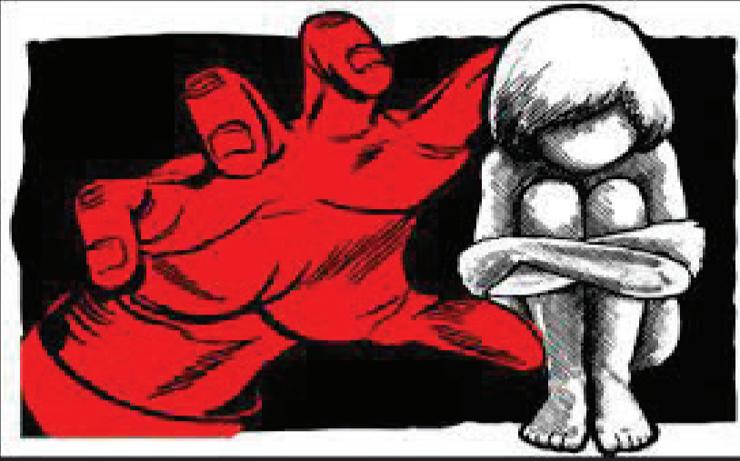
ફેસબૂકથી બે સંતાનની માતા અને બે સંતાનના પિતા વચ્ચે લવલફ્ફ થયું: પ્રેમીએ લગ્નની લાલચ દઈ વારંવાર દેહ પીંખ્યો, પછી છેલ્લે ફરી ગયો: હવે નોંધાઈ દૂષ્કર્મની ફરિયાદ

સુમ બાળકી સાથે તેના વિસ્તારમાં રહેતા શખ્સે ચોકલેટ આપી ઘરે બોલાવી શખ્સે દૂષ્કર્મ આચર્યું હતું. આ અંગે બાળકીની માતા એ વરતેજ પોલીસ મથકમાં પોસકો હેઠળ ફરિયાદ નોંધાવી છે. આ બનાવ અંગે સીટી ડીવાયએસપી આર. આર.સિંઘાલ જણાવ્યું હતું કે વરતેજ પોલીસ સ્ટેશન વિસ્તારમાં સાડા ચાર વર્ષની બાળપણ દુષ્કર્મની ઘટના સામે આવી છે. આ અંગે તેની માતાએ પોસકો હેઠળ ફરિયાદ નોંધાવી હતી, આરોપી અને ભોગ બનનાર બંને એક જ વિસ્તારમાં રહે છે. બપોરના સુમારે બાળા ઘરે એકલી હતી ત્યારે એકલતાનો લાભ લઈ એકવીસ વર્ષી ય નરાધમે ચોકલેટ આપવાના બહાને તેના ઘરે રમવા બોલાવી હતી. એ પછી એકલતાનો લાભ લઈ બાળા સાથે દૂષ્કર્મ આચર્યું હતું. પોતાની સાથે ન થવાનું થઈ જતાં હેબતાઈ ગયેલી બાળકી ૨૬તા ૨૬તા પોતાના ઘરે પહોંચી હતી. આથી માતાએ ૨૬વાનું કારણ પુછતાં તેણે કાલીઘેલી ભાષામાં ૨૬તાં ૨૬તાં પોતાની સાથે જ થયું તેની વિગત જણાવતાં માતા ચોંકી ગઈ હતી. તેણે પોતાના પતિ સહિતના પરિવારજનોને જાણ કરી હતી અને બધા પોલીસ સ્ટેશને પહોંચ્યા