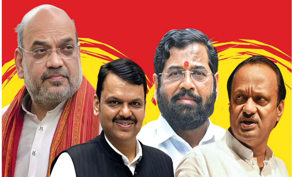
દરમિયાન, મહારાષ્ટ્રના કાર્યવાહક એકનાથ શિંદેએ બુધવારે સંકેત આપ્યો નિર્ણયને સ્વીકારશે. મુખ્ય પ્રધાન અને શિવસેનાના નેતા કે તેઓ સીએમ પદને લઈને ભાજપના દેવેન્દ્ર કડાણવીસ એક બ્રાહ્મણ

નવીદિલ્હી, તા. ૨૮ મહાપુતિ ગઠબંધનના નેતાઓ - શિવસેનાના એકનાથ શિંદે, રાષ્ટ્રવાદી કોંગ્રેસ પાર્ટી (એનસીપી)ના અજિત પવાર અને ભારતીય જનતા પાર્ટી (ભાજપ)ના દેવેન્દ્ર કડાણવીસ - આગામી પ્રમુખ અંગે નિર્ણય લેવા ગઈકાલે બેઠક કરી હતી. મહારાષ્ટ્રના મંત્રી અને સરકાર રચના કેન્દ્રીય ગૃહ મંત્રી અમિત શાહને મળ્યા હતા. આ બેઠકમાં બીજેપી ચીફ જેપી નડા, કેન્દ્રીય મંત્રી રાજનાથ સિંહ અને નિર્મલા સીતારમણ પણ હાજર રહ્યા હતા. આ બેઠકમાં મમતા બેનર્જીની જાહેરાત અંગે મોન છે, પરંતુ પાર્ટી તેના ધારાસભ્યો અને નેતાઓના દબાણ હેઠળ છે કે મુખ્યમંત્રી ભાજપનો હોવો જોઈએ. ઘણા લોકોએ વર્તમાન નાયબ મુખ્યમંત્રી દેવેન્દ્ર કડાણવીસને ટોચના પદ માટે પ્રસ્તાવિત કર્યા છે.