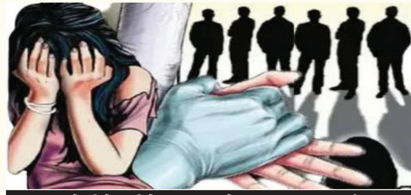
હવસખોરીને લીધે બાળા બેભાન થઈ જતાં બધા મુકીને ભાગી ગયા: અંબાજી પોલીસે ટીમો બનાવી દૂષ્કર્મોને શોધી કાઢવા મહેનત આદરી

જેવી ગુનાખોરીનો ગ્રાહક ઉંચો જઈ રહ્યો છે. સતત ચોરી, લૂંટ, હત્યાના બનાવોની સાથે સાથે બળાટકારની ઘટનાઓમાં પણ નોંધપાત્ર વધારો થયો છે. ત્યારે વિશ્વ પ્રસિદ્ધ શક્તિપીઠ અંબાજીમાં સગીરાને છ છ હવસખોરોએ બળાટકારનો ભોગ બનાવી લેતાં ખળભળાટ મચી ગયો છે. સામુહિક બળાટકારની ઘટના સામે આવતાં ઉચ્ચ પોલીસ અધિકારીઓની રાહબરીમાં ટીમો કામે લાગી ગઈ છે અને હવસખોરોને દબોચી લેવા તપાસનો ધમધમાટ શરૂ કર્યો છે. ઘટનાની વિગતો પર નજર કરીએ તો પંદર વર્ષીય સગીરા પોતાના મોટા પપ્પાના ઘરે જવા નિકળી હતી. તે દરમિયાન ઓળખીતા વ્યક્તિએ તેને બાઈક પર બેસાડી લીધી હતી.