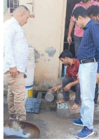
રાજકોટ તા. ૮ રાજકોટ મહાનગરપાલિકા દ્વારા સર્વેલન્સ ચેકિંગ દરમિયાન વેસ્ટ ગેટ પ્લસ ૧૦૧, ૧૫૦ ફૂટ રિંગ રોડ, રાજકોટ મુકામે આવેલ 'ઓમ ફૂડ (યુ. એસ. પીઝા)' પેઠીની તપાસ કરતા સ્થળ પર વેચાણ માટે સંગ્રહ કરેલ ૩૩૬૩-ડોન બ્રાન્ડ આઈસ્ક્રીમનો જથ્થો ફૂડ સેફ્ટી એન્ડ સ્ટાન્ડર્ડ એક્ટ-૨૦૦૬ મુજબના લેબલિંગની વિગતો

અખાધ દાજીયું તેલનો અંદાજીત ૬ કિલો જથ્થો સ્થળ પર જ કરાયો નાશ : ખાદ્યચીજોના કુલ ૨૩ નમૂનાની સ્થળ પર ચકાસણી કરવામાં આવેલ