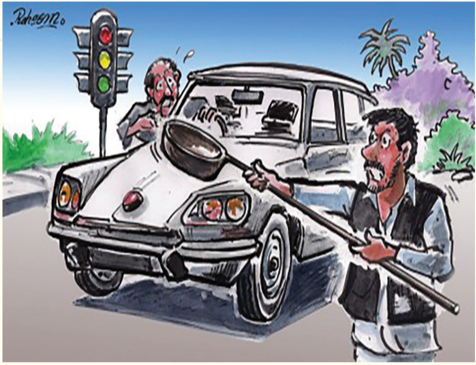
૧૫૦માં બાળક અને ૫૦૦માં આખો પરિવાર રાજસ્થાનથી અમદાવાદ લાવી ભીખ મંગાવતા, અમદાવાદ કાઈમ બ્રાન્ચે બે એજન્ટને ઝડપી પાડ્યા

પર મોટી ઉમરના લોકો પણ ભીખ માંગતા દેખાતા હોય છે. આ બાળકો અને મોટેરાઓ એટલાં બધાં કરગરે કે, આપણે દયા ખાઈને બાળકોને પાંચ કે દસ રૂપિયા આપી દઈએ. પણ આ બાળકો ક્યાંના છે, શું કામ ભીખ માગે છે એ સવાલ આપણા મનમાં ક્યારેય આવ્યો જ નથી. પરંતુ, આ એક રીતસરનો કારોબાર છે અને હુમન ટ્રાફિકિંગનું આખું રેકેટ છે. જેમાં બાળકો અને આખા પરિવારને અન્ય રાજ્યમાંથી લાવીને અમદાવાદના એસજી હાઈવે, સીજી રોડ તેમજ મહત્વના જંકશન પર ભીખ માંગવા માટે ગોઠવી દેવામાં આવે છે અને આ ગોઠવનારા કોઈ બીજા નહીં પણ રીતસરના એજન્ટ છે. વધુ માહિતી મુજબ ઘણાં વર્ષોથી ચાલતી આ પ્રક્રિયામાં અમદાવાદ કાઈમ બ્રાન્ચને એક મહત્વની સફળતા મળી છે. જેમાં કાઈમ બ્રાન્ચે બે એજન્ટની ધરપકડ કરી છે. જે રાજસ્થાનના નાના નાના જિલ્લાઓમાં જઈને બાળકો અને આખા પરિવારને ભીખ માંગવા માટે અમદાવાદ લાવતા હતા. રાજકોટ સહિતના સ્થળોએ