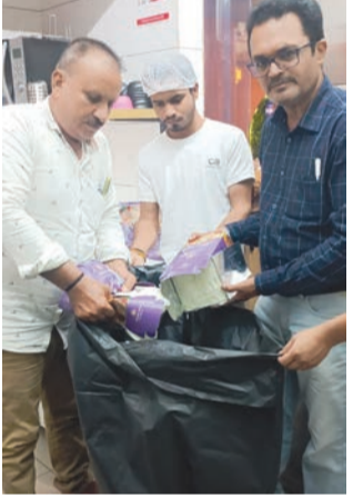
દર્શાવ્યા વગરનો તેમજ પડતર માલૂમ પડતાં અંદાજીત ૨૫ લિટર જથ્થો સ્થળ પર નાશ કરવામાં આવેલ તેમજ પેઠીને યોગ્ય સ્ટોરેજ કરવા, લાયસન્સ ધારક સપ્લાયર પાસેથી ખરીદ કરવા બાબતે નોટીસ આપવામાં આવેલ. સર્વેલન્સ ચેકિંગ દરમિયાન ચામુંડા સોસાયટી, કુવાડા રોડ, રાજકોટ મુકામે આવેલ 'બજરંગ પાણીપૂરી' ની તપાસ કરતા સ્થળ

પર સંગ્રહ કરેલ વાસી અખાધ દાજીયું તેલનો અંદાજીત ૦૬ કિ.ગ્રા. જથ્થો સ્થળ પર નાશ કરવામાં આવેલ તેમજ પેઠીને યોગ્ય સ્ટોરેજ કરવા, હાઈજેનિક કન્ટેનર જાળવવા બાબતે નોટીસ આપવામાં આવેલ. ફૂડ વિભાગની ટીમ તથા FSW વાન સાથે સર્વેલન્સ ચેકિંગ દરમિયાન ગાયત્રીનગર મેઈન રોડ વિસ્તારમાં આવેલ ખાદ્યચીજોનું વેચાણ કરતાં કુલ ૨૩ ધંધાર્થિઓની ચકાસણી હાથ ધરવામાં આવેલ. જેમાં ૦૮ ધંધાર્થિઓને લાઈસન્સ બાબતે સૂચના આપી અવેરનેસ ડ્રાઈવ કરવામાં આવેલ. તેમજ ખાદ્યચીજોના કુલ ૨૩ નમૂનાની સ્થળ પર ચકાસણી કરવામાં આવેલ. મળતી માહિતી મુજબ લાયસન્સ મેળવવા બાબતે જલારામ ફરસાણ, આરાધના પ્રોવિઝન સ્ટોર, ધનશ્યામ પ્રોવિઝન સ્ટોર, વિનાયક બેકરી એન્ડ પાર્લર, પાલજી સોડા શોપ, સોમનાથ નમકીન, ચામુંડા ફરસાણ, બાપા સીતારામ ડેરી ફાર્મને નોટિસ