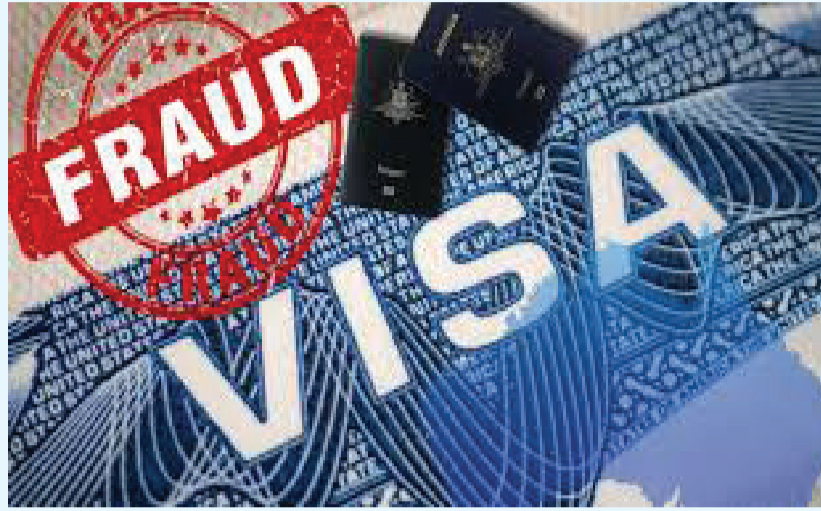
વધુ માહિતી પર નજર કરીએ તો મૂળ મહેસાણાના અને હાલ સુરતમાં રહેતા અને કચ્છમાં ખાનગી

પહોંચાડવાની આ બંનેએ રૂપિયા લઈ લીધા બાદ કોઈ તરફી ન લેતાં તેણે રૂપિયા પાછા માંગતા તેને જેલમાં પુરાવી દેવાની ધમકી આપી હતી! ચોકાવનારી અને વધુ એક વખત લાલબત્તી ધરતી આ ઘટનાની વિગતો જોઈએ તો સુરતમાં રહેતા યુવકને ઓસ્ટ્રેલિયાના વિઝા વિઝા અને ત્યારબાદ વર્ક પરમીટ વિઝા આપવાનું કહીને બંટી-બબલી સહિત ત્રણ લોકોએ રૂપિયા ૨૧.૭૦ લાખ પડાવી લીધા હતા. જો કે ઓન લાઈન ચેક કરતા વિઝા બનાવટી હોવાનું સામે આવ્યું હતું. એટલું જ નહીં રૂપિયા પરત માંગતા જેલમાં પુરાવી દેવાની ધમકી આપીને ઓફિસે તાળાં મારીને આરોપીઓ નાસી ગયા હતા. આ બનાવ અંગે ઈસનપુર પોલીસે દંપતિ સહિત લોકો સામે ફરિયાદ નોંધી છે, ચોકાવનારી બાબત એ છે કે બંટી-બબલી સામે વિદેશ મોકલવાના બહાને રૂપિયા પડાવવાની આ ત્રીજી ફરિયાદ નોંધાઈ છે.