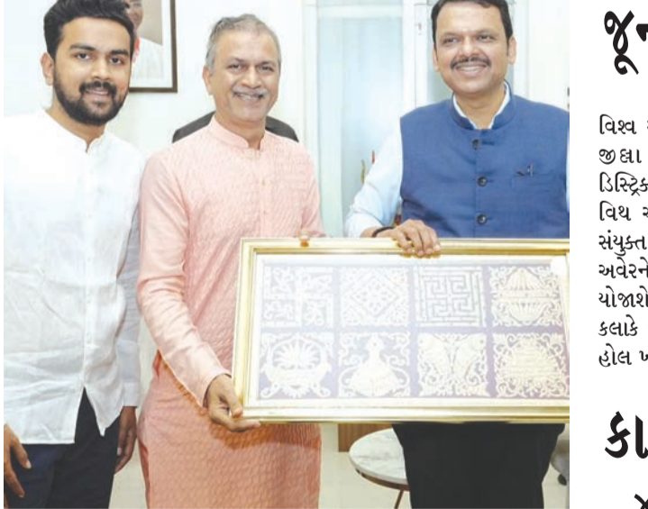
દેવેન્દ્ર ફડણવીસ સાથે શુભેચ્છા મુલાકાત કરતા ડો. ગીરીશ શાહ

રાજકોટ મિસ્ત્ર, તા.૩ દેવેન્દ્ર ફડણવીસ સાથે શુભેચ્છા મુલાકાત કરતા ડો. ગીરીશ શાહ જીવદયાના પ્રશ્નો બાબતે ચોચ કરવાની ખાતરી આપતા ફડણવીસ કરીને તેમના દૂરદેશી નેતૃત્વ અને મહારાષ્ટ્રના વિકાસ માટેના તેમના અનન્ય યોગદાન માટે આભાર વ્યક્ત કર્યો હતો દેવેન્દ્ર ફડણવીસે જીવદયાને લગતા અન્ય તમામ મુદ્દાઓ ધ્યાનથી સાંભળ્યા અને શક્ય તમામ મદદ કરવાની દેવેન્દ્ર ફડણવીસે ખાત્રી આપેલ હતી.