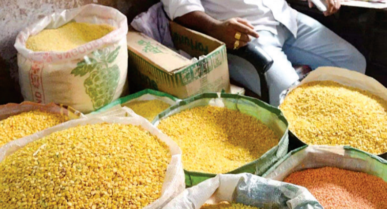
પરંતુ આ સમગ્ર વિરોધ વચ્ચે પૂરતા અનાજ ન આપવા માટે દુકાનદારો અને ગ્રાહકો આમને સામને આવી ગયા છે એવામાં જરૂરી અનાજનો જથ્થો ઓછો ફાળવવામાં આવતો હોવાથી દુકાનદારો અને કાર્ડ ધારકો વચ્ચે

રાજકોટ, તા. ૩ હાલ પુરવઠાને લઈ ઘણા ખરા પ્રશ્નો ઊભા થઈ રહ્યા છે અત્યારે સમગ્ર રાજ્યમાં જો કોઈ સળગતો વિષય હોય તો તે એ છે કે સસ્તા અનાજની દુકાનો પર અત્યારે એ કહેવાય સી ન કરેલા કાર્ડ ધારકોને અનાજ ન આપવા માટેનો દુકાનદારો અને ગ્રાહકો વચ્ચે દેકારો થઈ રહ્યો છે આ સમયગાળામાં હવે સરકારે પણ કહી શકાય કે બંનેને આશ્ચર્ય થાય તેવો નિર્ણય લીધો છે. મળતી માહિતી મુજબ રાજકોટ શહેર જિલ્લાના સસ્તા અનાજના દુકાનદારો માટે ચાલુ ડિસેમ્બર મહિનામાં સસ્તા અનાજમાં મળતી દાળ અને ચણાનો જથ્થો પ્રશ્નો ઊભા કરી શકે છે કારણ કે જરૂરિયાત મુજબના જથ્થાના બદલે પુરવઠા નિગમ દ્વારા માત્ર અડધો જથ્થો ફાળવવામાં આવશે તેવી વાત હાલ ચાલી રહી છે જેને લઈને કાર્ડ ધારકોને પણ વહેલા તે પહેલા ના ધોરણે જથ્થો મળશે.