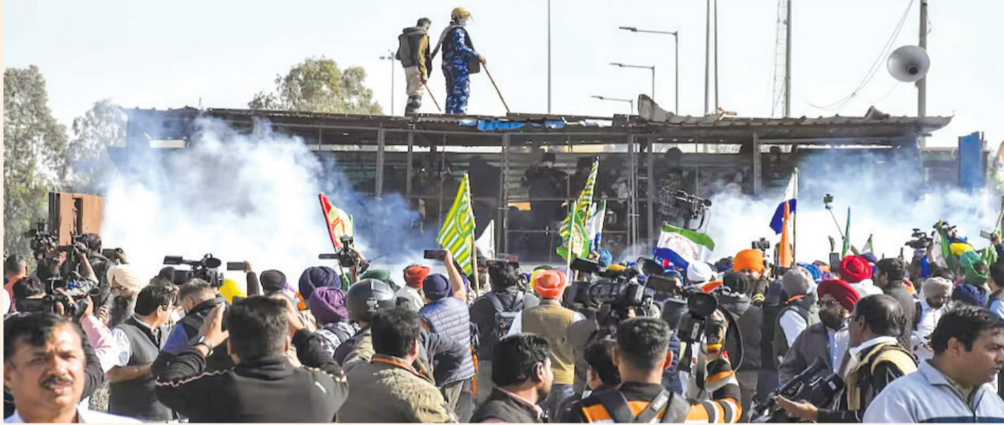
રવિવારે બપોરે ૧૨ વાગ્યે દિલ્હી જશે

કૃષિ મંત્રી સાથે બેઠક કરવા ઉગ્રમાંગ : શંભુ બોર્ડર પર થયો હંગામો , ખેડૂતોએ તોડી નાખ્યા બેરીકેટ