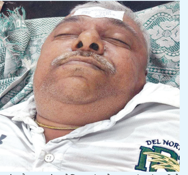
રોગના હુમલાથી મોત થયાનું જાહેર કરવામાં આવ્યું હતું. જ્યારે બીજા બનાવમાં ગાંધીગ્રામ સ્ટેલિંગ હોસ્પિટલ પાછળ રાજલક્ષ્મી ડુપલેક્ષમાં એક વર્ષ પહેલા જ લગ્ન થયા હતાં. આ યુવાન માત્ર અઠ્ઠાવીસ વર્ષનો હતો. તેનું હૃદય