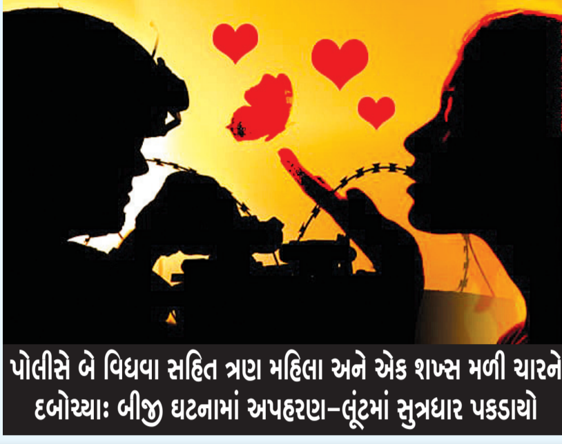
પોલીસે બે વિધવા સહિત ત્રણ મહિલા અને એક શપ્સ મળી ચારને દબોચ્યા: બીજી ઘટનામાં અપહરણ-લૂંટમાં સુત્રધાર પકડાયો