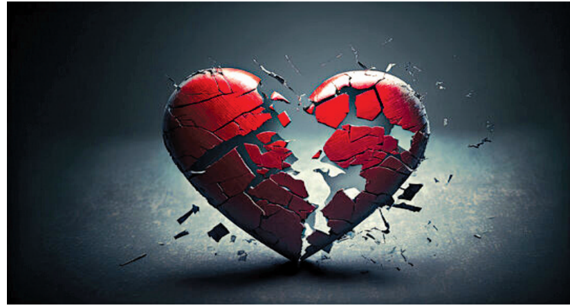
આ ઘટનામાં વધુ માહિતી જોઈએ તો મોરબી પંથકમાં રહેતી છવ્વીસ વર્ષની યુવતિએ વોટર પ્લાન્ટ નજીક એસિડ પી લેતાં મોરબી હોસ્પિટલમાં અને ત્યાંથી રાજકોટ સિવિલમાં

લવલખતી સમાન એવી આ ઘટનાની વિગતો પર નજર કરીએ તો મિત્રતા અને બાદમાં કહેવાતા પ્રેમના નામે ફસાવી યુવતિઓનું શોષણ કરી કહેવાતા પ્રેમીઓ પોતાનો સ્વાર્થ સાધી લીધા પછી તેણી સાથેના સંબંધ ખતમ કરી નાખતા હોય છે. આવા સતત બનતા બનાવો વચ્ચે વધુ એક કિસ્સો મોરબી પંથકમાં બન્યો છે. છવ્વીસ વર્ષની યુવતિ એક ખાનગી સ્થળે નોકરી કરતી હોઈ ત્યાં આવતાં એક શખ્સે તેણી સાથે ઓળખાણ કેળવી બાદમાં પ્રેમજાળમાં ફસાવી લગ્નની લાલચ આપી તેનો દેહ ભોગવી લીધો હતો. પરંતુ બાદમાં આ યુવાને બીજી યુવતિ સાથે સગાઈ કરી લેતાં તેમજ યુવતિએ લગ્ન માટે ફોન કરતાં આ શખ્સે હવે ફોન કરતી નહિ, તુ તારા રસ્તે અને હું મારા રસ્તે તેમ કહી ધમકી આપતાં આઘાતને કારણે તેણીએ એસિડ પી આપઘાતનો પ્રયાસ કરી લીધો છે.