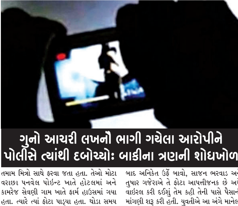
ગુનો આચરી લખનો ભાગી ગયેલા આરોપીને પોલીસે ત્યાંથી દબોચ્યો: બાકીના ત્રણની શોધખોળ