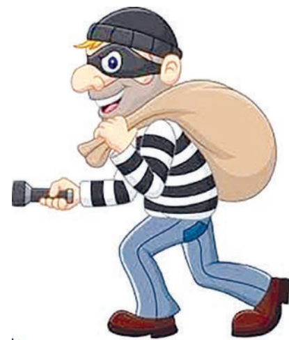
આવેલ ન હતો. જેથી મારા પિતાએ આ બાબતે મને પુછતા મે મારા પિતાને જણાવેલ હતું કે મે આ રૂપિયા લીધેલ નથી. અમોએ અમારા કારખાનામા એક

વંધો વેપાર રહે.પારસ સોસાયટી શેરી નં.૦૨, મકાન નં.૩૦-એ કેલા' નીર્મલા કોન્વેન્ટ સ્કુલની સામે, નીર્મલા કોન્વેન્ટ રોડ)ની ફરિયાદ દાખલ કરી છે.તેમણે જણાવ્યું છે કે હું મારા પરીવાર સાથે રહુ છું અને અમારે રાજકોટ શહેર આજી.જીઆઈડીસી ૮૦ ફુટ રોડ ખાતે ઋષિ એક્સપોર્ટ પ્રાઈવેટ લીમીટેડ નામનું કારખાનું આવેલ છે અને આ કારખાનામાં કિઝલ એન્જીન પંપ બનાવીએ છીએ અને એક્સપોર્ટ કરીએ છીએ. આ કારખાનું હું તથા મારા પિતા બંને છેલા પાંત્રીસ વર્ષથી સંભાળીએ છીએ અને મે ઈન્ટરનેશનલ બીઝનેસમા પીએચડી કર્યું છે. ગઈ તા.૨૨/૧૦/૨૦૨૪ના રોજ હું તથા મારા પિતા કારખાને ગયેલ હતા અને મારા પિતાએ તા.૦૫/૧૦/૨૦૨૪ના રોજ કારખાનાના શેડમાં પેડેલ લોખંડના કબાટમાં રૂપિયા ૧૫,૦૦,૦૦૦ રાખેલા હતા, અમારા ઘરે રૂપિયાની જરૂરીયાત હોઈ જેથી મારા પિતાએ આ લોખંડનો કબાટ ખોલેલ અને કબાટમાં જોતા રૂપિયા જોવામાં