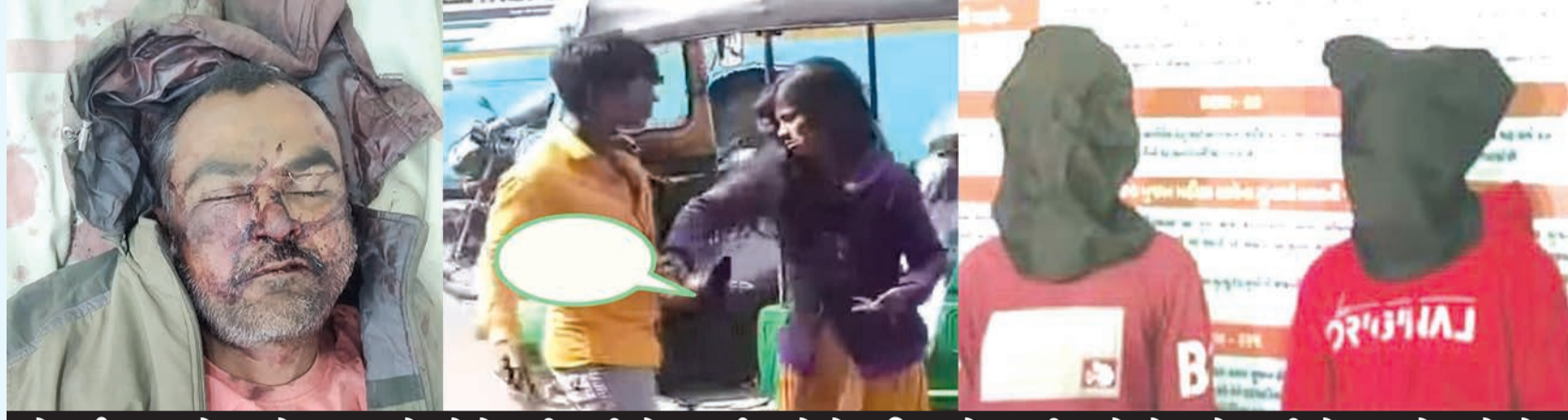
થોડા દિવસ પહેલા શોભના સામે મુકેશે છરી કાઢી ખેલ કર્યા ત્યારે તે પતિ પાસે આવી ગયો હોત તો ખૂબી ખેલ ન ખેલાયો હોત

દર્શનસિંહ જોડેજા દ્વારા રાજકોટ મિસ્ત્ર, તા. ૧૦ શહેરમાં હત્યાની વધુ એક ઘટના ઘટી હતી અને એ સાથે જ કલાકોમાં પોલીસે હત્યારાને દબોચી લીધો હતો. પ્રેમપ્રકરણમાં ડબ્બા થવાને કારણે હત્યાની અનેક ઘટનાઓ બની ચુકી છે. આ બનાવમાં પણ પારકી પરણેતર સાથે લકઝ ધરાવતાં રિક્ષાચાલકે આ પરણેતરનો પતિ પોતાની પ્રેમકહાનીમાં આડે આવતો હોઈ તેને કુરતાથી મોતને ઘાટ ઉતારી દીધો હતો અને ભાગી ગયો હતો. એલસીબી ઝોન-વનની ટીમે તેને ગોંડલથી પકડી લીધો હતો. ચોકાવનારી વાત એ છે કે હત્યારાએ હત્યા કર્યા પછી મૃતકના સોળ વર્ષના પુત્રને ફોન કરીને કહ્યું હતું કે મેં તારા બાપને મારીને ફેંકી દીધો છે!