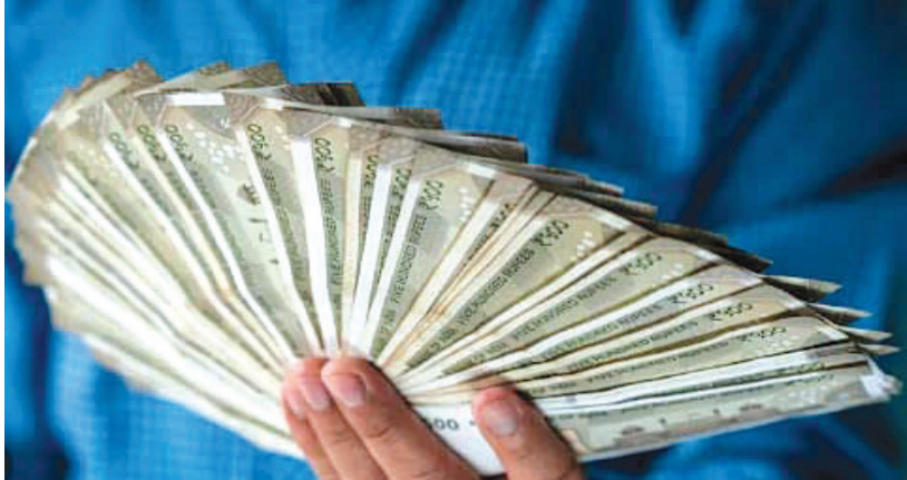
અન્ય કિસ્સામાં વેપારી સાથે આઠ લાખની ઠગાઈમાં આરોપીના મળ્યા બે દિવસના રિમાન્ડ

ધમકી આપી હતી. આ બનાવ અંગે મહિસાનગર પોલીસે ગુનો નોંધી વધુ તપાસ હાથ ધરી છે. વધુ માહિતી અનુસાર મહિસાનગરમાં રહેતા અને બાપુનગરમાં ફર્નિચરની કેક્ટરી ધરાવી ધંધો કરતા વેપારીએ મહિસાનગર પોલીસ સ્ટેશનમાં બે લોકો સામે ફરિયાદ નોંધાવી છે કે વર્ષ ૨૦૧૪માં તેમને મિત્ર દ્વારા નવસારીના સાથે ઓળખાણ થઈ હતી. જે બાદ તેના મિત્ર રૂપિયા ૫ લાખની જરૂર છે તેમ જણાવ્યું હતું. પરંતુ વેપારીએ રૂપિયા આપવાની ના પાડી હતી. એક મહિના પછી ફરીથી બન્ને જણા મળ્યા હતા. તે સમયે રૂપિયા ૫ લાખ રોકડા આપ્યા હતા અને જે મહિનામાં પરત આપવાનું જણાવ્યું હતું જેના એક મહિના ધંધા માટે રૂપિયા ૨૫ લાખની જરૂર છે અને એક વર્ષમાં રૂપિયા પરત આપવાનું કહ્યું હતું. જેથી વેપારીએ રૂપિયા આપ્યા બાદ અવાર નવાર ટુકડે-ટુકડે કુલ રૂપિયા ૧.૮૫ કરોડ લીધા હતા. ત્યારબાદ નોટબંધી આવતાં બંને જણા જૂની નોટો લઈને રૂપિયા પરત આપવા આવ્યા હતા. જેથી ફરિયાદીએ જૂની નોટો શુ કરીશ કહીને ના પાડી હતી. જેથી બંનેએ રૂપિયા માટે થોડી રાહ જોવી પડશે પરંતુ નોટબંધીનો સમય પૂર્ણ