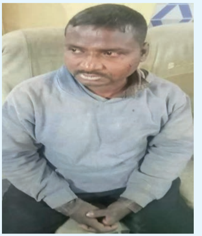
રહે છે. રોજબરોજ સિક્યુરીટીની ટીમો

હોસ્પિટલની ફૂટપાથ પર પડ્યો રહી રખડતુ જીવન જીવતો હોવાનું તેમજ મુળ યુપીના દેવરીયાના સલેમપુરના બઢ્યાહડદાનો વતની હોવાનું કહ્યું હતું. પોલીસ આવી એ પહેલા સિક્યુરીટીની વિશેષ પુછતાછમાં તેણે પોતે હોસ્પિટલમાં અન્નક્ષેત્રમાં જમવા આવ્યાનું રટણ કર્યું હતું. જો કે આ બનાવમાં નર્સ દ્વારા ફરિયાદ નોંધાવવાનો ઈન્કાર થતાં પોલીસે ફરિયાદી બની આ શખ્સ સામે છરી રાખવાનો ગુનો નોંધી ધરપકડ કરી હતી. ઉલ્લેખનિય છે કે સિવિલ હોસ્પિટલની સરકારી જગ્યામાં મફતમાં સુવાની જગ્યા અને ભરપેટ ભોજન મળી રહેતાં હોઈ અહિં ખરેખર જરૂરીયાતવાળા હોય તેવા લુખ્ખા લોકોની સાથે સાથે લુખ્ખા, દારૂડીયા, આવારા તત્વો પણ પડ્યા પાથર્યા