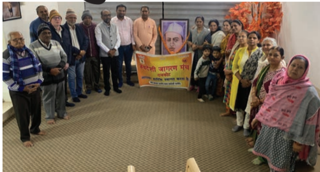
શહીદની શહાદતને વાગોળી અર્પણ શ્રદ્ધાંજલિ

રાજકોટ મિસ્ત્ર, તા.૧૩ સ્વદેશી જાગરણ મંચ રાજકોટ દ્વારા સ્વદેશી ખાતર પોતાનું જીવન કુરબાન કરનાર પ્રથમ શહીદ એવા બાબુ ગેનુની પુણ્યતિથિ પર એમને શ્રદ્ધાંજલિ