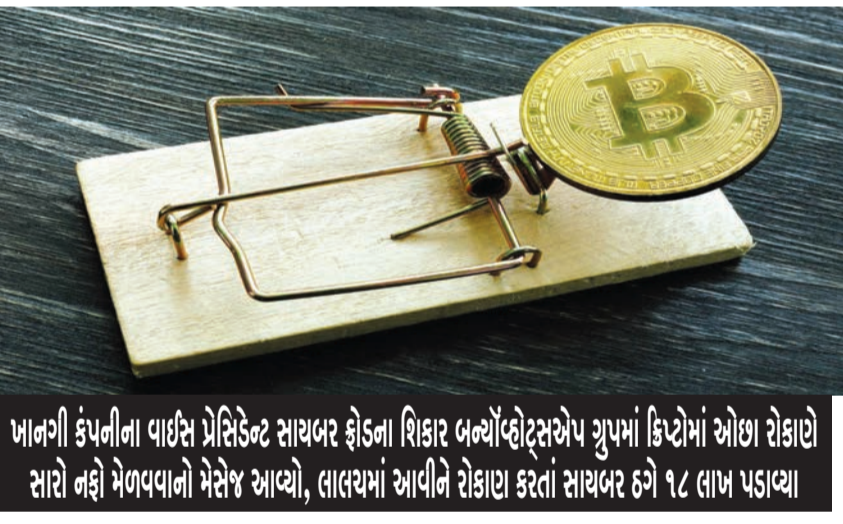
ખાનગી કંપનીના વાઈસ પ્રેસિડેન્ટ સાયબર ફોડના શિકાર બન્યો વ્હોટ્સએપ ગ્રુપમાં ક્રિપ્ટોમાં ઓછા રોકાણે સારો નફો મેળવવાનો મેસેજ આવ્યો, લાલચમાં આવીને રોકાણ કરતાં સાયબર ઠગે ૧૮ લાખ પડાવ્યા

૨૮.૦૧ લાખ રૂપિયા પડાવ્યા હતા. આથેડનો વિશ્વાસ કેળવવા માટે શરૂઆતમાં રૂપિયા ૯.૮૧ લાખ રૂપિયા પરત આપ્યા હતા. જ્યારે બાકીના ૧૮.૨૦ લાખ અત્યાર સુધી પરત નહીં કરી તેમની સાથે ક્ષણ કરવામાં આવી હોય તેઓએ સાયબર કાર્ટમ પોલીસ સ્ટેશનમાં ફરિયાદ નોંધાવી છે. બિલ ગામ પાસે આવેલ સોસાયટીમાં રહેતા અને ખાનગી કંપનીના વાઈસ પ્રેસિડેન્ટ એ સાયબર કાર્ટમ પોલીસ સ્ટેશનમાં નોંધાવેલી ફરિયાદમાં જણાવ્યું છે કે, ગત ૧૨ ફેબ્રુઆરીના રોજ હું મારા ઘરે હતા ત્યારે સામેથી મારા મોબાઈલ નંબરના વોટ્સએપ ઉપર એક એજાણ્યા નંબર ઉપરથી મેસેજ આવ્યો હતો અને તેમા મને શેર માર્કેટ લગતી ટિપ્સ આપવામાં આવતી હતી. આ નંબર સાથે સતત બે મહિના સુધી તેઓના કલાઈન્ટને થયેલા પ્રોફિટના ફોટા મોકલતા હતા અને