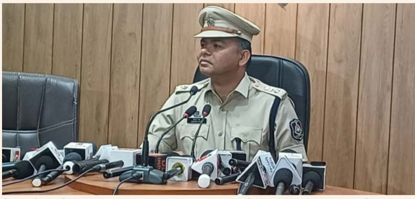
સેમિનારો કરાશે લુખ્ખા તત્વો સામે તડીપાર અને પાસા અંતર્ગત ગુન્હાઓ નોંધી જેલબેગા કરાશે. તેઓએ એવું પણ જણાવ્યું હતું કે, સમગ્ર

જિલ્લા વિસ્તારમાં કાયદો અને વ્યવસ્થા જળવાઈ રહે તે માટે તેમજ કોઈ પણ પ્રકારના દંગા-ફસાદ જેવા ગુન્હા ન બને તે બાબતે ફોકસ વધારીને ગુન્હાખોરી પર બ્રેક મારવાનો સંગીન પ્રયાસ કરાશે. ગુન્હા બનવા જ ન જોઈએ અને બને તો તાત્કાલિક એકાઈઆર દાખલ કરી આરોપીઓને ઝડપી લેવાશે અને ગુન્હાની વાતમાં કોઈ પણ ચમ્મરબંધી સામે પણ કડક પગલા લેવા તેઓ નહિ અચકાય. મહિલા સુરક્ષા અંગે સતત સતર્કતા દાખવવાની વાતમાં તેઓએ જણાવ્યું હતું કે, કોઈ પણ મહિલા કોઈ પણ જગ્યાએ નિર્ભીક આવન જાવન કરી શકે તેવું ફૂલ પોલીસ વાતાવરણ ઊભું કરશે. સાયબર કાર્ટમના ગુન્હા અટકાવવા લોક જાગૃતિ, પેમ્પલેટ્સ અને