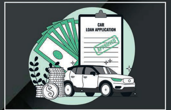
Loan & Insurance