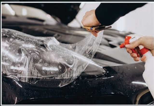
Paint Protection Film