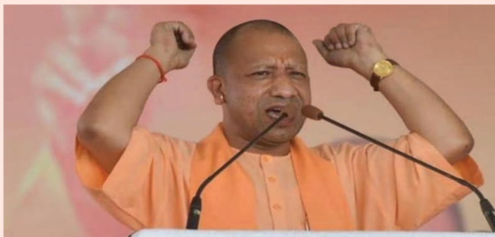
કરી, પરંપરાનો સંપૂર્ણ નાશ કર્યો. ભારતના ઐતિહાસિક યોગદાનની ચર્ચા કરતા સીએમ યોગીએ કહ્યું કે, "પ્રથમ અને પંદરમી સદી વચ્ચેના વિશ્વ અર્થતંત્રમાં યુરોપિયન વિદ્વાનો પણ સ્વીકારે છે કે તે સમયે વિશ્વની અર્થવ્યવસ્થામાં ભારતનો હિસ્સો ૪૦ ટકા હતો."

બનાવનાર કામદારોનું સન્માન કરી રહ્યા હતા. એક તરફ પીએમ તેમના પર ફૂલ વરસાવી રહ્યા હતા, તો બીજી તરફ, આ પહેલાની સ્થિતિ. એવું કહેવાય છે કે તાજમહેલ બનાવનારા મજૂરોના હાથ કાપી નાખવામાં આવ્યા હતા. તેમણે એ પણ ઉલ્લેખ કર્યો કે ઈતિહાસમાં કાપડ ઉદ્યોગમાં કામ કરતા કામદારોના હાથ પણ કાપી નાખવામાં આવ્યા હતા, જેનાથી સમગ્ર પરંપરા અને વારસાનો નાશ થયો હતો. યુપીના સીએમએ કહ્યું, "આજે ભારત તેના શ્રમબળનું સન્માન કરે છે અને તેમને દરેક પ્રકારની સુરક્ષા પૂરી પાડે છે. બીજી તરફ, એવા શાસકો હતા જેમણે મજૂરોના હાથ કાપી નાખ્યા અને સારા કાપડ બનાવનારા વણકરોના વારસાને નષ્ટ