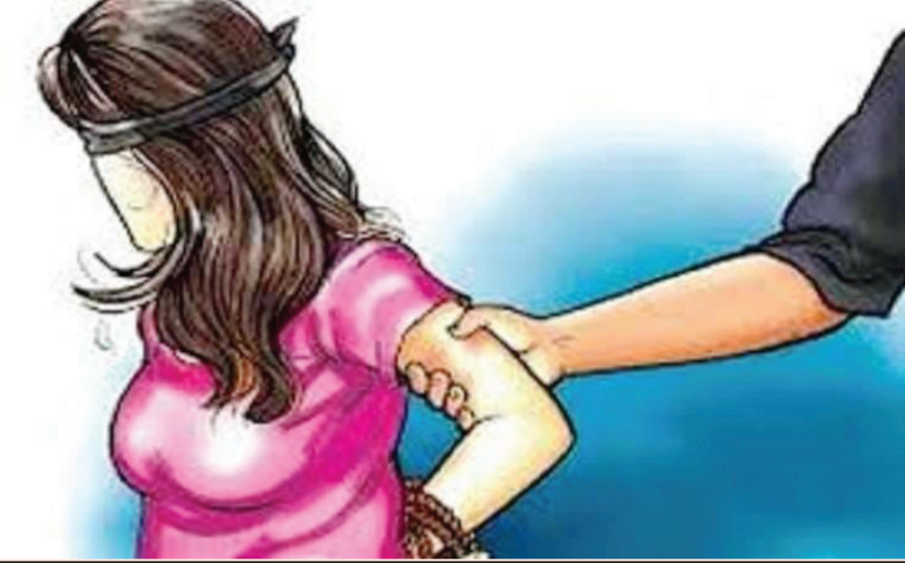
ત્રીજી ઘટનામાં યુવતિએ હવસખોરે સરાજહેર પાછળથી આવી બથ ભરી અડપલા કર્યા: દેકારો મચતાં ટોળાએ બેફામ ઢીલ્યો, પોલીસે પણ ખોખરો કર્યો