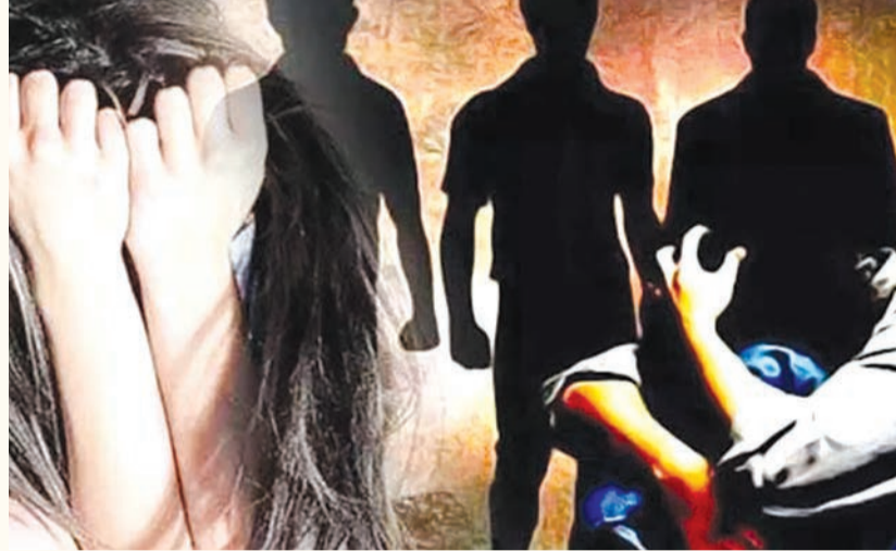
યુવતિએ પોતાની સાથે મંગેતરે શરીર સંબંધ આ રીતે પેટમાં છ મહિનાનો ગર્ભ રહી ગયો હતો. એ પછી પેટમાં દુઃખાવો થતાં માતા તેણીને

મોત થતાં પોલીસે કાર્યવાહી કરી હતી. બંધે વખત હવસખોરીનો ભોગ બનેલી આ યુવતિ રાજકોટની હોસ્પિટલમાં સારવાર હેઠળ છે. કચ્છા કથનીની વિગતો જોઈએ તો રાજકોટના શાપર પંથકમાં રહેતી પરપ્રાંતની વીસ વર્ષની યુવતિ સતત બે વખત હવસખોરીનો ભોગ બની છે. પહેલી વખત તેના પર તેના સગા બાપે બળાત્કાર ગુજાર્યો હતો. આ હવસખોર બાપે બાદમાં જેલમાં એસિડ પી આપઘાત કરી લીધો હતો. ત્યારબાદ યુવતિની તેના વતનના યુવાન સાથે સગાઈ કરવામાં આવી હતી. પણ તે તેણીને લલચાવી કોસલાવી લગ્ન પહેલા જ શરીર સંબંધ બાંધી ગર્ભ રાખી દઈ ભાગી નીકળ્યો હતો. આ યુવાન તેની માતા સાથે રહેતો હતો. પોતાની સાથે માતાને પણ તે લઈ ગયો હતો. એક વખત સગા બાપ થકી આઘાતમાં ગરક થઈ ગયેલી યુવતિ હવે મંગેતરની દગાખોરીને કારણે ઉંડા આઘાતમાં ગરકાવ થઈ ગઈ હતી.