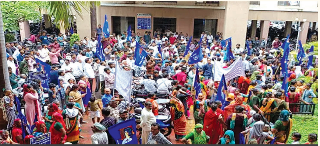
રહેવાસીઓ દ્વારા સોદો રદ કરવા અનેક લેખિત રજૂઆતો

કરોડની જમીન ૧૧૦ કરોડમાં લેવાનો પ્લાન નિષ્ફળ નીવડ્યો. મળતી માહિતી મુજબ હાલ બિલ્ડર લોબીમાં એ વાતની ચર્ચાએ જોર પકડ્યું છે કે જેપી ઇન્ફ્રાસ્ટ્રક્ચર પ્રાઇવેટ લિમિટેડ ને જે આ કામ મળ્યું હતું તો તેના અન્ય પ્રોજેક્ટ અંગે પણ ઊંડી તપાસ હાથ ધરવામાં આવે જો તપાસ થશે તો અનેક ચોંકાવનારી વિગતો બહાર આવી શકે છે તેવું હાલ બિલ્ડર લોબીમાં ચર્ચાઈ રહ્યું છે. સાથોસાથ ભીમ નગર આવાસ યોજના માટે ભારે હોબાળો પણ મચ્યો હતો જે બાદ ભીમનગરના રહેવાસીઓ દ્વારા સોદો રદ કરવા લેખિત રજૂઆત કરવામાં આવી હતી અને રેલી યોજના હતી સાથોસાથ આક્ષેપો પણ થયા હતા. ત્યાંના રહેવાસીઓ દ્વારા દેખાવો પણ કરવામાં આવ્યા અને આ ઊલ ને લઈને ભારે હંગામો પણ મચ્યો હતો. ઈડર લોબીમાં પણ ભીમ નગર આવાસ યોજનાને લઈ અનેક પ્રશ્નો ઉભા થઈ રહ્યા છે કારણ કે ૪૪૮ કરોડની જમીન હોય તો ૧૧૦ કરોડમાં શું કામ સોંપવી ? સુતો દ્વારા મળતી માહિતી મુજબ ભીમ નગર આવાસ યોજના માટે ત્રણ પ્રીમિયમ મહાનગરપાલિકાને મળ્યું હતું જેમાં ટેન્ડર જે એજન્સી ને લાગ્યું તે બાદ આચાર સહિત લાગુ પડવાના કારણે બીડ પોલી શકી ન હતી જેને રદ જૂના રોજ ખોલવામાં આવી હતી. ભીમ નગર આવાસ માટે કુલ ૪૦૦ યુનિટ બનાવવામાં આવનાર