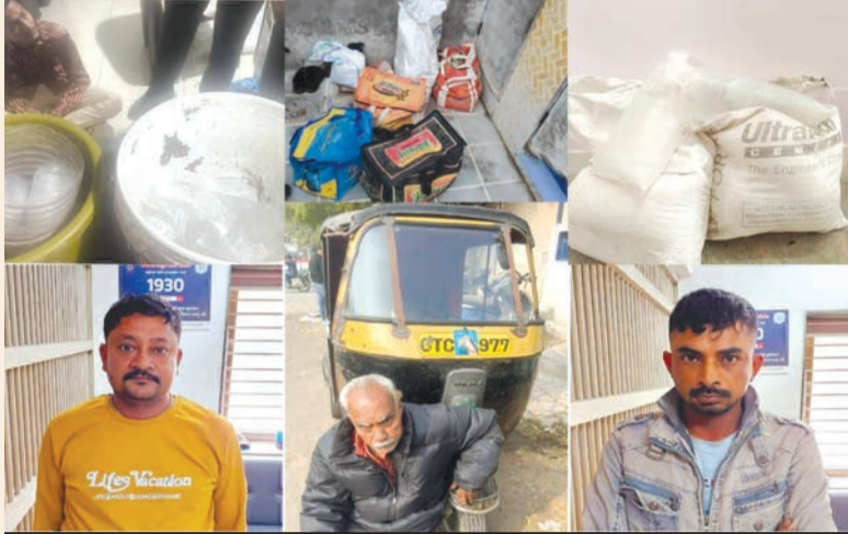
રાજકોટ એલસીબી ઝોન-૨ ટીમે દેશી દારૂના જથ્થા સાથે પાંચને પકડ્યા, ઝોન-૧ ટીમે કારમાં દાડ સાથે એકને પકડ્યો

દર્શનસિંહ જોડા દ્વારા રાજકોટ મિરર, તા. ૨૩ એકત્રીસમી ડીસેમ્બરને હવે ગણતરીના દિવસો જ બાકી છે ત્યારે સોરાષ્ટ્ર-રાજકોટમાં અને ગુજરાતભરમાં વિદેશી દારૂની રેલમથેલ કરી દેવા બહારના રાજ્યના સવાયરોએ ગુજરાત-સોરાષ્ટ્રના બુટલેગરો, સવાયરો સાથે મળીને લાખોનો દાડ ઠાલવવા પ્રયાસ આદરી દીધા છે. જો કે પોલીસ સતત લાખોનો દાડ જે તે સ્થળે પહોંચે અને વિતરણ થાય એ પહેલા પકડી લેવામાં સફળ રહી છે. વધુ એક વખત આવી સફળતા મળી છે. આ વખતે સ્ટેટ મોનીટરીંગ સેલની ટીમે ચોટીલા પાસે સફળ દરોડો પાડી એકત્રીસ લાખનો દાડ ભરેલુ ટેન્કર પકડી લીધુ છે. આ ટેન્કર જથ્થો લઈને એક વાડીમાં કટીંગ માટે પહોંચ્યું હતું. કટીંગ ચાલુ રહ્યું હતું ત્યાં જ એસએમસીએ દરોડો પાડી દીધો હતો.