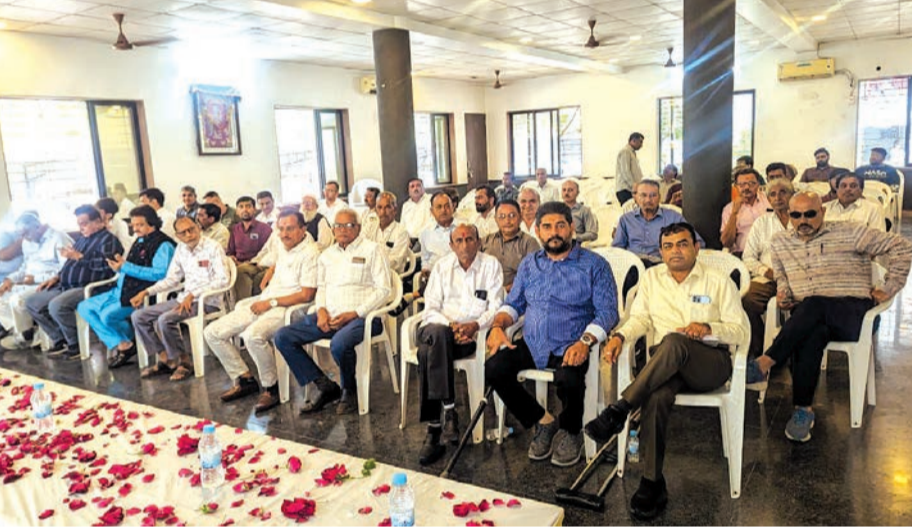
ચૂંટણી પછી દેડકારૂપી કેસરિયા ગાયબ

બાપુએ કોઈનું પણ નામ લીધા વિના કહ્યું કે અગાઉ એવી થતું કે ડ્રાઈવર દારૂ ઢિંચેલો હોય એવી ખબર પડે તો સ્વસુરક્ષામાં બધા પ્રવાસી ઉતરી પડતાં. કેમકે તેની સાથે પ્રવાસ ખેડવામાં આપણી સુરક્ષા જોખમી શકે છે. પરંતુ આજના બાપુના યુગમાં આપણે બસમાં બેસી રહેવાનું છે અને ડ્રાઈવરને ઘડકો મારીને ઉતારી પાડવાનો છે. તેના બદલે આપણને સુરક્ષિત મંઝિલે પહોંચાડી શકે એવો વ્યવસ્થિત ડ્રાઈવર શોધી કાઢવાનો છે. જે આપણને મંઝિલ સુધી પહોંચાડી શકે. ગાંધીનગર અને દિલ્હી સિવાય મહાનગરોમાં આવા ડ્રાઈવરો બેઠાં છે જેમના હાથે આપણો સુરક્ષિત નથી એટલે સુરતીઓએ શુ કરવું જોઈએ એ કહેવાની જરૂર નથી.