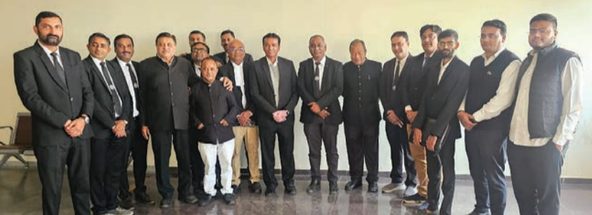
૨૫ વર્ષે આવ્યો યુકાદો : ૪૭ આરોપીને રાહત મોટાભાગના સાહેદો - સાક્ષીઓ થયા હોસ્ટાઈલ