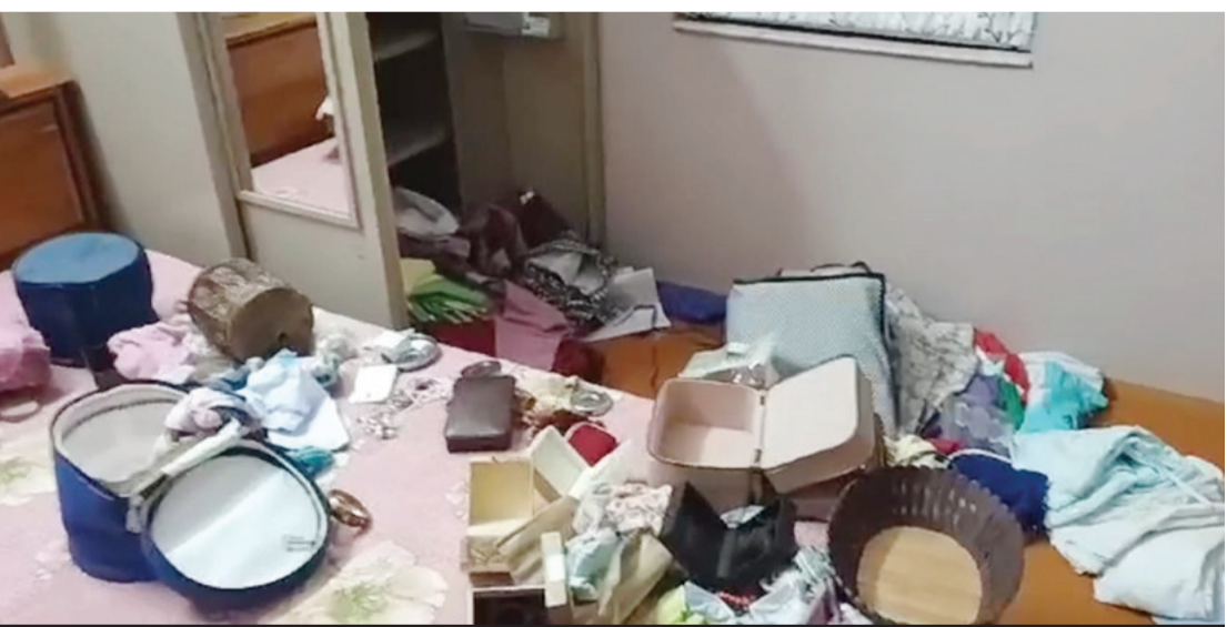
કંઈ નહિ તો હીરાસરની વીડીમાંથી બે પાડી અને એક પાડાને ચોરી જવાયા: ચોર ત્રિપુટી પકડાઈ ગઈ