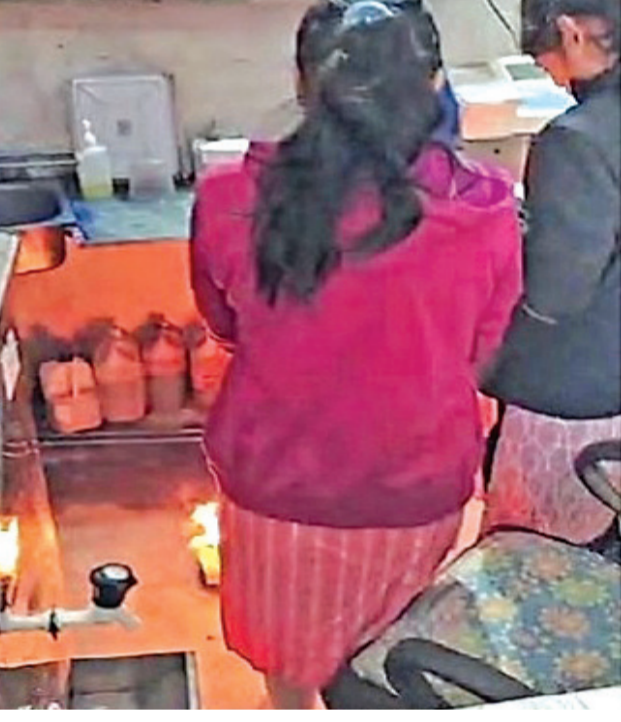
ફાર્માસિસ્ટ તથા લેબોરેટરી ટેકનીશિયનને દોષીત ગણીને આઉટસોર્સિંગ એજન્સીને જાણ કરી તેમને છુટ્ટા કરવા કાર્યવાહી કરાઈ છે. રાજકોટ જિલ્લા પંચાયતના મુખ્ય જિલ્લા આરોગ્ય અધિકારીએ જણાવ્યું હતું.

રાજકોટ મિરર, તા. ૩૧ શાપર(વેરાવળ) આરોગ્ય કેન્દ્રમાં દર્દીઓને દવા દેવાને બદલે હંડી ઉડાવવા જોખમી તાપણું કરી બેઠેલા ચાર કર્મચારીઓને તાપણું મોંઘું પડ્યું હોય તેમ બે કર્મચારીઓને છુટ્ટા કરી દેવાયા છે અને બે ને કારણદર્શક નોટીસ આપી મુલાસો મંગાવ્યો છે. પ્રામ વિગતો મુજબ ૨૮ ડિસેમ્બરના રોજ શાપર સામુદ્રિક આરોગ્ય કેન્દ્રમાં કરામાંચારીઓએ તાપણું કર્યું હોવાની ઘટનાના સમાચાર સોશિયલ મીડીયામાં વાઈરલ થયા હતાં. જેના સંદર્ભે મુખ્ય જિલ્લા આરોગ્ય અધિકારીએ ૩૦ ડિસેમ્બરને સોમવારે શાપર સામુદ્રિક આરોગ્ય કેન્દ્રના સુપ્રિટેન્ડન્ટ, ફાર્માસિસ્ટ, લેબોરેટરી ટેકનીશિયન અને બે આયુર્વેદિક ઈટર્નને બોલાવીને સ્પષ્ટ ચર્ચા કરી હતી. જેમાં ધ્યાનમાં આવ્યું કે વિડીયોમાં જે બેદરકારી જોવા મળેલી છે, તે ગંભીર બાબત છે. તેને ધ્યાને લઈને શાપર સામુદ્રિક આરોગ્ય કેન્દ્રના સુપ્રિટેન્ડન્ટને કારણદર્શક નોટીસ આપી મુલાસો મંગાવવામાં આવેલો છે તેમને ભવિષ્યમાં આવી બેદરકારી ન થાય તે માટે તાકીદ કરવામાં આવી છે. બે આયુર્વેદિક ઈટર્નને સ્થળ બદલવા માટે કાર્યવાહી કરવામાં આવી છે. તેમજ આઉટસોર્સિંગ એજન્સીમાંથી કામ કરતા