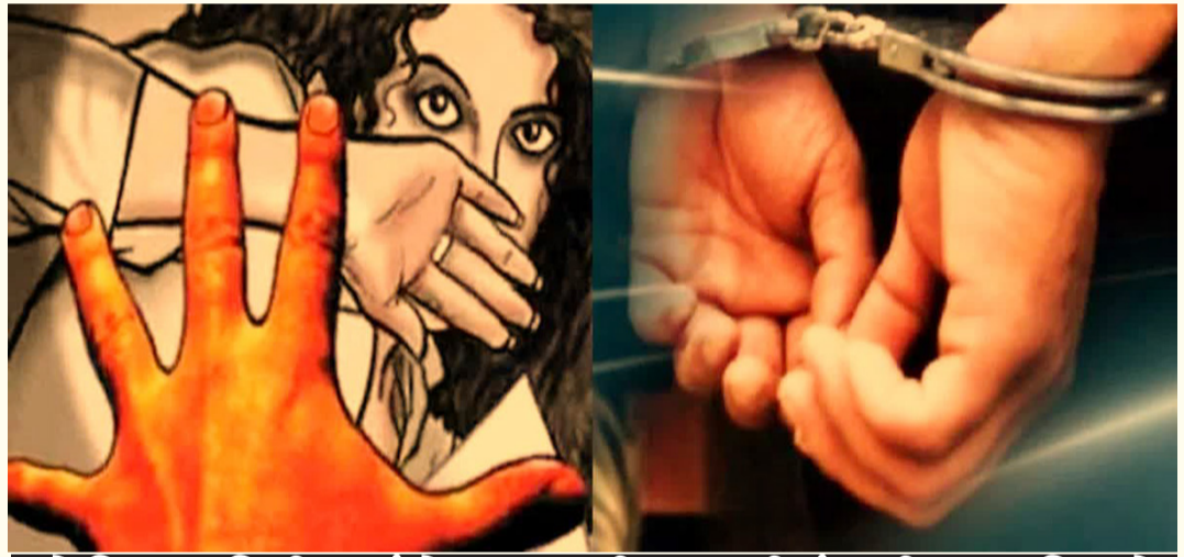
સોશિયલ મિડીયામાં ફેક આઈડી બનાવી કંપનીના માલિકનો ફોટો મુકી ૬૯ લાખ પડાવ્યા: એક ગઠીયો પકડાયો