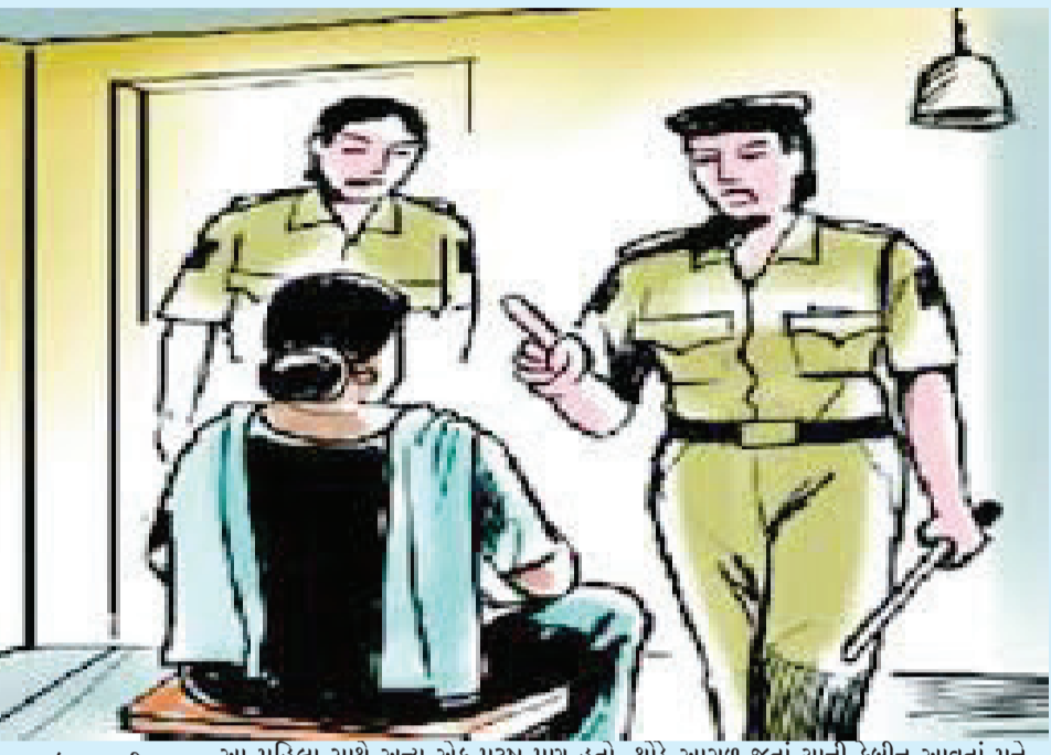
આ મહિલા સાથે અન્ય એક પુરુષ પણ હતો. થોડે આગળ જતાં યાની કબીન આવતાં મને આ બંનેએ યા પીવડાવી હતી. થોડીવાર બાદ મારુ માથું ભારે થવા માંડ્યું હતું. એ પછી હું એ બહેનની પાછળ ચાલવા લાગી હતી. તેની સાથેનો શપ્સ પાછળ ટૂંકીલર વાહન લઈને આવતો હતો. આ બંને મને મવડી તરફ લઈ ગયા હતાં. આગળ જતાં એ ભાઈએ મને સોડા

એક વૃધ્ધાને તો ઘેનની એવી અસર થઈ કે સંક્રાંતિએ બેભાન થયા બાદ બીજા દિવસે ભાનમાં આવ્યા: એક વૃધ્ધાને મહિલાએ 'તું મારી દિકરી છો, તને હંડુ પાવું છે' કહી બેભાન કર્યા: એક વૃધ્ધાને તમારા દિયરને હું ઓળખું છું...ચક્કર આવતાં હોય તો બેસો કહી ઘેની લચ્છી પીવડાવી લૂંટ ચલાવી' તી પીવડાવી હતી. એ પછી મને વધુ માથું દુ:ખવા માંડ્યું હતું. બાદમાં મહિલાએ મને મવડી કણકોટ ગ્રીમ સીટી ચોક નજીક અવાવરૂ જગ્યાએ રેતીના ઢગલા પાસે બેસાડી થોડીવાર નીંદર કરી લેવાનું