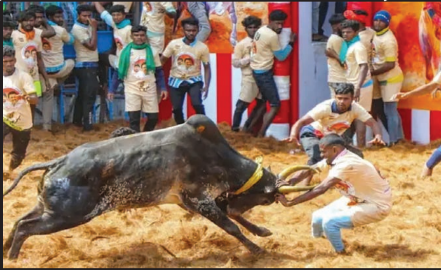
દર્શકો હતા, જ્યારે અન્ય બે લોકો મધ્ય જિલ્લાઓમાં અલગ-અલગ જદીકડુ ઈવેન્ટમાં મૃત્યુ પામ્યા હતા. કુષ્પાગિરી જિલ્લાના બસથલાપહી ખાતે યોજાયેલી આખલાની સ્પર્ધા એચ્યુ વીદુમ વિકાસમાં ૩૦ વર્ષથી વ્યક્તિનું મૃત્યુ થયું હતું, જ્યારે સાલેમ જિલ્લાના સેથારાપટ્ટી ખાતે આયોજિત જદીકડુ ખાતે

આયોજકોએ ૬૩૮ બુલ્સ અને ૨૩૨ બુલ ટ્રેનર્સને ભાગ લેવાની મંજૂરી આપી : ૨૫ દર્શકો, ૨૧ બળદ પ્રશિક્ષકો અને ૧૦ બળદના માલિકો સહિત ૫૬ લોકોને ઈજા થઈ