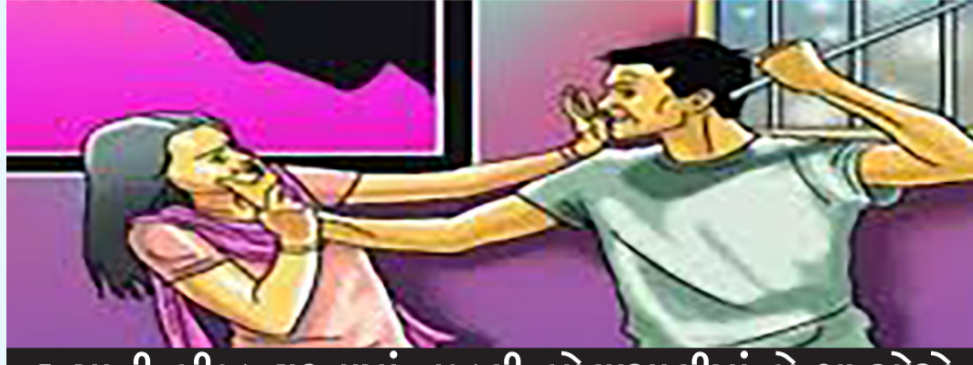
હત્યાની બીજી ઘટનામાં નજીવી બોલાચાલીમાં બે શખ્સોએ ત્રણ યુવાને છરીના ધા ઝીંક્યા: એકની લોથ ઢાળી