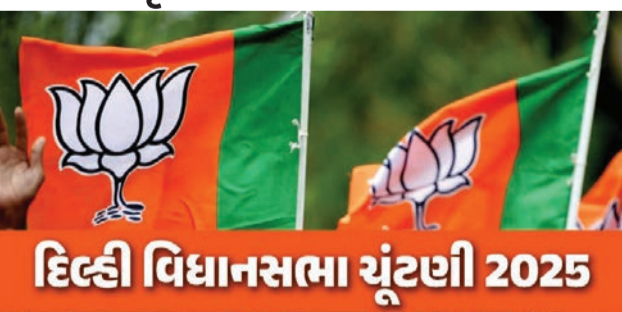
દિલ્હી વિધાનસભા ચૂંટણી ૨૦૨૫

મહિલા સમૃદ્ધિ યોજના હેઠળ મહિલાઓને દર મહિને ૨૫૦૦ રૂપિયા આપવાનું વચન