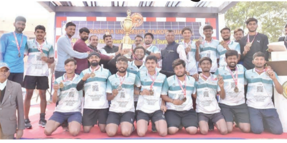
સમગ્ર ભારતની ૭૦ યુનિવર્સિટીઓએ ભાગ લીધો એમાં સૌરાષ્ટ્ર યુનિવર્સિટી ચેમ્પિયન બની