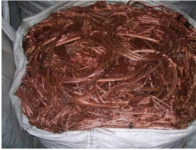
રાજકોટ મિરર, તા.૧૯ શહેરમાં આજે જુદી જુદી બે જગ્યાએ ત્રાટકેલા તસ્કરો રૂ.૨.૯૫ લાખનો કેબલ વાયર ચોરી ગયાની તાલુકા પોલીસ અને કુવાડવા રોડ પોલીસમાં ફરિયાદો નોંધવાઈ છે.