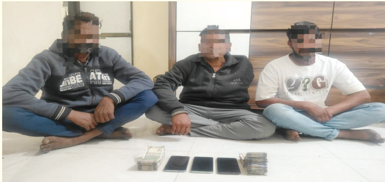
ઉપયોગ કરાયો હતો.