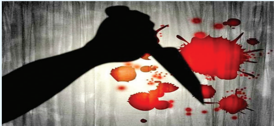
હત્યાની બીજી ઘટનામાં જુના ઝઘડાને લીધે બાવીસ વર્ષના યુવાને છરીના ધા ઝીંકી પતાવી દેવાયો