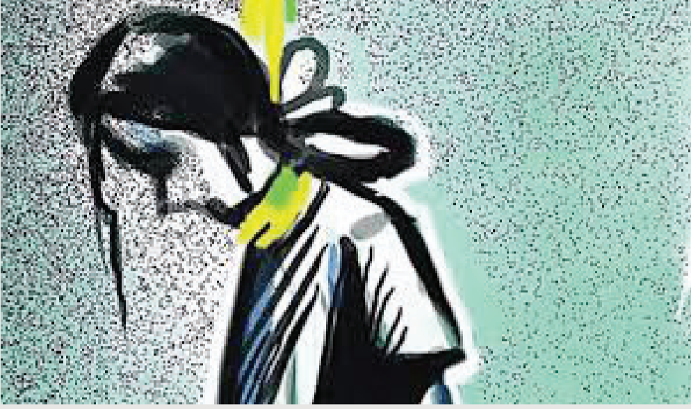
અન્ય બે બનાવમાં બેભાન હાલતમાં રાજદિપ સોસાયટીના આધેડનું અને ઘરમાં પડી જતાં સિત્તેર વર્ષના વૃદ્ધનું મોત થયું

રાજકોટ: અલગ અલગ કારણોસર લોકો કાયમને માટે દુનિયામાંથી વસમી વિદાય લઈ લેતાં હોય છે. તેમના આવા પગલા તેમના સ્વજનોને શોકની ગર્તામાં ધકેલી જતાં હોય છે. આ પ્રકારની ઘટનાઓ રોજબરોજ બનતી રહે છે. ઘણીવાર વિદ્યાર્થીઓ પણ ભણતરના ભારને કારણે કે પછી અંગત કારણોસર આત્મઘાતી પગલા ભરી લેતાં હોય છે. આવી વધુ એક ઘટના ચોંકાવી ગઈ છે. જેમાં સોળ વર્ષની વિદ્યાર્થીનીએ ગળાફાંસો ખાઈ મોત મીઠું કરી લીધું છે. રાજકોટ તાલુકાના સરદાર ગામે બનેલા આ બનાવથી ચકચાર મચી ગઈ છે. સરદાર ગામે રહેતી આ છાત્રા અગીયારમા ધોરણમાં અભ્યાસ કરતી હતી. તેણીએ આ અંતિમ પગલુ શા માટે ભર્યું? તે અંગે પરિવારજનો વિગત જાણતાં ન હોઈ પોલીસે કારણ જાણવા તપાસનો ધમધમાટ યથાવત રાખ્યો છે. નાનો ભાઈ બહારથી ઘરે આવ્યો ત્યારે જે દ્રશ્ય જોયું તેનાથી તે ડચાઈ ગયો હતો.