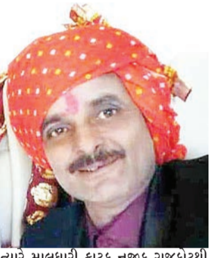
કેરી વાહનના ચાલક વિદ્યુત્ ગુનો નોંધ્યો હતો.

રાજકોટ: વાહન અકસ્માતની ઘાત વધુ એક પરિવારને નડી જતાં મોબીને ગુમાવી દીધા છે. શહેરના ગોંડલ રોડ પર માલધારી ફાટક પાસે ગોંડલ તરફ જતાં સર્વિસ રોડ પર કેરી નામના મા-લવાહક વાહનના ચાલકે મોટરસાઈકલને ઉલાળી દેતાં મવડી કણકોટ રોડ પર રહેતાં કારખાનેદારનું ગંભીર ઈજા થતાં મૃત્યુ થતાં પરિવારમાં ગમગીની વ્યાપી ગઈ હતી. તેઓ મિત્રના કારખાનેથી ઘરે જવા નીકળ્યા ત્યારે આ બનાવ બન્યો હતો. ટોળુ જોઈ પાછળ આવી રહેલા મિત્ર શું થયું? તે જોવા જતાં તેમના જ મિત્રને અકસ્માત નડવાની જાણ થતાં તેઓ આઘાતમાં મુકાઈ ગયા હતાં.