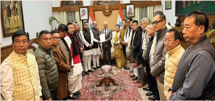
નવીદિલ્હી, તા. ૯

રાજીનામા પત્રમાં મુખ્યમંત્રીએ લખ્યું, અત્યાર સુધી મણિપુરના લોકોની સેવા કરવી એ સન્માનની વાત છે. હું કેન્દ્ર સરકારનો ખૂબ જ આભારી છું