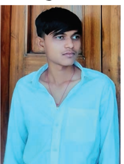
જઈ ઝેર પી લેતાં સારવાર માટે રાજકોટ

રાજકોટ: આપઘાતની ઘટનાઓ વચ્ચે વધુ એક પરિવારના આશરપદ અને યુવાન દિકરાએ અકળ કારણોસર દુનિયા છોડી દીધી છે. ઘરેથી પોતે ચોટીલા દર્શન કરવા જાય છે તેમ કહીને નીકળ્યા બાદ પોતાની વાડી નજીક વોંકળામાં જઈ ઝેરી દવા ગટગટાવી લીધી હતી અને દુનિયામાંથી વિદાય લઈ લીધી હતી.