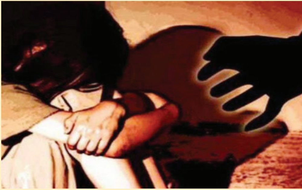
જુનાગઢ પરિક્રમામાં બાળાને આ ઢગાએ ફોન નંબર આપી પછી મિત્રતા અને પ્રેમજાળમાં લપેટી હતી: બાળાને પછી ખબર પડી કે આ શખ્સ ઢંગનો કામધંધો પણ કરતો નથી અને ઘરમાંથી પણ કાઢી મુકાયો છે!

રાજકોટ: ગમે તેની સાથે ફોન નંબરની આપ-લે કરીને કે પછી મિત્રતા કરી આગળ વધતા પહેલા સગીરાઓએ ચેતી જવા જવું છે. આ વાતની પ્રતીતિ કરાવતી વધુ એક ચોકડીવાસી ઘટના સામે આવી છે. જુનાગઢ પરિક્રમા કરવા પરિવાર સાથે ગયેલી બાળાને વિછીયા પંથકના ઢગાએ ફોન નંબર આપી વાતોનો સિલસિલો ચાલુ કરી તેણીને મોહજાળમાં ફસાવી લીધા બાદ રાજકોટથી છએક દિવસ પહેલા અપહરણ કરી લીધુ હતું અને દૂષ્કર્મ પણ આચરી લીધુ હતું. બાળાનું અપહરણ થયું પછી તેને ખબર પડી હતી કે આ શખ્સ કોઈ ઢંગનો કામધંધો પણ કરતો નથી અને ઘરમાંથી પણ તેને કાઢી મુકાયો છે! યુનિવર્સિટી પોલીસે આ ઢગાને દબોચી લઈ સગીરાને મુક્ત કરાવી હતી.