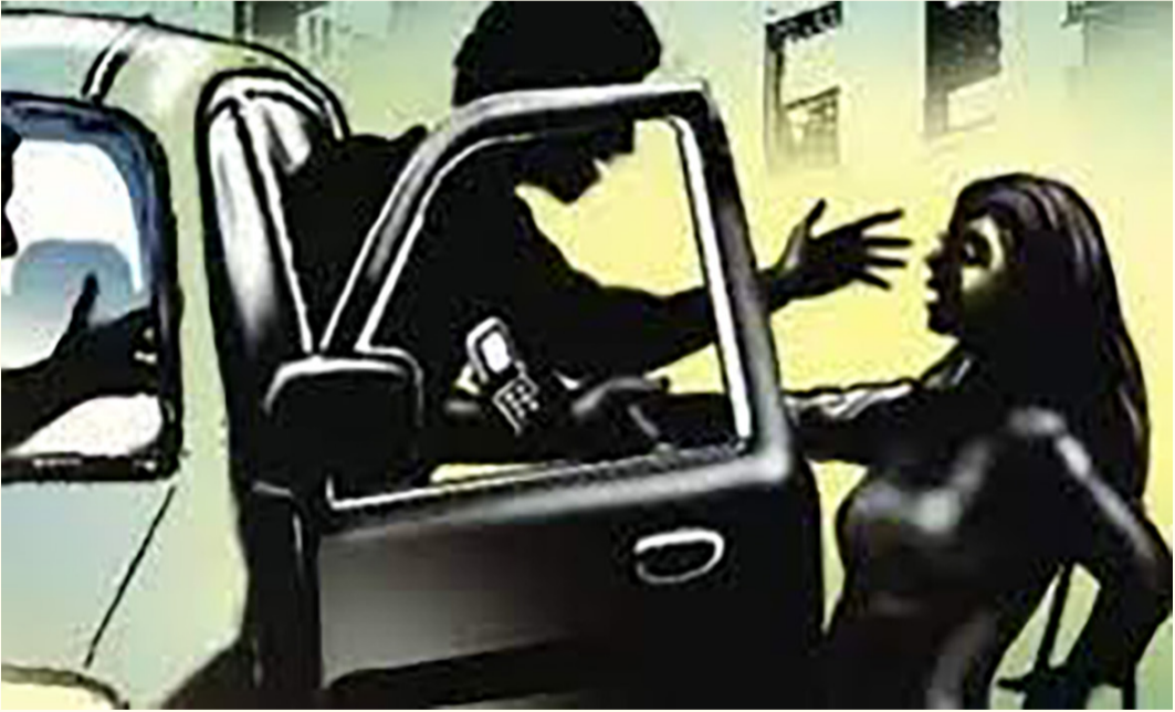
બગીચામાં સગીરો વચ્ચે પરિચય થયો, સ્નેપચેટથી વાત શરૂ થઈ પછી કહાનીમાં એવો ખતરનાક ટ્વિસ્ટ આવ્યો જેણે સગીરને ગંભીર ગુનાનો આરોપી બનાવી દીધો

દર્શનસિંહ જાડેજા દ્વારા રાજકોટ મિરર, તા. ૧૫ રાજકોટ: ઈન્ટરનેટ અને સોશિયલ મિડીયાના યુગમાં આ માધ્યમનો બેકામ ઉપયોગ કરતાં સગીર-સગીરાઓ ઘણીવાર જાણતા અજાણતાં ન કરવાનું કરી બેસે છે અને તેની આ ભુલ તેને ગુનેગાર બનવા સુધી દોરી જાય છે. વધુ એક વખત સગીરની ગંભીર પ્રકારની ગુનાખોરી સામે આવી છે. જેમાં એક સગીર વિદ્યાર્થીએ સ્નેપચેટ મારફત સગીર વચની છાત્રા સાથે વાતચીત શરૂ કર્યા બાદ બે મિત્રોની મદદથી આ સગીરા-છાત્રાનું કાળા કાયવાળી ગાડીમાં અપહરણ કરી રૈયા રોડ નાયરા પંપ પાછળના રસ્તે લઈ જઈ પોતાના બે મિત્રોને નાસ્તો લેવાના બહાને ઉતારી મુકી સગીરા સાથે કારમાં જ બળાત્કાર ગુજારી લેતાં ચકચાર મચી ગઈ છે. ગાંધીગ્રામ પોલીસે આ સગીર છાત્ર અને તેના બે મિત્રો વિરૂધ્ધ અપહરણ, બળાત્કાર, પોક્સો પોક્સો હેકગ ગુનો દાખલ કરી તેને સંક્રાંતિમાં લેવાની કાર્યવાહી કરી હતી. સોશિયલ મિડીયા માધ્યમથી કંઈ રીતે ટીનેજર્સ, છાત્ર-છાત્રાઓ એક બીજાના સંપર્કમાં આવે છે અને પછી ક્યારેક આ આ પરિચયને આગળ વધારી ગુનાખોરી તરફ ડગલા માંડે છે તેની પ્રતીતિ કરાવતો કિસ્સો સામે આવ્યો છે. એક સગીર છાત્રા બગીચામાં નાની બહેન સાથે બેઠી હતી ત્યારે પોતાના મિત્રો સાથે એક સગીર છાત્ર પણ ત્યાં હોઈ તેણે સગીરા પાસે સ્નેપચેટ આઈડી-૧ માંગી બાદમાં ફેન્ડશીપ કરવાના બહાને ફોન નંબર માંગ્યા હતાં. પણ બાળા પાસે મોબાઈલ ન હોઈ બહેનપણીની આઈડી આપી હોઈ તેના મારફત વાતચીત શરૂ કર્યા બાદ અહિ કહાનીમાં