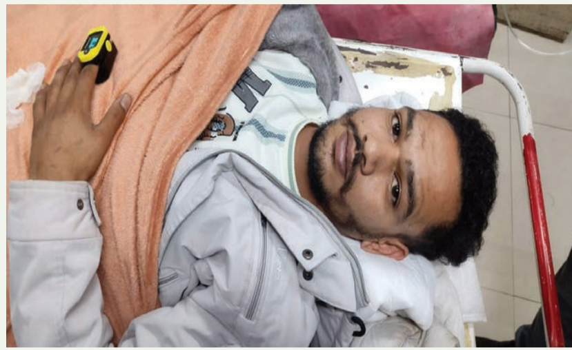
ફિલ્મી ઢબે શરૂ થયેલી ગેંગવોરમાં મોટો ભડકો થાય એ પહેલા પોલીસે બધાને ડામી દેવા જરૂરી