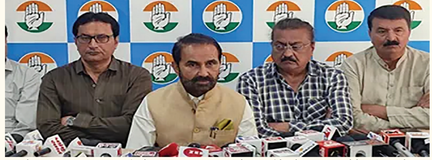
રાજકોટ, તા. ૧૫ ગઈકાલે રાજકોટમાં રાજ્યસભાના અને ગુજરાત પ્રદેશ કોંગ્રેસ સમિતિના પ્રમુખ શક્તિસિંહ ગોહિલ દ્વારા પત્રકાર પરિષદ સંબોધવામાં આવી હતી જેમાં તેઓએ જણાવ્યું હતું કે લોકશાહી વ્યવસ્થામાં ચૂંટણી એક પવિત્ર કાર્ય છે જ્યારે પવિત્રતા કાર્યમાં ન જળવાઈ તો તે કાર્ય કોઈ દિવસ દીપીનો ઊંઠે. વધુમાં તેઓએ ભાજપ પક્ષ પર આશંકા કરતા જણાવ્યું કે મુન્દ્રા-માં ભાજપના ઉમેદવાર સામે સાડા સાત લાખ આપી કોર્મ પાછા ખેંચી લે પેસાના

રાજકોટ ખાતે યોજાયેલી પત્રકાર પરિષદમાં ગુજરાત પ્રદેશ કોંગ્રેસ પ્રમુખ અને રાજ્યસભા સાંસદ શક્તિસિંહ ગોહિલે ભાજપ પર કર્યા શાબ્દિક પ્રહારો