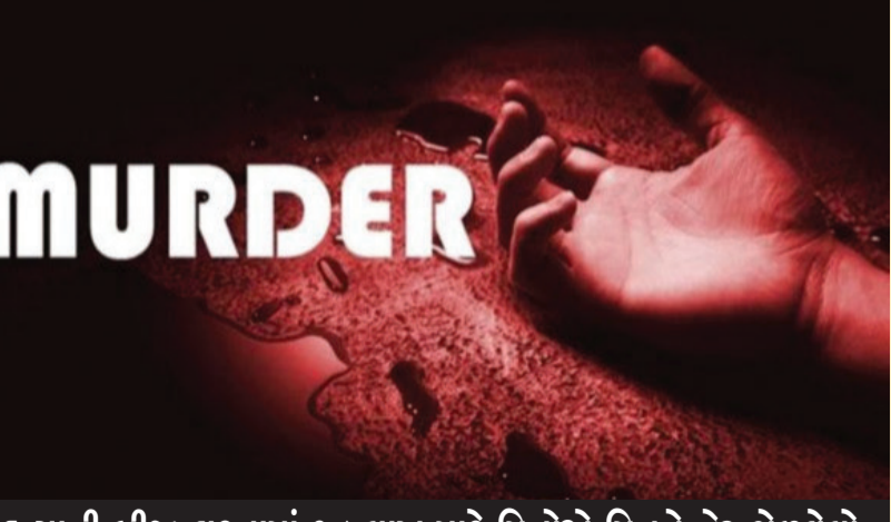
હત્યાની બીજી ઘટનામાં ૧૮ લાખ માટે મિત્રોએ મિત્રને ઝેર ભેળવેલો દારૂ પાઈ મોતને ઘાટ ઉતારી લાશ કેનાલમાં ફેંકી દીધી હતી: મર્ડર મિસ્ટ્રી