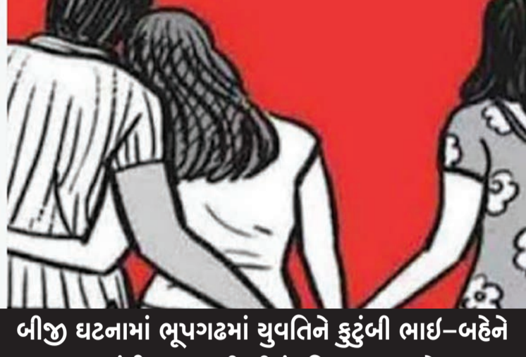
બીજી ઘટનામાં ભૂપગઢમાં યુવતિને કુટુંબી ભાઈ-બહેને મારકુટ કરતાં ફિનાઈલ પી લીધું: મિલકત બાબતે માથાકુટ

રાજકોટ: આડાબવળા સંબંધોમાં મોટે ભાગે ડખખા થતાં રહે છે. ઘણીવાર વાત મારામારી કે હલ્લા સુધી પણ પહોંચતી હોય છે. દરમિયાન શહેરના દૂધ સાગર રોડ પર રહેતી પરિણીતાના પતિને બીજી કોઈ મહિલા સાથે લક્ષ્મી હોઈ આ બંનેને આ મહિલાનો પતિ જોઈ જતાં બંનેને પોલીસ સ્ટેશને બોલાવવા હતાં. આ વખતે પરિણીતા ત્યાં જતાં તેણી પોલીસ સ્ટેશન બહાર બેઠી હોઈ પતિ અને પત્નિની પ્રેમિકાએ બહાર આવી ઝઘડો કરી પ્રેમિકાએ હું તારા ઘરવાળાને મુકવાની જ નથી કહી ધમકી આપી મારકુટ કરતાં આ પરિણીતાએ ફિનાઈલ પી આપવાનો પ્રયાસ કરતાં તેણીના પતિ અને પત્નિની પ્રેમિકા વિરુદ્ધ પોલીસે એફઆઈઆર દાખલ કરી હતી.