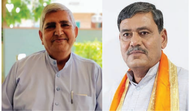
સાચું આશ્વાસન પણ આપ્યું. જેના પરિણામ સ્વરૂપે કુલ ૮૦ બેઠકમાંથી ભાજપને ૬૭ બેઠક મળી છે જે નાનીસુની વાત સહેજ પણ નથી.