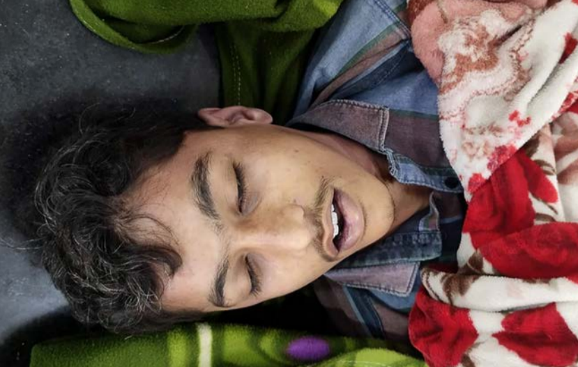
બીજી ઘટનામાં પતિએ દરજી કામને બદલે દિવ્યાંગ દિકરીની દેખરેખ રાખવાનું કહેતાં પતિને માઠુ લાગ્યું અને ફાંસો ખાઈ મોત મેળવ્યું

રાજકોટ: આત્મહત્યાની વધુ એક ઘટના બની છે જેમાં શહેરના ગોંડલ રોડ પર આવેલા બાળ સંરક્ષણ ગૃહ-બાળ સુધાર ગૃહમાં ભાવનગરના સગીરે નમાઝ પઢવાની યાદર બારીમાં બાંધી ગળાફાંસો ખાઈ જિંદગી ટુંકાવી લીધી હતી.