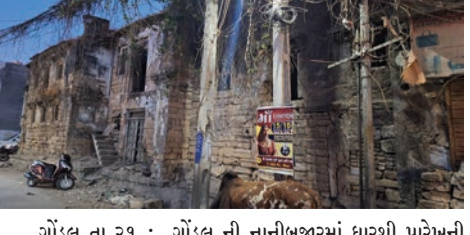
ગોંડલ તા.૨૧ : ગોંડલ ની નાનીબજારમાં ધારશી પારખેની શેરીની સામે અતિ જઈરિત થઈ ગયેલા અને બંધ હાલત માં રહેલા જુનવાણી મકાન કોઈ દુર્ઘટના સર્જે તે પહેલા તોડી પાડવા