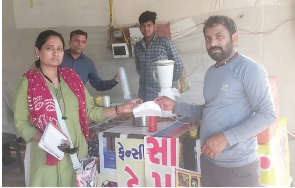
ગંદકી કરતા આસામી પાસેથી દંડ વસુલ કરવાની કામગીરી હાથ ધરવામાં આવી હતી. જેમાં કુલ ૨ દિવસ દરમિયાન ત્રણેય ઝોનમાંથી કુલ ૩૨ આસામીઓ પાસેથી ૨.૧૯

રાજકોટ, તા. ૨૧ કહેવાય ને કે નીબરતાની પણ હદ હોય રાજકોટના વેપારીઓ પર મહાનગરપાલિકા ની સોલિડ વેસ્ટ શાખા દ્વારા સતત પ્રતિબંધિત પ્લાસ્ટિકનો ઉપયોગ ન કરવા માટે સૂચિત કરવામાં આવે છે અને ખાસ ઝુંબેશ પણ હાથ ધરવામાં આવતી હોય છે પરંતુ હાલની સ્થિતિને ધ્યાને લઈ એ વાત તો સ્પષ્ટ થઈ ચૂકી છે કે વેપારીઓને એક પણ વાતનો ડર છે નહીં અને તેઓ પોતાની રીતે વેપાર કરવા માંગે છે હા તો સામે જે કડકાઈ વિભાગે દાખવવી જોઈ તે પણ જોવા મળતી નથી આટલી તીવ્ર ઝુંબેશ ચાલતી હોવા છતાં દરરોજ પ્રતિ દિવસ કિલોથી લઈ પાંચ કિલો સુધીના પ્લાસ્ટિક તપાસ દરમિયાન મળી આવે છે તેના પર અકુશ લાદવો ખૂબ જરૂરી છે