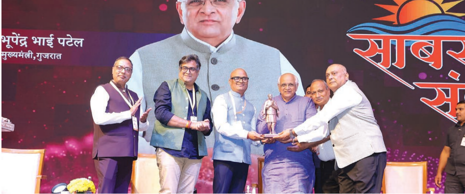
ભૂપેન્દ્ર ભાઈ પટેલ મુખ્યમંત્રી, ગુજરાત

મુખ્યમંત્રી ભૂપેન્દ્ર પટેલે પાંચજન્ય આયોજિત સાબરમતી સંવાદનું સમાપન કરાવતા પ્રસ્તુત કરી ગુજરાતના વૈશ્વિક વિકાસની પ્રભાવક ગાથા