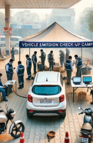
ઈંધણના ઉપયોગને પ્રોત્સાહન આપવા માટે આ પહેલ શરૂ કરવામાં