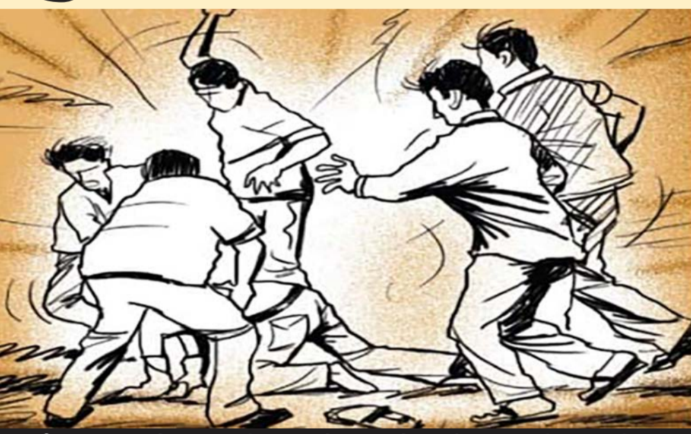
રિલાયન્સ મોલના બીજા માળે ફૂડ ઝોનમાં બધાડાટી: કટારીયા ચોકડી પાછળ રહેતાં યુવાન, તેની ભાણેજ, મિત્રો સાથે સામુ જોવા મામલે માથાકુટ: એટ્રોસીટી નોંધવામાં આવી

રાજકોટ: સોશિયલ મિડીયાનો સારો સાચ્યો ઉપયોગ ઘણા કરે છે. જો કે આનો દુરુપયોગ કરનારા પણ અનેક છે. દરમિયાન કટારીયા ચોકડી પાછળ ક્વાર્ટરમાં રહેતાં અને છુટક મજૂરી કરતાં યુવાનને ગત ડિસેમ્બરમાં રિલાયન્સ મોલમાં મામાના દિકરા, ભાણેજ, મિત્રો સાથે ગયેલ ત્યારે સામેના ટેબલમાં બેઠેલી યુવતિએ આ યુવાનને તમારા મિત્રો કેમ સામે જોવે છે? કહી ઝઘડો કરી માથાકુટ કરતાં અને બાદમાં પાર્કિંગમાં જઈ ફરીથી ઝઘડો કરી તમે મારું સોશિયલ મિડીયા નેટવર્ક જોયું છે? તમારી પથારી ફેરવી નાખીશ કહી બીજા શખ્સો સાથે મળી ફરી મારકુટ કરી જ્ઞાતિ પ્રત્યે અપમાનીત કરતાં ફરિયાદ દાખલ થઈ છે.