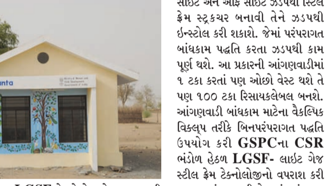
રાજકોટ મિસ્ત્ર, તા. ૬ આજનું બાળક આવતીકાલનું ભવિષ્ય છે અને તેના જીવન ઘડતરનો મજબૂત પાયો નાખવાનું કામ આંગણવાડી કેન્દ્રો કરે છે. દેશનું ભવિષ્ય જ્યાંથી નિર્માણ પામે છે, તેવા આંગણવાડી કેન્દ્રોને મુખ્યમંત્રી શ્રી ભૂપેન્દ્ર પટેલના માર્ગદર્શનમાં ઈકોફ્રેન્ડલી બનાવીને પાયાની તમામ સુવિધાઓથી સુસજ્જ કરાવવા રાજ્ય સરકાર કટોબદ છે. બાળકોના ઘડતરમાં કોઈપણ પ્રકારની ક્યાસ ન રહે તે માટે રાજ્ય સરકાર નિરંતર પ્રયાસ કરી રહી છે, તેના પરિણામે મહિલા અને બાળ કલ્યાણ મંત્રી શ્રી ભાનુબેન બાબરીયાએ રાજ્યમાં બિનપરંપરાગત પદ્ધતિનો ઉપયોગ કરી GSPCના CSR ભંડોળ હેઠળ LGSF- લાઇટ ગેજ સ્ટીલ ફ્રેમ જેવી અદ્યતન ટેકનોલોજીને માધ્યમથી ૬૦૭ જેટલા આંગણવાડી કેન્દ્રો અને નંદનવર બનાવવાની જાહેરાત કરી છે. લાઇટ ગેજ સ્ટીલ ફ્રેમ

રાજકોટ, તા. ૬ આજનું બાળક આવતીકાલનું ભવિષ્ય છે અને તેના જીવન ઘડતરનો મજબૂત પાયો નાખવાનું કામ આંગણવાડી કેન્દ્રો કરે છે. દેશનું ભવિષ્ય જ્યાંથી નિર્માણ પામે છે, તેવા આંગણવાડી કેન્દ્રોને મુખ્યમંત્રી શ્રી ભૂપેન્દ્ર પટેલના માર્ગદર્શનમાં ઈકોફ્રેન્ડલી બનાવીને પાયાની તમામ સુવિધાઓથી સુસજ્જ કરાવવા રાજ્ય સરકાર કટોબદ છે. બાળકોના ઘડતરમાં કોઈપણ પ્રકારની ક્યાસ ન રહે તે માટે રાજ્ય સરકાર નિરંતર પ્રયાસ કરી રહી છે, તેના પરિણામે મહિલા અને બાળ કલ્યાણ મંત્રી શ્રી ભાનુબેન બાબરીયાએ રાજ્યમાં બિનપરંપરાગત પદ્ધતિનો ઉપયોગ કરી GSPCના CSR ભંડોળ હેઠળ LGSF- લાઇટ ગેજ સ્ટીલ ફ્રેમ જેવી અદ્યતન ટેકનોલોજીને માધ્યમથી ૬૦૭ જેટલા આંગણવાડી કેન્દ્રો અને નંદનવર બનાવવાની જાહેરાત કરી છે. લાઇટ ગેજ સ્ટીલ ફ્રેમ