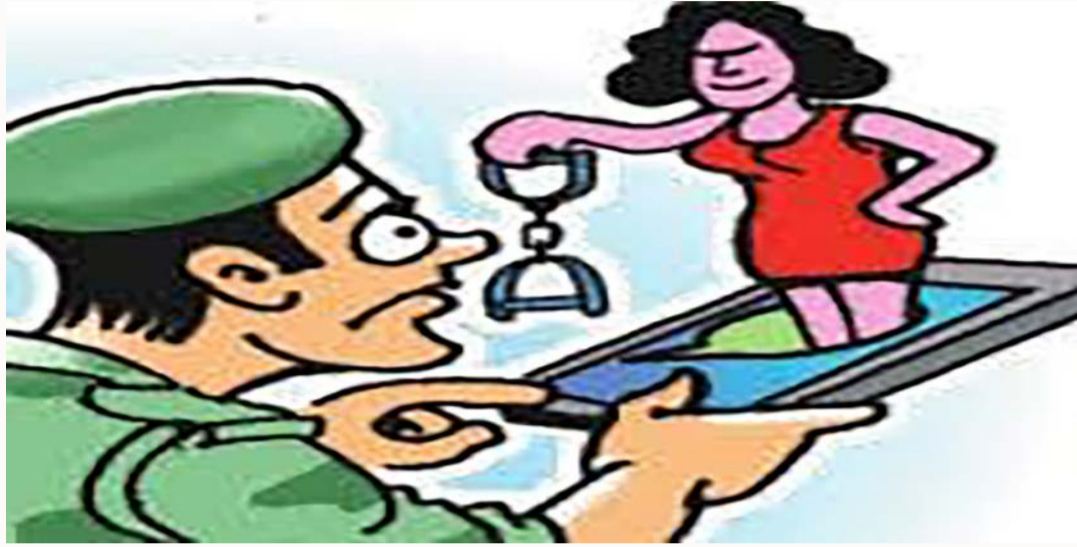
હવસખોરીની એક ઘટનામાં ૧૪ વર્ષના છાત્રને મિત્રના પરિચીતે શિકાર બનાવી દુષ્કર્મ આચર્યું: વિડીયો ઉતારી બ્લેકમેઇલ કરી વારંવાર શોષણ