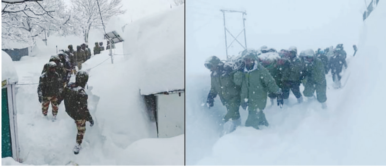
રાજકોટ, તા. ૧

ચાર શ્રમિકોના મોત, રેસ્ક્યૂ ઓપરેશન હજુ પાછા ચાલુ