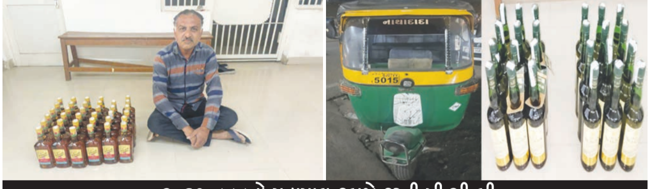
૩.૯૦,૮૮૮નો મુદ્દામલ કબજે કરતી પી.સી.બી

રાજકોટ મિરર તા.૨ શહેરમાં પી.સી.બી પોલીસે જુદા જુદા બે સ્થળોએ દરોડો પાડી દાઝની ૬૪ બોટલ કબજે કરી ૩.૯૦,૮૮૮ના મુદ્દામલ સાથે પકડી રીક્ષા ચાલકની શોધખોળ આદરી છે. પીસીબી પોલીસે દાઝના બે દરોડા દરમિયાન ૩.૯૦,૮૮૮ની દાઝની ૬૪ બોટલ કબજે કરી એકને ઝડપી લઈ બીજા રીક્ષાચાલકની શોધખોળ આદરી છે. પી.સી.બી. પી.આઈ. એમ.આર.ગોંડલિયાના માર્ગદર્શન પ્રમાણે પી.સી.બી.ના પી.એસ.આઈ