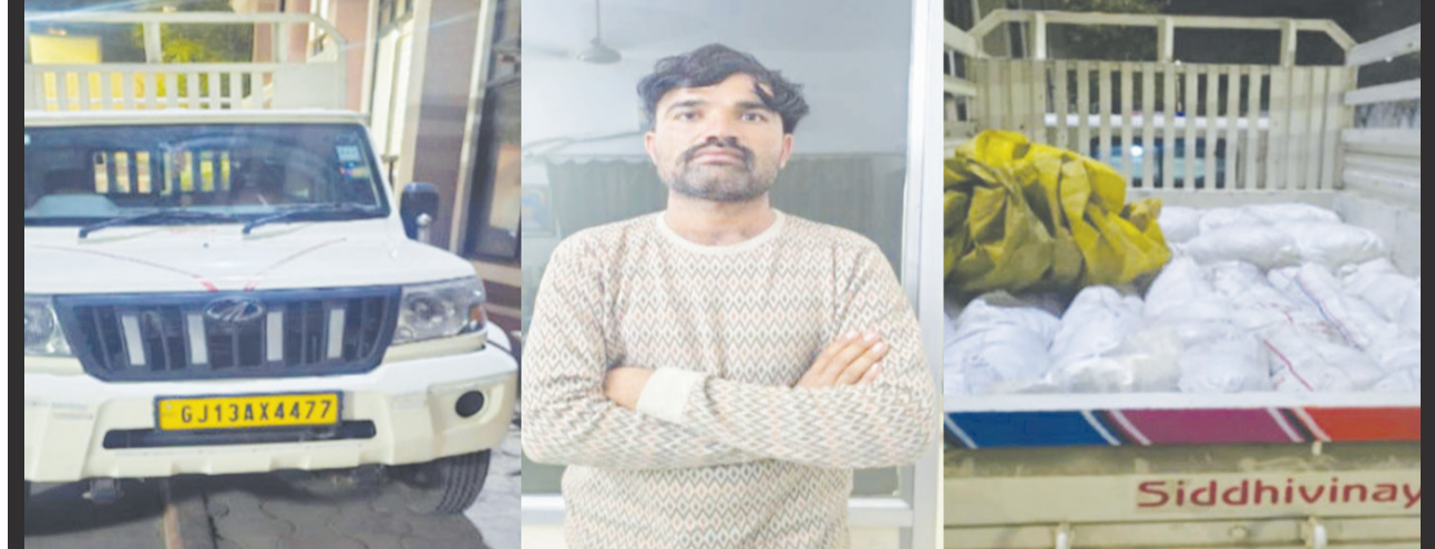
બોલેરો સહીત રૂ.૭,૨૦,૦૦૦નો મુદ્દામાલ કબજે કરતી પી.સી.બી