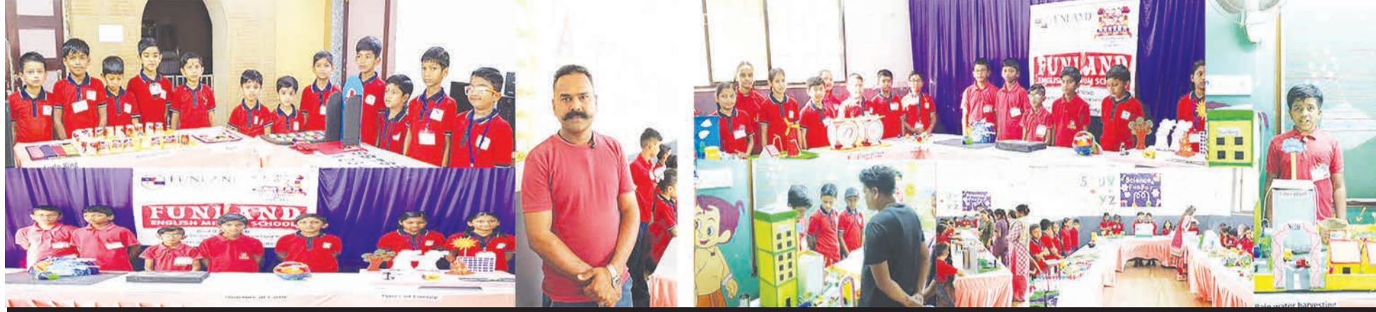
૧૦૦ બાળકોએ જોડાઈને ૨૫થી વધુ રજૂ કરેલા પ્રોજેક્ટ્સથી વાલીઓ-શિક્ષકગણ અભિભૂત

રાજકોટ ૨૨, તા.૨ શહેરના ભોમશ્વર વિસ્તારમાં આવેલ ફનલેન્ડ સ્કૂલમાં વિજ્ઞાન