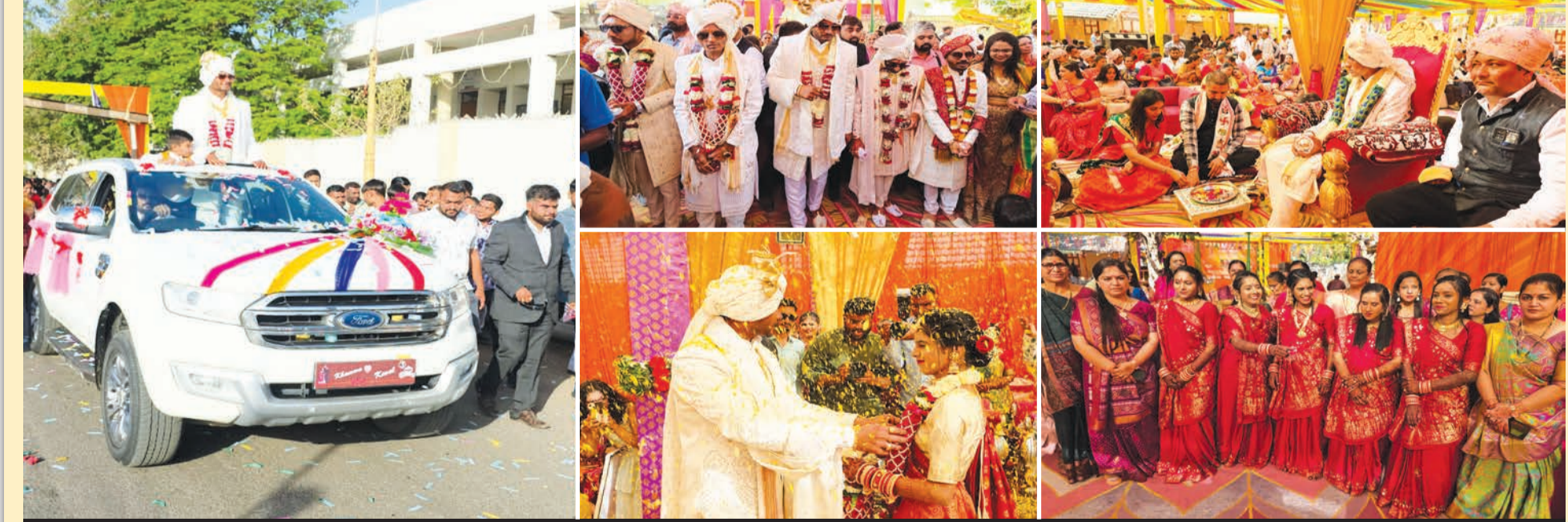
દિકરીઓનાં કન્યાદાન ઉદ્યોગપતિઓએ આપ્યા: નગરજનોએ ભીની આંખે દિકરીઓને વળાવી