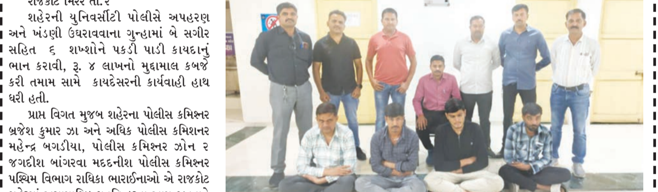
૩.૪ લાખનો મુદ્દામલ કબજે કરતી યુની. પોલીસ