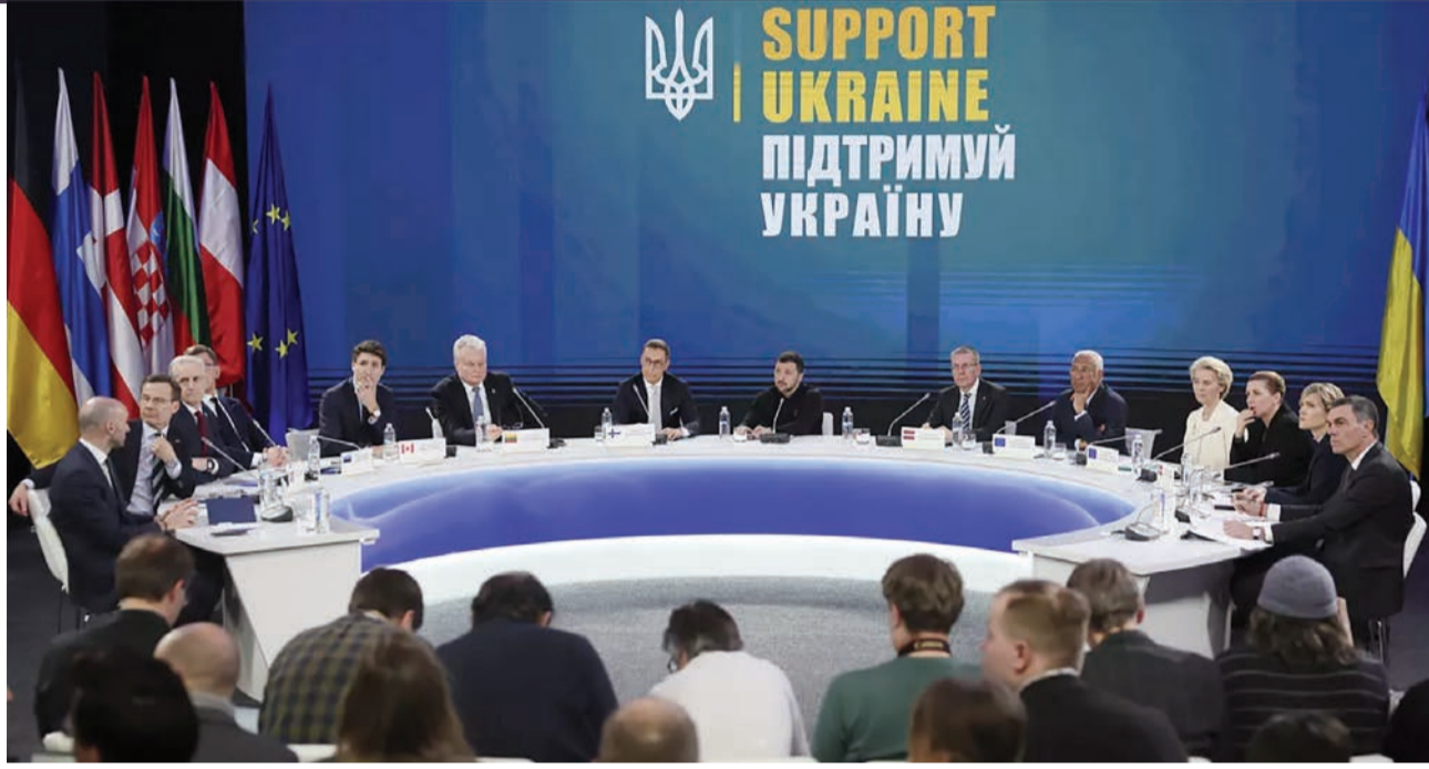
પ્રિન્સ ચાર્લ્સ અને યુરોપના નેતાઓએ સહાય આપવા સહમતિ સાધી

હેવે યુરોપ ફરી થઈ રહ્યું છે એક જુઠ "યુકેન પર રશિયાના ઘાતકી આક્રમણના ત્રણ વર્ષ પછી, અમે એક નિર્ણાયક તબક્કે છીએ. યુકેન માટેના અમારા અડીખમ સમર્થનની પુનઃપુષ્ટિ કરીશ અને યુકેનને ક્ષમતા, તાલીમ અને સહાય પૂરી પાડવાની અમારી પ્રતિબદ્ધતાને બમણી કરીશ અને તેને શક્ય તેટલી મજબૂત સ્થિતિમાં બનાવવામાં મદદ કરીશ, સ્ટારમરે લંડન સમિટ પહેલા એક નિવેદનમાં જણાવ્યું હતું. અમારા સાથીઓ સાથે ભાગીદારીમાં, અમે યુનાઈટેડ સ્ટેટ્સ સાથે સતત ચર્ચાઓ સાથે સુરક્ષા ગેરંટીઓના યુરોપિયન તત્વ માટે અમારી તૈયારીઓને વધુ તીવ્ર બનાવવી જોઈએ," તેમણે કહ્યું. "હેવે સમય છે કે આપણે યુકેન માટે શ્રેષ્ઠ પરિણામની બાંધધરી આપવા, યુરોપિયન સુરક્ષાને સુરક્ષિત કરવા અને આપણા સામૂહિક ભવિષ્યને સુરક્ષિત કરવા માટે એક થવાનો સમય છે." પહેલાના તમાશોએ યુરોપને આંધકો આપ્યો હશે અને કેમલિને ખુશ કર્યા હશે. તે રવિવારની સમિટમાં તીવ્રતા ઉમેરે છે, જે શરૂઆતમાં ગયા સપ્તાહના અંતે પેરિસમાં સમાન મીટિંગ દરમિયાન પ્રાપ્ત થયેલી પ્રગતિ પર બિલ્ડ કરવા માટે સ્ટારમર દ્વારા ખોલાવવામાં આવી હતી. કેંકસના એક દિવસ પહેલા, મેચીપૂર્ણ સ્ટારમરે ટ્રમ્પને અગાઉના પોટા નિવેદનોને પાછું ખેંચવા સમજાવ્યા કે ઝેલેન્સ્કી "સરમુખત્યાર" છે, યુકેનના નેતા માટે તેમનો "આદર" વ્યક્ત કર્યો અને યુકેન યુદ્ધવિરામ કરારમાં રશિયા પાસેથી કબજે કરેલ પ્રદેશ પાછો લેશે તેવી શક્યતા પણ ઉભી કરી. આ તમામ દિપ્લોમીઓ ટ્રમ્પના નોંધપાત્ર વિપરીત હતા, અને ઝેલેન્સ્કીની મુલાકાત માટે સારી રીતે સ્થિત હોવાનું જણાયું છે.