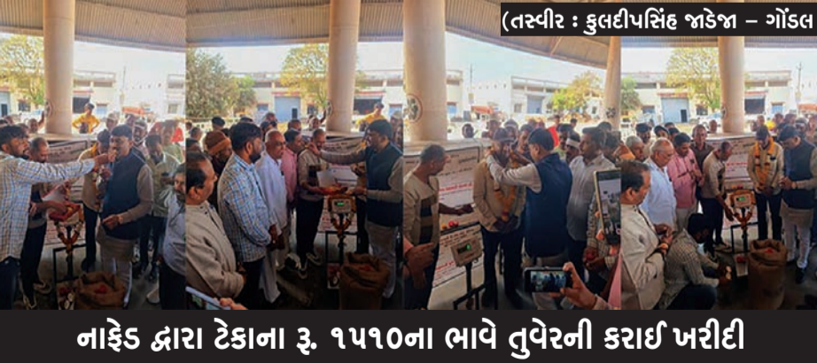
નાફેડ દ્વારા ટેકાના રૂ. ૧૫૧૦ના ભાવે તુવેરની કાર્યા ખરીદી

રાજકોટ મિરર, ગોંડલ, તા. ૩ સૌરાષ્ટ્ર ગુજરાતનું અગ્રીમ ગણાતું ગોંડલ માર્કેટિંગ ચાર્ડ ખાતે આજથી ટેકાના ભાવે તુવેરની ખરીદી કેન્દ્રનો પ્રારંભ થયો છે. જામવાડી સહકારી મંડળીના નેજા હેઠળ નાફેડ દ્વારા ટેકાના ભાવે તુવેરની ગોંડલ તાલુકાનું પ્રથમ કેન્દ્રની શરૂઆત કરવામાં આવી હતી. ગોંડલ તાલુકાના ૪૫૦૦ ખેડૂતોનું રજીસ્ટ્રેશન કરવામાં આવ્યું છે. આજરોજ પ્રથમ ૧૦૦ ખેડૂતોને બોલાવવામાં આવ્યા હતા જેમાં ૨૦ ખેડૂતો ટેકાના ભાવે તુવેર વેચવા માટે ગોંડલ ચાર્ડ ખાતે શરૂ કરેલ કેન્દ્ર પર