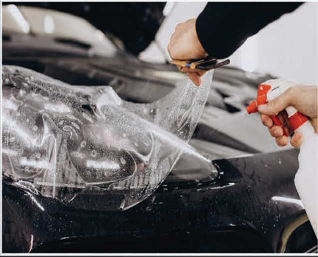
Paint Protection Film