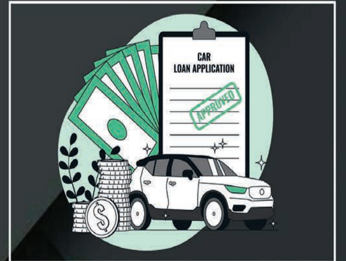
Loan & Insurance