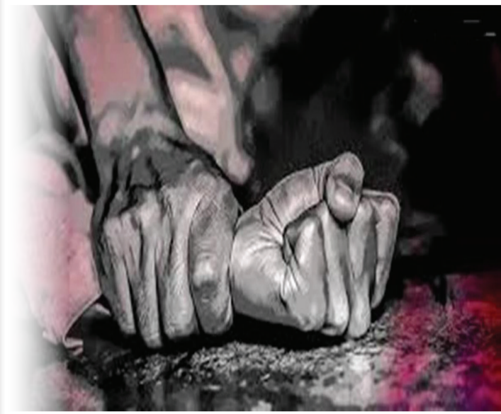
બીજી ઘટનામાં શેમ્પુ લેવા નીકળેલી બાળાની આબરૂ લૂંટવાનો પ્રયાસ: દેકારો સાંભળી પિતા દોડી ગયા અને પુત્રીને શિકાર થતી બચાવી લીધી

એસી વર્ષના ડોસીમાએ રાડારાડી કરી મુકતાં પુત્રવધૂ, પડોશીઓએ છોડાવ્યા: ગુપ્તાંગમાં ઈજાઓ થતાં સારવારમાં ખસેડાયા: પોલીસે ૫૦ વર્ષના હવસખોર હેવાન દિકરાને પકડી લીધો