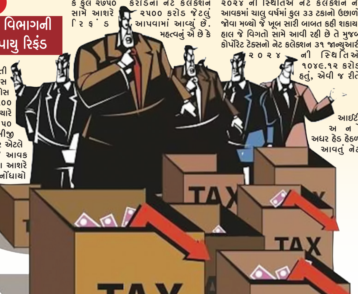
આઈટી અને અધર હેડ હેડન આવતું નેટ

રેગ્યુલર એસેસમેન્ટ હેડન ગત નાણાકીય વર્ષમાં ૧૦૧.૮૭ કરોડ જેટલું નેટ કલેક્શન થયું હતું જે ચાલુ નાણાકીય વર્ષમાં ૧૪૦ કરોડથી વધુનું છે અને તેમાં આશરે ૩૮.૯૬ ટકા જેટલી વૃદ્ધિ જોવા મળી છે. હાલની સ્થિતિને ધ્યાને લઈ જે રીતે રિકવરી ઝુંબેશ હાથ ધરવામાં આવી રહી છે તેને ધ્યાને લેતા આગામી દિવસમાં જે આવકવેરા વિભાગનો ટાર્ગેટ બોર્ડ દ્વારા આપવામાં આવ્યો હતો તેની નજીક પહોંચવા માટે દરેક સંભવત પ્રયત્નો હાલ હાથ ધરવામાં આવી રહ્યા છે.