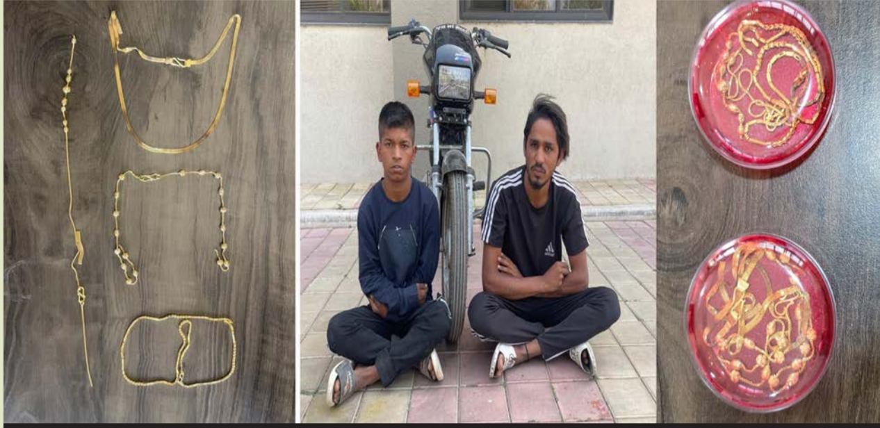
કાઈમ બ્રાંચે બંનેને દબોચી સોનાની માળા, ત્રણ ચેઈન, એક ચેઈનનો ટૂકડો, બાઈક, એપલ ફોન કબ્જે કર્યા: એક શખ્સની અગાઉ સાત ગુનામાં સંડોવણી: મોજશોખ માટે ચિલકડપ કરતાં: જો કે ચેઈન વેંચે એ પહેલા પકડી લેવાયા

રાજકોટ: શહેરને છેલા એક મહિનાથી કાઈમ બ્રાંચને સફળતા મળી છે. એક મહિનામાં વૃધ્ધાઓના ગળામાંથી સોનાના ચેઈન, માળાની ધમરોળતી ચીલકડપકાર બેલડીને ઝડપી લેવામાં આ બંને શખ્સોએ આઠ યુવતિ, મહિલા, ચીલકડપ કરી હતી. બંને સાંજના સાતથી