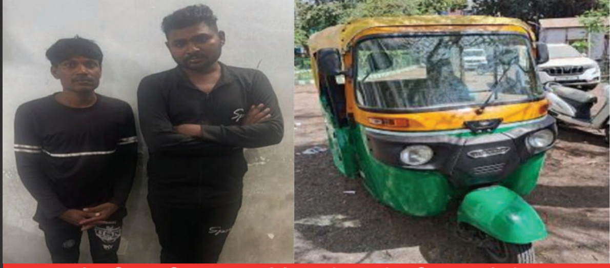
બે મહિલા સહિત ચાર શખ્શોને પકડી પાડતી ભક્તિનગર પોલીસ

રાજકોટ મિરર તા.૪ શહેરના કોઠારીયા રોડ પર રિક્ષામાં પેસેન્જરને બેસાડી ખિસ્સામાંથી રોકડા રૂપિયા અને મોબાઇલ ફોન સેરવી લેતી ટોળકીને ભક્તિનગર પોલીસે પકડી પાડી કાર્યવાહી હાથ ધરી છે.