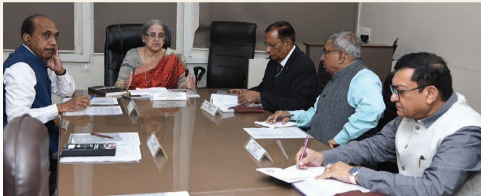
જોઈએ. તમામ લગ્ન અને છૂટાછેડાની નોંધણી એ એકમાત્ર આવશ્યકતા છે, અને છૂટાછેડા કાયદા મુજબ થવા જોઈએ, તેમણે ઉમેર્યું હતું કે વારસા અને લિવ-ઇન સંબંધો અંગેના રજૂઆત કરીશું. તે યુ.સી.સી.ના સંદર્ભમાં

રાજકોટ, તા. ૪ યુનિફોર્મ સિવિલ કોડ (યુસીસી) ના મુદ્દા માટે ગુજરાત સરકાર દ્વારા સ્થાપનામાં આવેલી ઉચ્ચ સ્તરીય સમિતિ જાહેર પ્રાર્થના કરશે અને મહિલાઓ અને બાળ સંભાળના સમાન અધિકારો પર ધ્યાન કેન્દ્રિત કરશે, તેના અધ્યક્ષ જસ્ટિસ (નિવૃત્ત) રંજના દેસાઈએ મંગળવારે જણાવ્યું હતું. પાંચ સભ્યોની UCC સમિતિએ રાજ્યની રાજધાનીમાં ગુજરાતમાં તેની પ્રથમ બેઠક યોજી હતી, જ્યાં ન્યાયમૂર્તિ દેસાઈએ જાહેર જનતા, સરકારી એજન્સીઓ, NGO, સામાજિક જૂથો પાસેથી ગઈઠિ વિશે સૂચનો મેળવવા માટે www.uccgujarat.in નામનું વેબ પોર્ટલ શરૂ કર્યું હતું. અમારું કામ આજથી શરૂ થાય છે. સમિતિને ગુજરાતમાં UCCની જરૂરિયાતનું મૂલ્યાંકન કરવાની કામગીરી સોંપવામાં આવી છે. અમે આ ક્વાયટ પછી ડ્રાફ્ટ લઈને આવીશું અને અમે તેના માટે જાહેર પ્રાર્થના કરીશું, સુપ્રીમ કોર્ટના ભૂતપૂર્વ ન્યાયાધીશ પત્રકારોને જણાવ્યું હતું. તેમણે કહ્યું કે જાહેર સલાહ એ ક્વાયટનો એક મહત્વપૂર્ણ ભાગ છે