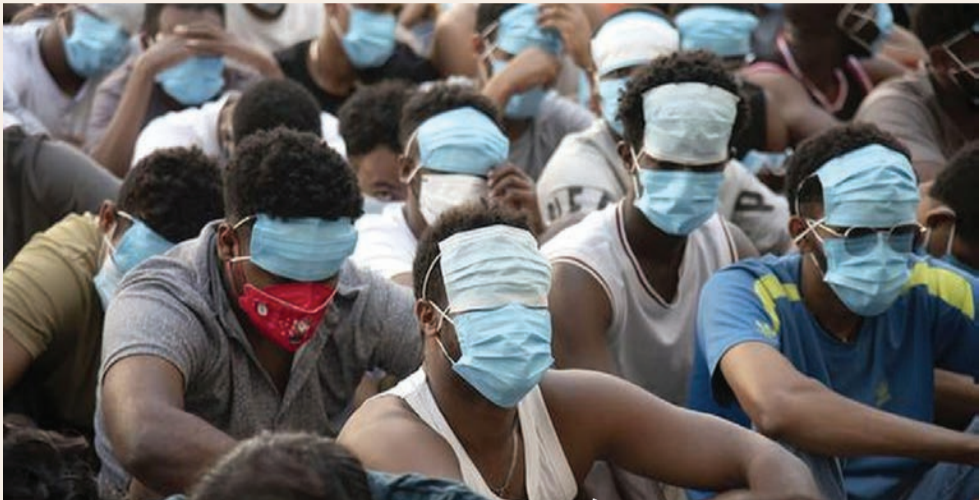
ગેરકાયદે આનલાઇન છેતરપિંડી કૌભાંડનો પર્દાફાશ : બે ડઝન દેશોના આશરે ૭૦૦૦ કામદારોને કરાવ્યા છે મુક્ત

નવીદિલ્હી, તા. ૧૦ રાજ્યના અધિકારીઓએ જણાવ્યું હતું કે ગેરકાયદેસર આનલાઇન છેતરપિંડી કામગીરીને બંધ કરવાના પ્રયાસોના ભાગરૂપે મ્યાનમારમાં છેતરપિંડી કેન્દ્રોમાંથી મુક્ત થયા બાદ સોમવારે લગભગ ૩૦૦ ભારતીયો યાઇલેન્ડ થઈને ઘરે પરત ફર્યા હતા. મ્યાનમારના સત્તાવાળાઓએ, સાથી ચીનના દબાણ હેઠળ, તાજેતરના અકબચાઈમાં દેશના કાયદાવિહીન સરહદી વિસ્તારોમાં ઉછળતા છેતરપિંડીના આશ્રયસ્થાનો પર કાર્યવાહી કરી છે. ઓછામાં ઓછા બે ડઝન દેશોના લગભગ ૭,૦૦૦ કામદારોને મુક્ત કરવામાં આવ્યા છે, જેમાંથી મોટાભાગના ચીની છે, પરંતુ ઘણા મ્યાનમાર-થાઈ સરહદ પર અસ્થાયી અટકાયત શિબિરોમાં નબળી સ્થિતિમાં જીવે છે.