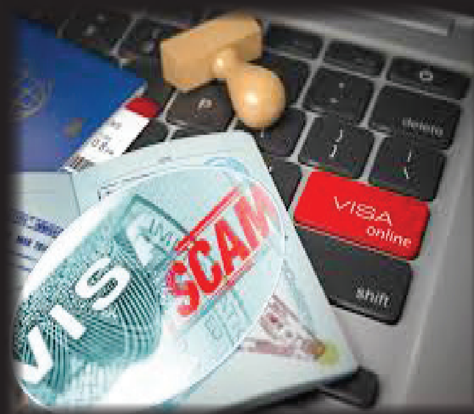
બીજા બનાવમાં કાપડના વેપારીને છેતરીને સવા છ લાખનો ચૂનો લગાવી દીધો દિલ્હીના ઠગે