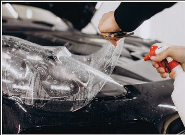
Paint Protection Film