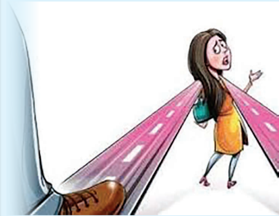
રાજકોટ: રંગીલા મોજલા રાજકોટ સ્ટેશનની હવા ખાવાની નોબત આવી જતી શહેરમાં ઘણીવાર અમુક છોકરાવ ન હોય છે. આવા જ એક બનાવમાં એક કચ્છવાનું કરી બેસતા હોય છે પછી પોલીસ કાર્યાલયક લવરમુછીયાએ ટુવ્હીલર પર જઈ