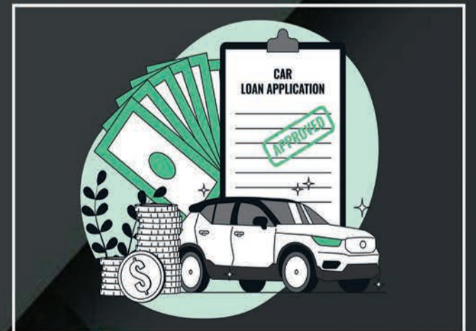
Loan & Insurance

nr. munjka chowk, opp. satadhar petrol pump, new ring road-2, Rajkot.