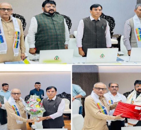
ભારત સરકારના શ્રમ-રોજગાર મંત્રી ડો. મનસુખ માંડવીયા અમદાવાદમાં ખેતી બેંકની મુલાકાતે