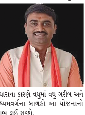
શૈક્ષણિક વર્ષ ૨૦૨૫-૨૬માં આર.ટી.ઈ. હેકળ પ્રવેશ માટે ઓનલાઈન ફોર્મ ભરવાની છ લી છે તા.૧૬/૦૩/૨૦૨૫ના રાત્રીના ૧૨:૦૦ કલાક સુધી રખાઈ હતી પરંતુ ઓનલાઈન અરજી કરવા માટે ગ્રામ્ય વિસ્તારમાં વાર્ષિક રૂ. ૧.૨૦ લાખ અને