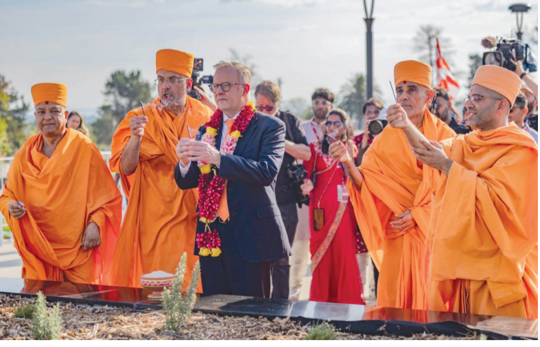
ઓસ્ટ્રેલિયન લોકો વતી હું આપને કહેવા માંગુ છું કે આપનું અહીં સદાય સ્વાગત છે. રંગોનો આ મહાન ઉત્સવ, સૌને આસુરી પર દેવીના વિજયનો ઉત્તમ સંદેશ આપે છે. રંગોનો આ ઉત્સવ ભારતીયોએ ઓસ્ટ્રેલિયન કેલેન્ડરને આપેલી એક ઉત્તમ ભેટ છે. આજે આપણે એક એવા સ્થાનની ઉજવણી કરી રહ્યા છીએ જે આ દેશને મળેલી અમુલ્ય ભેટ છે અને એ છે બી.એ.પી.એસ. સ્વામિનારાયણ હિન્દુ મંદિર અને સાંસ્કૃતિક પરિસર. સ્વામીજીના સંકલ્પ મુજબ આ ભવ્ય મંદિર અહીં આકાર લઈ રહ્યું છે. આ મંદિર એ માત્ર મહાન ઉત્સવ, સૌને આસુરી પર દેવીના વિજયનો ઉત્તમ સંદેશ આપે છે. રંગોનો આ ઉત્સવ ભારતીયોએ ઓસ્ટ્રેલિયન કેલેન્ડરને આપેલી એક ઉત્તમ ભેટ છે. આજે આપણે એક એવા સ્થાનની ઉજવણી કરી રહ્યા છીએ જે આ દેશને મળેલી અમુલ્ય ભેટ છે અને એ છે બી.એ.પી.એસ. સ્વામિનારાયણ હિન્દુ મંદિર અને

રાજકોટ મિરર, તા.૧૭ ઓસ્ટ્રેલિયાના સિડની મહાનગર ખાતેબી.એ.પી.એસ. હિન્દુ મંદિર અને સાંસ્કૃતિક મહંત સ્વામી મહારાજ અને ઓસ્ટ્રેલિયાના વડાપ્રધાન એન્થોની અલ્બેનીઝની ઉપસ્થિતિમાં ભવ્યતાથી રંગોત્સવ ઉજવાયો હતો. મહંત સ્વામી મહારાજ આંતોએ તેમનું પુષ્પહાર અને અમૃત કળશ દ્વારા સન્માન કર્યું હતું. આ પ્રસંગે બી.એ.પી.એસ. સંસ્થા અને મહંત સ્વામી મહારાજના કાર્યોથી પ્રભાવિત થઈ તેમણે પોતાની ભાવોર્મિઓ રજૂ કરતા જણાવ્યું. ‘અહીં આપ સૌ વચ્ચે ઉપસ્થિત રહેવું એ ખરેખર સદ્બ્રાચ્યની વાત છે. મહંત સ્વામી મહારાજના આશીર્વાદ પ્રાપ્ત કરવા બદલ હું મારી જાતને ભાગ્યશાળી માનું છું. આવા પવિત્ર સ્થાન પર, આજના ખાસ ઉત્સવદિને મને આજે અહીં મારી સાથી સભ્યો સાથે આપ સૌ વચ્ચે ઉપસ્થિત રહેવાનો મોકો મળ્યો. મહંત સ્વામી મહારાજનો આ પ્રસંગે આભાર વ્યક્ત કરું છું. તેઓ જે સંદેશ આપે છે તે બધા જ ઓસ્ટ્રેલિયનવાસીઓ માટે છે, કે બીજાના ભલામાં આપણું ભલું છે. સ્વામીજી, અમે આપના ખૂબ આભારી છીએ કે આપે ભારતથી અહીં પધારી આ ઉત્સવ માટે સિડની શહેરની પસંદગી કરી. બી.એ.પી.એસ. સંસ્થાના ૧૧૫ કરતા વધુ વર્ષોના ઈતિહાસમાં આ લાભ બીજાવાર અમને મળી રહ્યો છે. દસ વર્ષ પહેલાં આ સ્થાને જે જ્યાને પ્રસાદીભૂત કરી હતી, આજે એ જ જ્યાએ એ ઉપસ્થિત રહી અમે ધન્યતા અનુભવીએ છીએ.