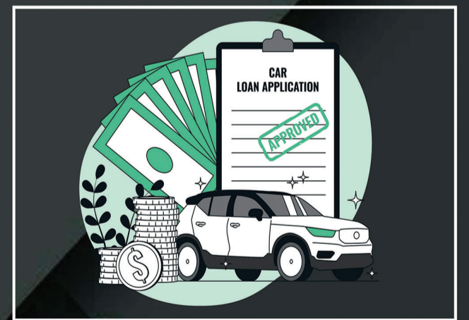
Loan & Insurance