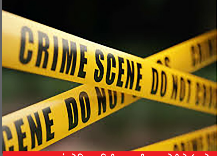
આજના સમયમાં સોશિયલ મિડીયા પર રીલ્સ, સ્ટોરીનો ઉપયોગ મનોરંજનની સાથે સાથે બીજાને ‘ચીડવવા’ કે ‘ભીડવવા’ માટે વધુ થાય છે: આ ઘટનામાં સ્ટોરી મુક્યાનું મનદુઃખ એકનો જીવ લઈ ગયું