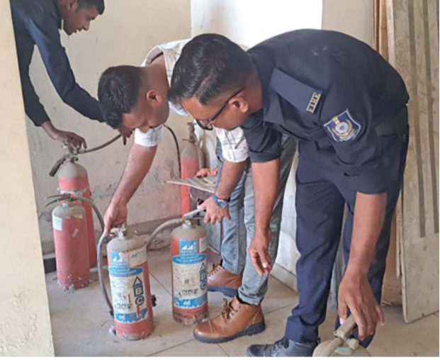
ફાયર સેફ્ટી માટે મોટામાં મોટી ડ્રાઈવ કરવામાં આવી હતી. સરકારે આપેલી વ્યાખ્યા મુજબ શાળા-કોલેજ, હોટલ, રેસ્ટોરન્ટ, લગ્ન હોલ, કોમર્શિયલ બિલ્ડિંગ

રાજકોટ, તા. ૧૭ ટીઆરપી અગ્નિકાંડ જેવી ઘટના થતા રહી ગઈ છતાં પણ ધુળેટીના દિવસે જે એટલાન્ટિસ એપાર્ટમેન્ટમાં આગ લાગી તેમાં ત્રણ લોકોના મોત નીપજ્યા. ત્યારે ગઈકાલે મહાનગરપાલિકાના ફાયર વિભાગના ત્રણ ઝોનના અલગ અલગ વોર્ડમાં જે હાઈરાઈઝ રહેલા બિલ્ડિંગો આવેલી છે તેમાં ફાયર એનઓસી છે કે કેમ અને સાધનોની સ્થિતિ કેવી છે તે અંગેનું ચેકિંગ હાથ ધરવામાં આવ્યું હતું. ગઈકાલે કલાવડ રોડ થી માંડી કોઠારીયા રોડના અલગ અલગ એપાર્ટમેન્ટમાં આ અંગે તપાસ શરૂ કરવામાં આવી હતી જેમાં બેદરકારી અથવા તો વાપરવાહી દેખાય તો નોટિસોની પણ બજવાણી શરૂ કરવામાં આવશે. અત્યાર સુધી જે તપાસ હાથ ધરવામાં આવી હતી તે તપાસ માત્ર ને માત્ર કોમર્શિયલ પૂરતી જ સીમિત હતી પરંતુ હવે રહેણાંકને પણ આરટી લેવામાં આવ્યું છે. હાલ જે ધુળેટીના દિવસે ઘટના ઘટી