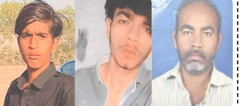
એલસીબી ઝોન-૨ ટીમે રાજકોટના લોહડાની રૂમમાંથી પકડ્યા: એકાદ મહિનાથી અહિ રહેતાં હતાં: અપહત સગીરા પાછા મળી આવી: પિતાએ હેબીયર કોર્પસ દાખલ કરી હતી