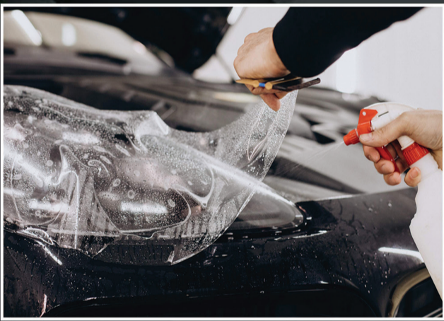
Paint Protection Film