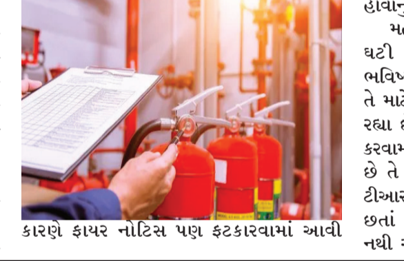
કારણે ફાયર નોટિસ પણ ફટકારવામાં આવી હોવાનું જાણવા મળ્યું છે.

દિવસે આગની ઘટના ઘટી તે બાદ રાજકોટ મહાનગરપાલિકાના વિભાગ દ્વારા સમગ્ર શહેરમાં ફાયર સેક્ટી ની ચકાસણી કરવા માટે ખાસ ઝુંબેશ ચાલુ કરવામાં આવી છે જેમાં ફાયર સર્વિસીસના સ્ટાફને સ્થળ તપાસ માટે મોકલવામાં આવી રહ્યા છે ત્યારે મળતી માહિતી મુજબ ૧૭ માર્ચથી લઈ ૧૮ માર્ચ દરમિયાન શહેરના વિવિધ વોર્ડ વિસ્તારોમાં ફાયર એનઓસી બાબતે કુલ ૧૮૦ જેટલા એકમોની ચકાસણી કરવામાં આવી હતી અને જેમાંથી ૧૪૪ સંકુલોને અપૂરતી ફાયર વ્યવસ્થા તથા ફાયર સાધનોનો અભાવ હોવાના