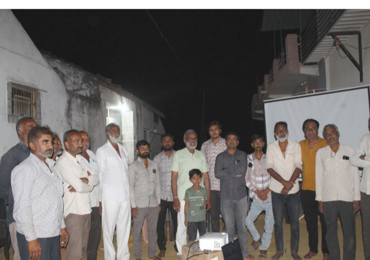
રાજકોટ મિસ્ત્ર, તા. ૧૯ બરવાળા બાવીશી ગામમાં ગીરગંગા પરિવાર ટ્રસ્ટ દ્વારા વરસાદી પાણીનું યોજ્ય જતન કરવા

રાજકોટ મિસ્ત્ર, ગોંડલ તા. ૧૯ તરુણને ઈજા પહોંચતા તાત્કાલિક સારવાર માટે સ્થાનિક હોસ્પિટલમાં ખસેડવામાં આવ્યો હતો. જ્યાં તરુણની તબિયત નાજુક જણાતા વધુ સારવાર માટે રાજકોટ સિવિલ હોસ્પિટલમાં દાખલ કરાયો છે. આ અંગે રાજકોટ સિવિલ હોસ્પિટલ પોલીસ ચોકીના સ્ટાફે ગોંડલ બી ડિવિઝન પોલીસને જાણ કરતા ગોંડલ બી ડિવિઝન પોલીસ મથકનો સ્ટાફ તાત્કાલિક રાજકોટ સિવિલ હોસ્પિટલ ખાતે ગયો હતો. પ્રાથમિક તપાસમાં તરુણ ક્રિકેટ એક્ટેન્ડેન્સીમાં જાય છે અને માર મારનાર બંને સગીરે પૈસા માંગી માર માર્યા હોવાનું જાણવા મળ્યું છે. આ