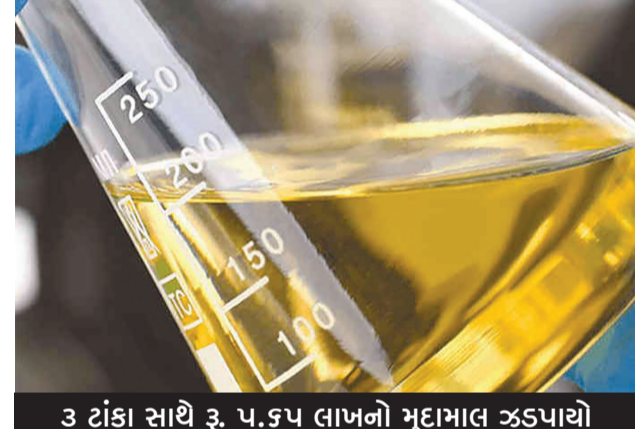
૩ ટાંકા સાથે રૂ. ૫.૬૫ લાખનો મુદ્દામાલ ઝડપાયો