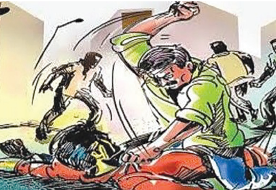
બીજી ઘટનામાં અચાનક રિક્ષાચાલકે કેરીવાહન ઘુસાડી દેનારને રિક્ષાચાલકે સમજાવતાં લોહીલુહાણ કરી દેવાયો: આંખ રહેજમાં બચી

રાજકોટ: એક તરફ શહેર પોલીસ આવારા તત્વોને ગુનેગારોને કાબુમાં લેવા નાઈટ કોમ્બીંગ કરી રહી છે તો બીજી તરફ અમુક ગુનેગારોને આની જરાય દરકાર ન હોય તેમ નાઈટ કોમ્બીંગ વખતે જ હુમલો કરી દીધો હતો. મુંજકા રહેતો અને ધોરણ-૧૨માં અભ્યાસ કરતો છાત્ર રાતે રામાપીર ચોકડીએથી મિત્રો સાથે ટુવ્હીલર પર ઘર તરફ જતો હતો ત્યારે ગંગોત્રી પાર્ક રોડ શિલ્પન ઓનેક્સ બિલ્ડીંગ પાસે ટુવ્હીલર પર આવેલા બે શખ્સે કેમ અમને ગાળ દીધી? કહી ઝઘડો કરી છાત્રને ઝાપટો મારી લીધા બાદ આગળ જઈ સમરસ હોસ્ટેલ