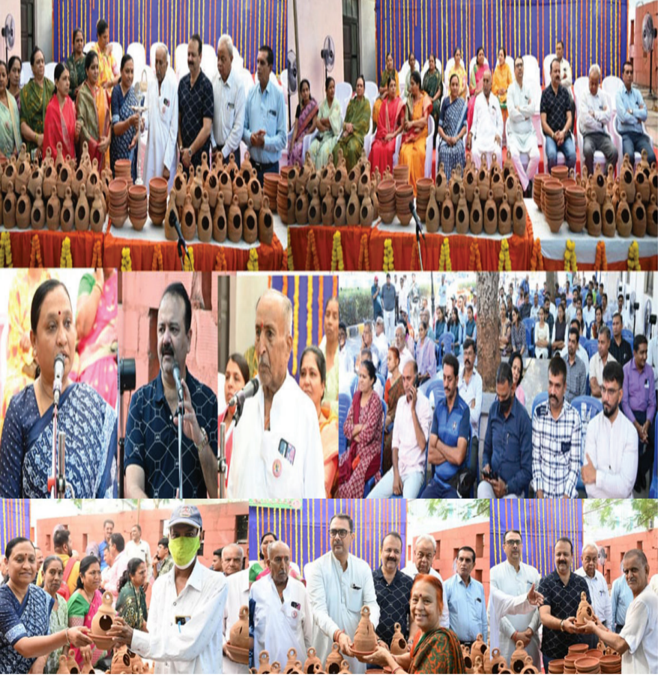
વિશ્વ ચકલી દિવસ નિમિત્તે મનપાએ ૩,૫૦૦ માળાનું કર્યું નિશુલ્ક વિતરણ

રાજકોટ, તા. ૨૦ રાજકોટ મહાનગરપાલિકાના દ્વારા ચકલીની સંખ્યામાં દિન પ્રતિ-દિન ઘટતી જતી હોઈ, લુમ થતી ચકલીઓને બચાવવા અને ચકલીના રક્ષણ માટે છેલ્લા ૧૪ વર્ષથી વિનામૂલ્યે 'ચકલીના માળા' અને 'પાણીના કુંડા' વિતરણ કાર્યક્રમ યોજવામાં આવે છે. ચકલીએ પૃથ્વી પરની સૌથી સામાન્ય અને સૌથી જૂની પક્ષી પ્રજાતિઓમાંની એક છે. ચકલી કદમાં ભલે નાનકડું પંખી હોય પણ તેની વિશેષતાઓ ઘણી મોટી છે. ચકલી વિશ્વમાં સૌથી વધુ ફેલાયેલું પંખી અને વિપુલ રીતે જોવા મળતા પંખીનો ખિતાબ ધરાવે છે. પ્રાણીઓમાં શ્વાનની જેમ જ પંખીઓમાં ચકલીઓએ સમગ્ર વિશ્વના જુદા જુદા પ્રદેશોમાં માનવજાતનો કાયમ માટે સાથ નિભાવ્યો છે. ચકલીની લુમ થતી પ્રજાતિઓ અને ઘટતી જતી વસ્તી ચિંતાનો વિષય છે. આવી સ્થિતિમાં આ દિવસની ઉજવણી કરવાનું વિચારવું એ ખરેખર ચકલીઓ અને અન્ય અદ્રશ્ય થઈ રહેલા પક્ષીઓના સંરક્ષણ