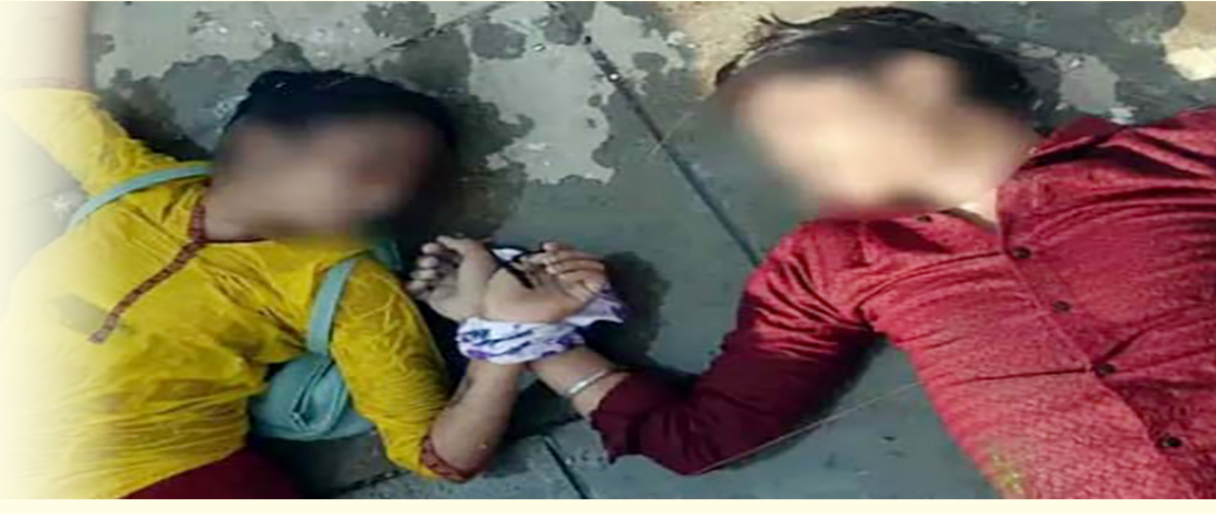
બીજી કડ્ડા ઘટનામાં યુવાન-યુવતિએ દૂપટ્ટાથી હાથ બાંધી નદીમાં કૂદી મોતને વ્હાલુ કર્યું

ત્યારબાદ પાંચથી વધુ લોકોએ જે સીબી મશીન લાવીને યુવકના ફળિયામાં છ ઘરોના પતરા, અડાળા, સંડાસ અને બાથરૂમ તોડી નાખ્યા હતા. આ ઘટનાથી ગામમાં ભયનો માહોલ છવાઈ ગયો છે. યુવકની માતાએ જે સીબીના ચાલક સહિત છ લોકો વિરૂદ્ધ વેડય પોલીસ મથકમાં દાખલ કરવામાં આવી હતી. અપહરણ કરનારાના ઘરને તોડી પાડવાની આ ઘટનાએ સર્વત્ર ચકચાર જગાવી છે.