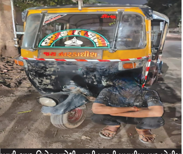
મવડી ફાયર બ્રિગેડ પાસેથી ઝડપી પાડતી માલવીયાનગર પોલીસ