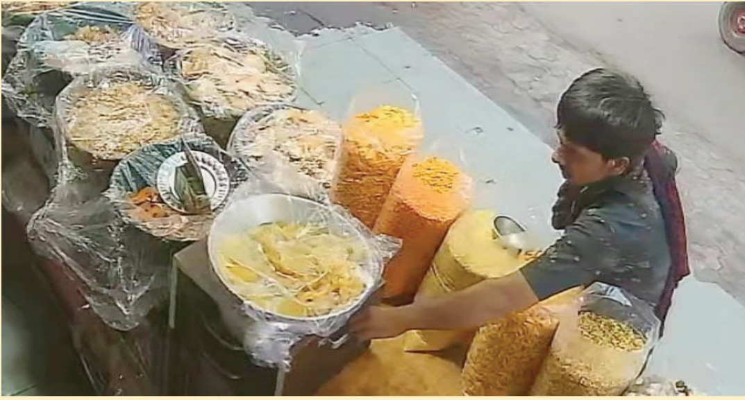
મોબાઈલ ફોન ગાયબ થઈ ગયો હતો. ચોરીનો પ્રથમ બનાવ ગુરૂપ્રસાદ ચોકમાં સ્વાંગમાં આવેલો રિક્ષાચાલક વેપારી વિગતો પર નજર કરીએ તો આવેલી ફરસાણની દુકાનમાં ગ્રાહકના અંદર કામમાં હોઈ થડામાંથી રોકડ

રાજકોટ: નજર હતી દુર્ઘટના ઘટીની જેમ અમુક :ઉઠાવગીરો એટલા ચપળ હોય છે કે તે પળવામાં કોઈની નજર ચુકવી હાથકેરો કરી ભાગી જતાં હોય છે. ચોરીની ઘટનાઓ રોજબરોજ શહેરમાં બનતી રહે છે. અવાર-નવાર ચોર ગઠીયાઓ આ રીતે લોકોની ચીજવસ્તુ ચોરીને ભાગી જાય છે. ઘણીવાર આવી ઘટનાઓ સીસીટીવી કેમેરામાં કેદ થતી હોય છે. વધુ એક આવો બનાવ સામે આવ્યો છે જેમાં શહેરના ગુરૂપ્રસાદ ચોકમાં ફરસાણની દુકાને ગ્રાહક બનીને આવેલો રિક્ષાચાલક વેપારી અંદર કામમાં હોઈ થડામાંથી રોકડ ચોરી છુ થઈ ગયો હતો. તેની આ ચોરી કેમેરામાં કેદ થઈ ગઈ હતી. અન્ય એક ઘટનામાં રેસ્ટોરન્ટમાં જમવા ગયેલા યુવાન જમી લીધા બાદ હાથ ધોવા ગયા અને પાછા આવ્યા ત્યાં સુધીમાં ટેબલ પરથી તેનો