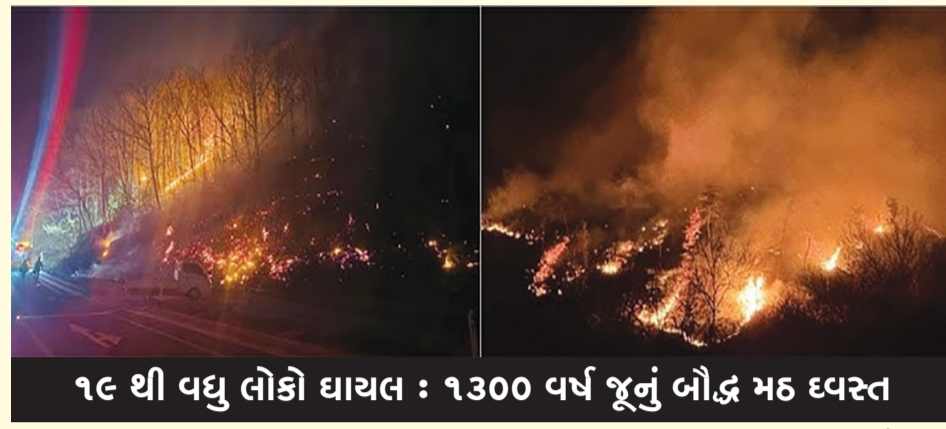
૧૮ થી વધુ લોકો ઘાયલ : ૧૩૦૦ વર્ષ જૂનું બૌદ્ધ મઠ ઘટસ્થ

નવીદિલ્હી, તા. ૨૬ દક્ષિણ કોરિયામાં શુષ્ક હવામાન અને ભારે પવન વચ્ચે જંગલમાં લાગેલી આગમાં ઓછામાં ઓછા ૨૪ લોકોના મોત થયાના અહેવાલ છે. સરકારી અધિકારીઓએ બુધવારે જણાવ્યું હતું કે આ ઘટનાઓમાં ઓછામાં ઓછા ૧૮ લોકો ઘાયલ પણ થયા છે. મંગળવારે એન્ડોંગ અને અન્ય દક્ષિણ શહેરો અને નગરોના અધિકારીઓએ સ્થાનિક રહેવાસીઓને સુરક્ષિત સ્થળોએ જવાનો આદેશ આપ્યો. બીજી તરફ, સુકા પવનને કારણે લાગેલી આગને કાબુમાં લેવા માટે અગ્નિશામકો સખત મહેનત કરી રહ્યા છે. આગ