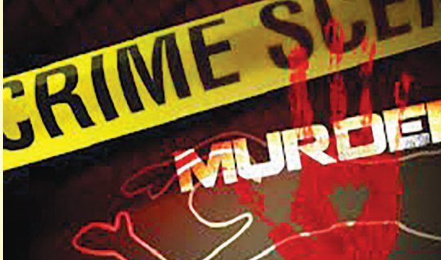
એક ઘટનામાં મિત્રો સાથે બેઠેલા યુવાનને છરીના ઘા ઝીંકી ઢાળી દેવાયો: બીજામાં દાડ પીધા બાદ મિત્રો વચ્ચે બપેડો થતાં એકે બીજાને પાણકાથી પતાવી દીધો

રાજકોટ: ગાળો બોલવા જેવી વાતે ઉછેરાઈને કોઠીત થઈ જતો માણસ કાળજાળ થઈ હુમલા કરી બેસે છે અને ઘણીવાર આવા હુમલા જીવલેણ પણ નીવડી શકે છે. હત્યાની વધુ બે ઘટના સામે આવી છે જેમાં એક યુવાનની ગાળો બોલવા મામલે છરીના ઘા મારી હત્યા કરવામાં આવી છે. આ હુમલામાં વચ્ચે પડેલા સાળા-બનેવી સહિત ત્રણ લોકો ઘાયલ પણ થયા હતાં. બીજી ઘટનામાં દાડ પીધા બાદ ડમ્બો થતાં એક મિત્રને બીજા મિત્રને પથ્થરના ઘા ફટકારી મોતને ઘાટ ઉતારી દીધો હતો. હત્યાની આ બંને ઘટનાને પગલે પોલીસને દોડધામ થઈ પડી હતી. આરોપીઓને ઝડપી લેવા પોલીસ ટીમો બનાવી કામે લાગી હતી.