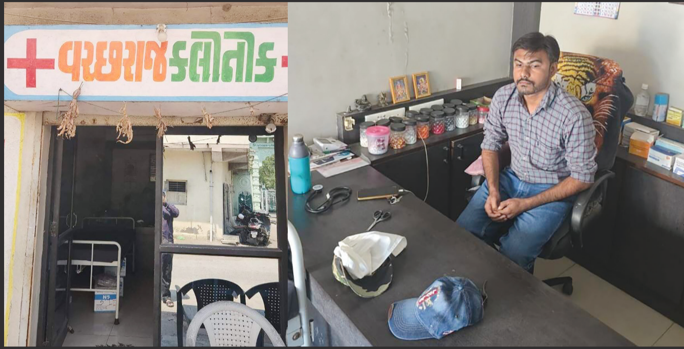
રાજકોટ: રાજ્યભરમાં પોલીસ અવાર-નવાર ડુબીકેટ ડીઝી વગરના ડોક્ટરોને પકડી કાયદાના ઈન્જેકશન આપતી હોય છે. પરંતુ કાયદાની છટકાબારી કહો કે ગમે તે આવા લેખાગુ નક્લી ડોક્ટરો છુટીને ફરીથી લોકોના આરોગ્ય સાથે ચેડા કરવા માંડતા હોવાના પણ અનેક વખત કિસ્સા સામે આવ્યા છે. આ વચ્ચે કુવાડવામાં વચ્ચરાજ કલનીક નામના દવાખાનામાં ડીઝી વગરના ડોક્ટર પ્રેક્ટીસ કરી માનવ હંદગી સાથે ચેડા

પોલીસ કર્મચારી બાતમી મળતાં ખુદ દર્દી બનીને ગયા પછી આરોગ્ય અધિકારી, પોલીસ અધિકારીઓને બોલાવી કાર્યવાહી કરાવી: દર્દી મુજબ ફી વસુલતો' તો આ કહેવાતો ડોક્ટર