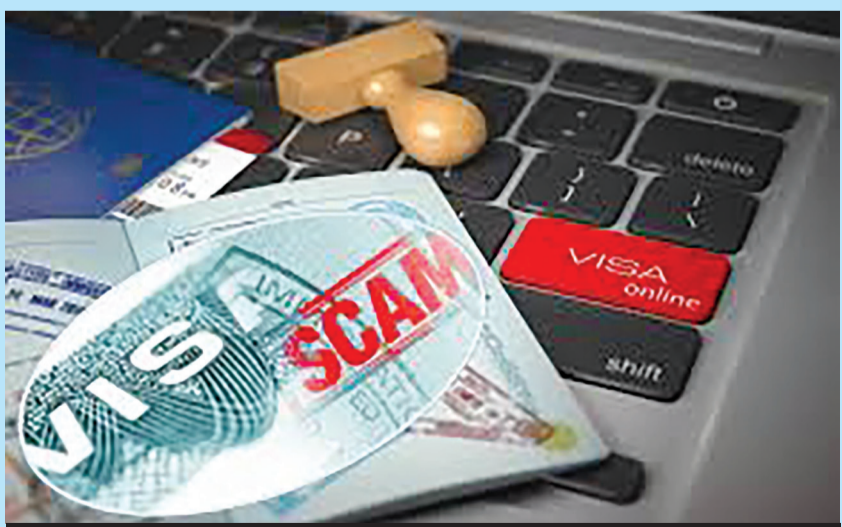
ત્રીજા બનાવમાં હોટેલના રીવ્યુ આપી ટાસ્ક મારફ્ટ કમાણીની લાલચ દઈ મહિલાને છેતરી લેવાયા