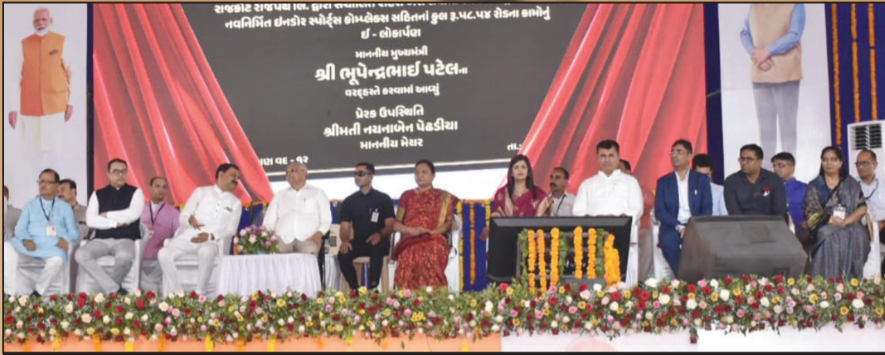
મનપા - રૂડાના રૂ.૫૬૫.૬૩કરોડના વિવિધ વિકાસ પ્રકલ્પોના લોકાર્પણ-ખાતમુહૂર્ત કાર્યક્રમ યોજાયો

રાજકોટ, તા. ૨૬ રાજકોટ મહાનગરપાલિકાના વિવિધ વિકાસ પ્રકલ્પો પૈકી, રૂ.૫૮.૫૪ કરોડના ૪ પ્રકલ્પોના લોકાર્પણ તથા રૂ.૩૩૨.૨૬ કરોડના જુદા જુદા ૩૫ પ્રકલ્પોના ખાતમુહૂર્ત તેમજ રાજકોટ મહાનગરપાલિકા દ્વારા પ્રધાનમંત્રી આવાસ યોજના અંતર્ગત નિર્માણ પામેલ આવાસો પૈકી ખાલી પડેલ ઊંચ-૨ (૧.૫ ઈંચ)ના ૧૩૩, ખર્ચા (૩ ઈંચ)ના ૫૦ એમ કુલ ૧૮૩ આવાસો લાભાર્થી ઓને ફાળવણીનો કોમ્પ્યુટરાઈઝડ ડ્રો તેમજ રાજકોટ શહેરી વિકાસ સત્તા મંડળના વિવિધ વિકાસ પ્રકલ્પો પૈકી રૂ.૧૭૪.૮૩ કરોડના ૬ પ્રકલ્પોના ખાતમુહૂર્ત મુખ્યમંત્રી ભૂપેન્દ્રભાઈ પટેલના વરદ હસ્તે કરવામાં આવ્યું હતું.