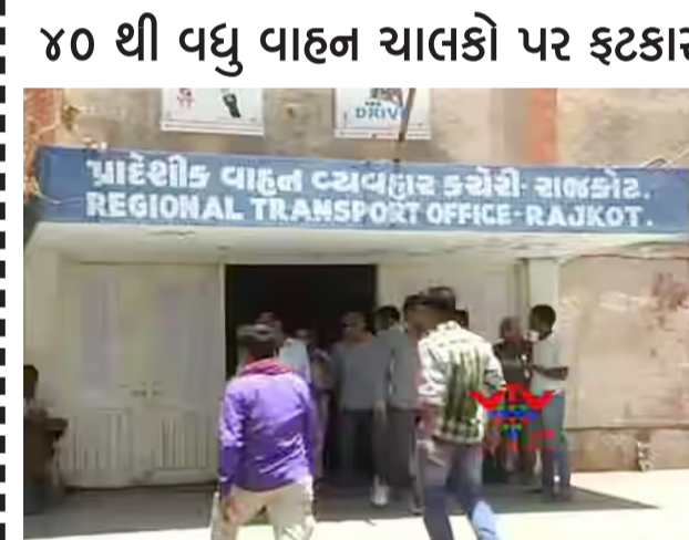
રાજકોટ, તા. ૨૬ રાજકોટ આરટીઓ તંત્ર છેલ્લા ઘણા સમયથી ખાસ ડ્રાઈવ યાલકોની રહી છે ત્યારે આ ચેકિંગ ડ્રાઈવ માં જે પણ લોકોએ વાહન વેરો ભર્યા ન હોય તેના ઉપર આકરા પગલા લેવા માટેની ખાસ વ્યવસ્થા ઊભી કરવામાં આવી છે ત્યારે હાલ માર્ચ એન્ટિંગ હોવાના પગલે આ ચેકિંગ ડ્રાઈવમાં ખાસ કરીને જે વેરો ન ભરનાર ડ્રાઈવરો હોય તેમના પર તવાઈ બોલાવવામાં આવી હતી અને તેઓને દંડ પણ ફટકારવામાં આવ્યો હતો. હાલ ૪૦ થી વધુ વાહન